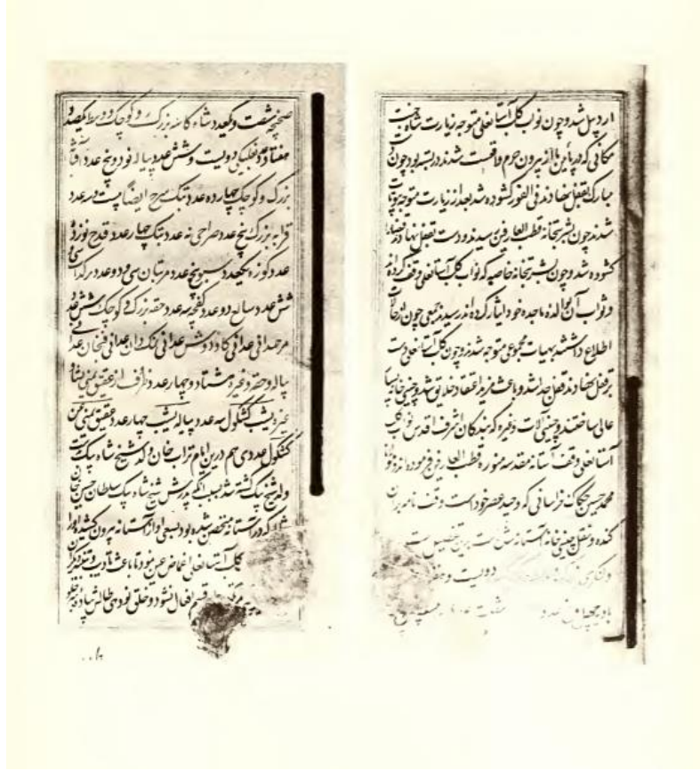
Resim 4: Celeddin Muhammed Münecim Yezdi'nin Tarih el-Abbasi kitabında kaydettiği 11 Ağustos-8 Eylül 1611 tarihleri arasında Şah Abbas tarafından Şeyh Safiyüddin Dergâhına adanmış porselenlerin listesi. (J. A. Pope, 1956, s.10).

Bu koleksiyonun büyük bir kısmı Tahran Ulusal Müzesi'ne nakledilmiştir. Bununla birlikte Tebriz Azerbaycan Müzesi Koleksiyonu'nda yer alan seramiklerin katalog kayıtlarına göre buradaki koleksiyon da Erdebil'den getirilmiştir.