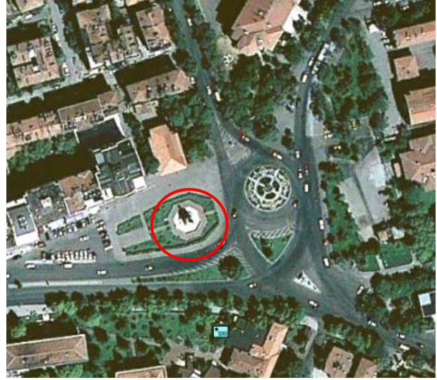
Şekil 18. Konya Atatürk Anıtı'nın konumunun uydu fotoğrafında görünümü.

Biçim: Heykelin ya da anıtın konusu, malzemesi, kütlesi ve çevrenin fiziki nitelikleri onun biçimi ile ilgili olan kavramlardır. Işık, heykelin ya da anıtın biçimi ve kütlesi üzerinde etkili olan bir unsurdur. Örneğin masif ve boşluksuz bir heykel ya da anıtta ışık, parçalanma olanağı bulamadığından anıtsallık artacaktır. Boşluklu yapıtlarda ise ışık, farklı algılama olanakları oluşturarak mekâna dinamizm katacaktır (Karaarslan 1993). Ayrıca farklı doğrultudaki (yatay-dikey) ya da karakterdeki (formal-informal) biçimlerin birlikte kullanımında zıtlık elde etmek de mümkündür.