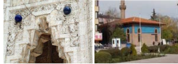
Şekil 20. Kaide detayı ve Amber Reis Camii

Anıtın biçimi düşey olarak algılanmakta, çevrede yapı yoğunluğunun ve yüksekliğin fazla olmaması bu "düşey" algılamayı desteklemektedir. Taç kapıların oluşturduğu boşluklar ve kaidede yer alan zengin hareketli süslemeler heykelin statik özelliğini azaltan unsurlardır. Bu özellik de onu meydana yer alan diğer modern ve tarihi yapılardan ayırmaktadır.