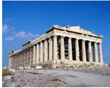
Şekil 2. Parthenon Tapınağı ( http://theallseeingeve.tv/parthenon-and-the-acropolis-landmark-1.jpg )

Anıt kavramı, Batı dillerinde olduğu gibi Türkçe'de de mimarlık ve heykel alanlarını içeren bir terim olarak kullanılmaktadır. Bir olayın, bir kişinin ya da bir topluluğun anısına adanmış, o olay kişi ya da topluluğun anısını yaşatmak amacıyla yapılmış her tür yapı ya da heykel "anıt" kapsamı içine girmektedir. Mimarlık anlamında bir yapının anıt sayılabilmesi için, kentin genel dokusu ya da görünümü içinde, öteki yapıların oluşturduğu tekdüze ve bir örnek çoğunluktan ayrılması, işlevsellikle estetiği, belli bir anlayış çerçevesinde birleştirilmesi, dönemin mimarlığı içinde kişilikli bir yapı özelliğini yansıtması gerekmektedir. Uluslararası Müzeler ve Anıtlar Konseyi (ICOMOS)'nin tanımına göre, koruma bağlamında anıt, "arkeolojik, tarihsel, estetik ya da etnografik önemiyle tanınan ve bundan ötürü korunmaya değer görülen her tür taşınmaz mal"dır (Özsezgin 1991). Anıt, Avrupa Kültürel İşbirliği Konseyi'nin Avrupa Kültürel Mirasının Envanteri çalışmasında ise; "Tarihsel, artistik ya da arkeolojik önemi olan tek yapı veya yapı grupları (cami, kilise, türbe ve diğer mezar anıtları, askeri ve mimarlık örnekleri, tarımsal ve endüstriyel mimarlık örnekleri vb.)" olarak tanımlanmıştır (Şekil 1-2-3-4) (Özyaba 1999).