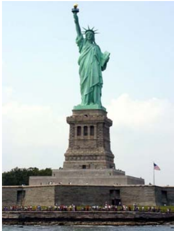
Şekil 4. Özgürlük heykeli

Heykel dalının kuşkusuzca en güç yanını anıtlar oluşturmaktadır. Bir anıtta heykel bulunmakla birlikte, anıt yalnızca bir heykel ve kabartmalar bütünü ya da gereç ve teknik açıdan bir birleştirme değildir. Açık alanlara yönelik olarak tasarlanan anıtlar, kente estetik katkı sağlamalarının yanında mekâna müdahale eden, yaşamın içerisine doğrudan katılarak insan ve toplumları kültürel, sosyal ve psikolojik anlamda etkilemeyi ve değiştirmeyi amaç edinen bir oluşumdur (Güç 2005).