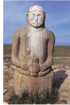
Şekil 10. İnsan figürlü 'Balbal' ( http://www.kesfetmek.com/fotograf/kultur/06449/images/imperiaflex_0_15_0.jpg )

Orta Asya'da Orhon Vadisi'nde Türk dili, tarihi ve sanatı açısından büyük önem taşıyan, üzerlerinde yazıtların yer aldığı taştan anıtlarla karşılaşmaktadır. Yine Orhon vadisinde Lumir başkanlığında, 1958 yılında Çekoslovak Arkeoloji Enstitüsü'nün yaptığı araştırma ve kazılar, Kültigin ve karısını yan yana oturmuş durumda canlandıran mezar anıtının bulunmasıyla sonuçlanmıştır. Çevresinde başka anıtların da yer aldığı bu önemli buluntu merkezinde, ayrıca Kültigin'in heykelleri olan balballara, nöbet bekleyen bir çift koç ve dağ keçisi heykeline, başka parçalara da rastlanmıştır (Şekil 10-11) (Kuban1973).