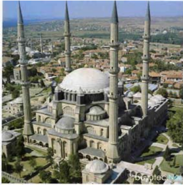
Şekil 7. Selimiye Camii ( http://www.buyutec.net/data/media/42/Edirne_Selimiye-cami.jpg )