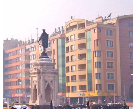
Şekil 16. Anıt ve komşu alandaki çok katlı konutlar

Konya Atatürk Anıtı'nın kaide yüksekliği 6,5 m, heykel yüksekliği ise 2,8 metre olmak üzere anıtın toplam yüksekliği 9,3 metre'dir (Dülgeler ve Yenice 2008). Anıtın kaidesi daha önceden tek başına bir anıt olarak tasarladığından Atatürk Heykeli'ne oranla hacmi büyüktür. Kaide sadece heykeli taşımak işlevini üstlenmeli, heykel ile hacimsel rekabete girmemelidir (Kurtaslan 2005).