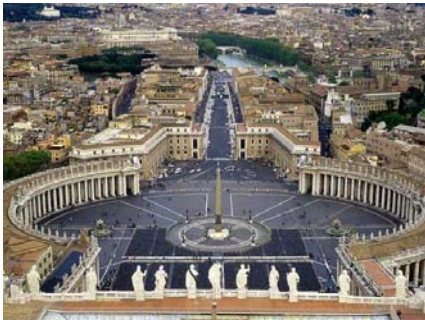
Şekil 3. San Pietro Kilisesi

1964 yılında kabul edilen Venedik Tüzüğü'nde anıtın anlamı genişlemiştir. Venedik Tüzüğü Madde 1'de tarihi anıt kavramı sadece bir mimari eseri içine almamakta, bunun yanında belli bir uygarlığın, önemli bir gelişmenin, tarihi bir olayın tanıklığını yapan kentsel ya da kırsal bir yerleşmeyi de kapsamaktadır (www.restorasyon.org.2003).