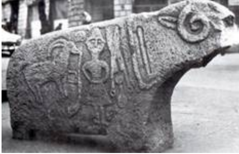
Şekil 11. Dağ keçisi figürlü heykel ( http://www.turkleronline.com/images/Resim_Galerisi/galeri/kultigin_kulliyesinin_de.jpg )

düşüncesi silinmemiş, tersine yaşamakta devam etmiş, başka biçimlere bürünmüştür. Karahanlı, Gazneli ve Büyük Selçuklar zamanında yaygınlık hızlanmış, birbirinden ilginç mezar anıtlarının yaratılması olanağı bulunmuştur (Kuban 1973).