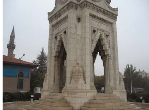
Şekil 14. Konya Atatürk Anıtı'nın Kaidesi olarak kullanılan "eski" Ziraat Anıtı (Orijinal 2009).

Atatürk heykeli, mareşal üniforması ve onu saran bir pelerin içerisinde ayakta durmaktadır.