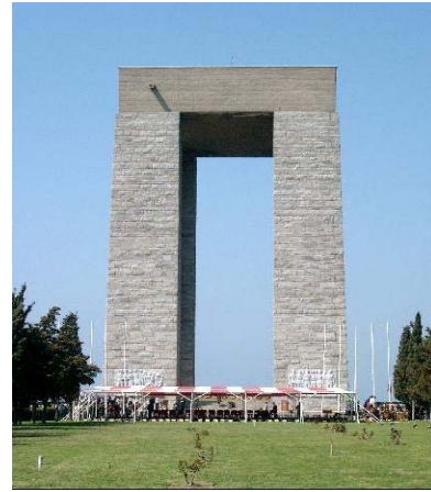
Şekil 13. Çanakkale Şehitleri Anıtı

Cumhuriyet'in kuruluşu Türkiye'de pek çok alanda olduğu gibi heykel sanatı açısından da bir dönüm noktası olmuştur. Heykel sanatının bir kurum olarak gelişimini başlatan en önemli adımlar bu dönemde atılmıştır. Cumhuriyet'in ilanı çağdaşlaşma girişimlerini tüm kültürel kurumları kapsayacak bir eylem dizisine dönüştürerek başarılı olmuştur. Bu başarı, bir ulusal kurtuluş savaşını gerçekleştirmenin siyasal ve moral gücüne dayanmaktadır (Güç 2005). Bu açıdan, Türkiye'de anıt denince, ilk akla gelen şüphesiz Atatürk Anıtları'dır. Cumhuriyet'in ilk yıllarından başlayarak, Atatürk anıtları, ülkenin dört bir yanında meydanlarda, parklarda ve kamu binaları önlerinde yerlerini almışlardır. Bir araya gelişin, ulusal beraberlik ve bütünlük fikrinin oluşumuna katkıları şüphesizdir.