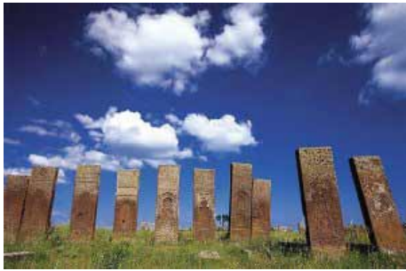
Şekil 12. Mezar Taşları ( http://www.astroset.com/bireysel_gelisim/kadim/images/kr19.jpg )

Anadolu'da çok değişik biçimler içinde gelişme gösteren mezar anıtları ve türbeler, bölgesel özellikleri de benliklerinde eriterek, Anadolu Selçuklu ve Beylikleri devrinde kendilerine özgü görünümlere ulaşmışlardır. Bu konuda zaman zaman insan, hayvan, kuş ve bitkisel kabartmalarla zenginleşen türbelerin yanı sıra mezar taşlarından da söz edilmelidir. Selçuklu ve Beylikler devri mezar taşları da insan, hayvan ve kuş tasvirleriyle bezenmiştir (Şekil 12). Bu tip mezarların ortaya çıkmasını Anadolu'da Şamanizm'in etkisine bağlamak olasıdır (Kuban 1973).