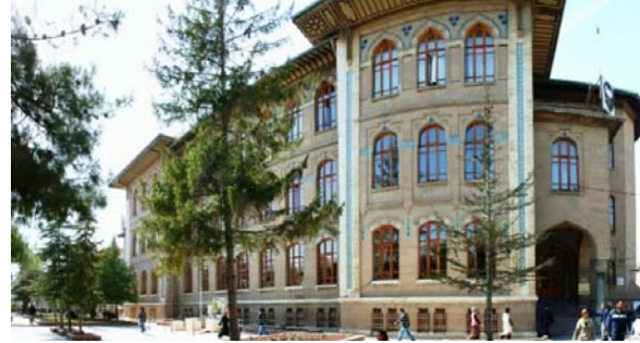
Şekil 16. Konya Gazi Lisesi

Tiyatrosu binası) heykelin yapıldığı döneme denk gelmektedir (XX. yüzyıl başı). Bu açıdan meydana karakterini veren yapıların anıt ile kronolojik açıdan uyum içerisinde olduğu söylenebilir.