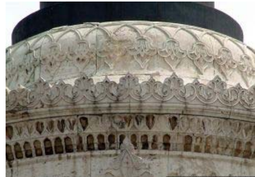
Şekil 23. Kaide süslemeleri detayı. ( http://wowturkey.com/forum/viewtopic.php?t=16212&start15 )

Bir meydana merkeze yerleştirilen heykel, çevresindeki mekânı organize etmektedir. Bu heykel insanları çevresine çekerek meydan üzerinde güçlü bir çevresel etki yapmaktadır. Farklı yazarlara göre değişken olmakla birlikte meydanın merkezi, aktiviteler için boş bırakılmalıdır (Kurtaslan 2005).