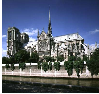
Şekil 1. Notre-Dame Katedrali

"Anıt" sözcüğü ise "anmak" fiili ile ilişkili olarak: bir şeyin (olay, kişi vb.) anılması amacı ile yapılan yapıt anlamına gelmektedir. Osmanlıca'da "âbide" sözcüğü ise değişik kökenli: "âbid (sonsuz, ebedi)" kökünden türemiştir. Burada "anıyı sonsuzlaştırmak" anlamına yer verildiği görülmektedir. Bütün Romen dillerinde kullanılan ve İngilizce'ye de geçmiş olan "monument, monumento" sözcüğü de Latince "monere" (hatırlamak) kökünden gelmekte ve benzer anlam taşımaktadır (Kuban 1973).