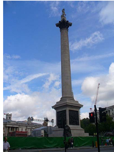
Şekil 5. Trafalgar Anıtı