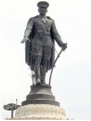
Şekil 16: Konya Atatürk Anıtı'nda Atatürk figürünün görünümü (Orijinal 2009).

Konu: Bir açık alan heykelinin konudan öte sadece plastik etkileri ve mekânla olan ilişkileri doğrultusunda oluşturulup yerleştirilebilir olması ile birlikte (Kabaş 1976), bir anıt her zaman bir konuya sahip olmalıdır. Anıt kavramının anlamında yer alan anmak eylemi de bunu gerektirmektedir. Anıtın konusu onun anlattığı bir hikâye, temsil ettiği bir olay ya da kişi olabilir. Konya Atatürk Anıtı da bir tarım kenti olan Konya'ya referans vermekte, aynı zamanda askeri kostümlü Atatürk heykeli de Cumhuriyet'in ruhunu ve aynı zamanda Atatürk'ün tarıma verdiği önemi yansıtmaktadır. Kaidenin üzerinde yer alan geometrik süslemeler ve bitkisel motifleri içeren süslemeler ziraat anıtı konseptini güçlendirmektedir.