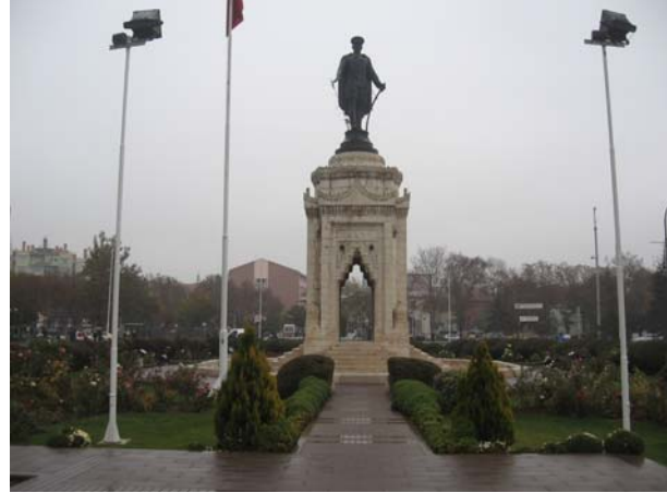
Şekil 15. Anıtın genel görünümü (Orijinal 2009).

Kaide olarak kullanılan Ziraat Anıtı 96 cm yüksekliğinde her bir kenarı yaklaşık 6 m uzunluğunda olan sekizgen bir platform üzerine yerleştirilmiştir. Anıt dört cephede taç kapı şeklinde tasarlanmıştır. Bu taç kapılara her yönden 6 basamakla ulaşılmaktadır (Dülgerler ve Yenice 2008).