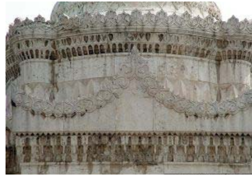
Şekil 22. Kaide süslemeleri detayı. ( http://wowturkey.com/forum/viewtopic.php?t=16212&start15 )

Anıt, yapısına uygun ve doğru bir mekânda sergilenmediğinde, mekân ise konumuna uygun ve yapısıyla örtüşen bir sanat yapıtıyla buluşturulduğunda anıt ve alan birlikteliği işlevlerini sürdürebilecektir (Güç 2005). Sitte'ye göre kentsel tasarımcıya rehberlik edecek bir takım kuralları olmalıdır. Örneğin heykeller, Ortaçağ ve Rönesans kentlerinde olduğu gibi trafik sirkülasyonunun olmadığı meydanlarda sergilenmelidirler (Kurtaslan 2005).