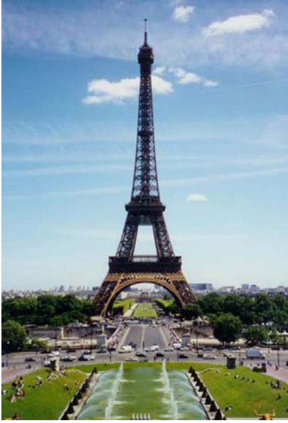
Şekil 6. Eiffel Kulesi