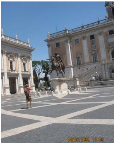
Şekil 9. Campidoglio Meydanı (Orijinal 2009).

Rönesans'ta heykel, ilk defa mekân kurucu olarak Michelangelo'nun Roma'da Campidoglio meydanına yerleştiği Marcus Aurelius heykeli ile kent meydanında yerini almış, mimari yapı ve çevre ile bağımsız bir biçimde ilişkiye girmiş ve kent görüntüsüne yeni bir anlam kazandırmıştır (Şekil 9) (Turani 1992).