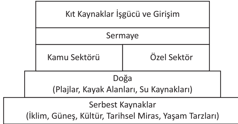
Şekil 1: Seyahat Ve Turizm İçin Önem Taşıyan Kaynaklar

Kaynak: İçöz, O., & İçöz, O. (2018). Turizm Arz ve Talebi. A. Üniversitesi içinde, Genel Turizm Bilgisi (s. 99). Eskişehir: Anadolu Üniversitesi.