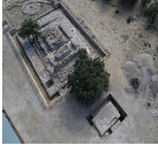
Aleksandreia Troas Tiyatro ve Aleksandreia Troas Tapınak