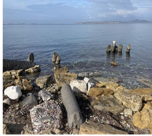
Herodes Atticus Hamamı ve Aleksandreia Troas Limanı