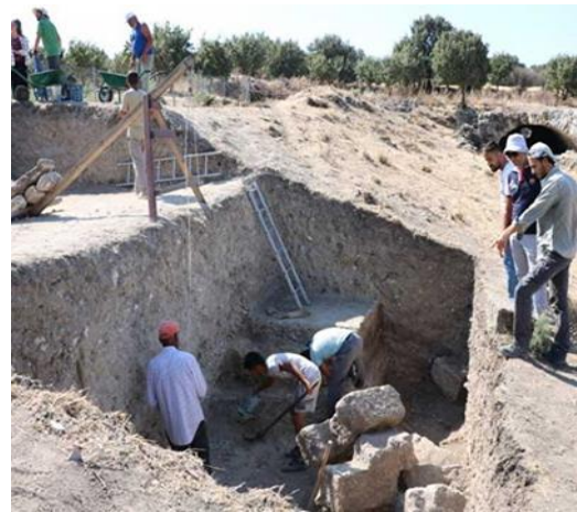
Aleksandreia Troas Taş Ocakları ve Aleksandreia Troas kazıları