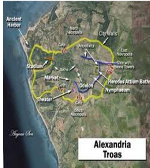
Aleksandria Troas Kent Planı