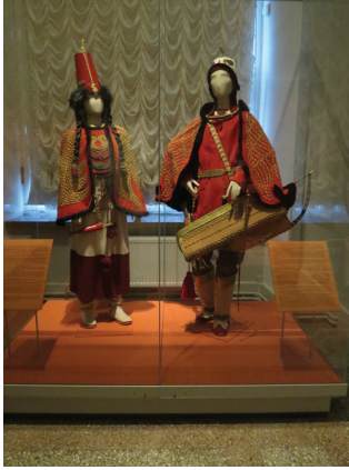
Görsel G. Sazak'a aittir (2014).