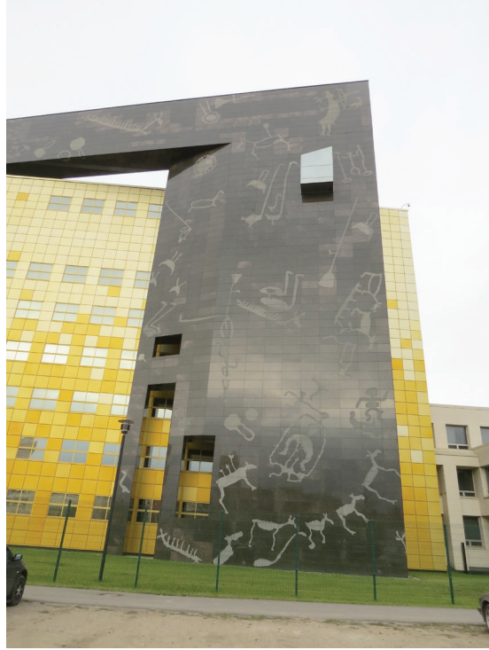
Resim7: “Modern Ermitaj-Staraya Derevnya” Restorasyon ve Konservasyon Merkezi'nin Ana Girişi.

kuruluş yıldönümünün kutlandığı 2014 yılında açılmıştır. Yeni açılışların gerçekleştiği gün gezme fırsatını bulduğumuz bu merkezin ana girişindeki binayı tüm Türkologların ve Türk sanat tarihçilerinin görmekten övünç duyacağı kaya resimlerinden esinlenerek yapılan siyah granitten bir kuşak çepeçevre bir şekilde sarmaktadır. Bu granit kuşak merkezin anıtsal, sanatsal ve korumacılık açısından son derece iddialı ve sahiplenici olduğunu ifade etmektedir (Resim 7).