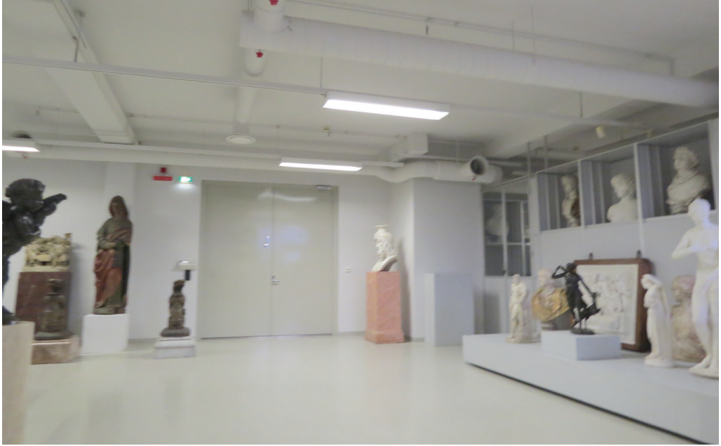
Görsel G. Sazak'a aittir (2014).