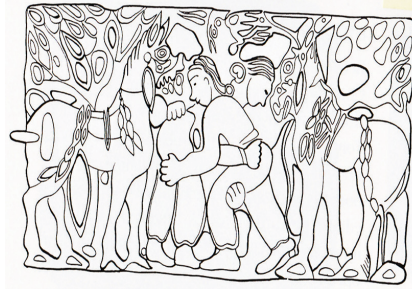
Görsel E. Bunker'e aittir (2007).

Bir başka eser, Baykal Gölü Bölgesi (Harita 1, H6) Derestuy Kurganından bronz kemer tokasıdır. MÖ 1 – MS 1. yüzyıla tarihlendirilmektedir. 15 Türklerde önemli bir devlet sembolü olan kemer tokası madenine göre takan kişinin mertebesini belirtmektedir (Resim 4). Bu kemer tokasının üzerinde yer alan ve yine Türk kültürünün metafizik dünyasını yansıtan en önemli motiflerden kut-güç alış veriş sahnesi 16 sanata dökülmüştür.