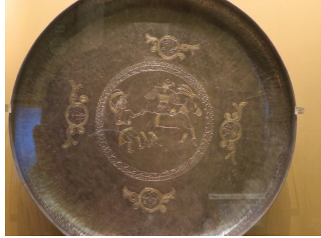
Görsel M. Yücel ve G. Sazak'a aittir. (2012).

Son arkeolojik örnek ise, İdil-Kafkas bölgesinden (Harita 1, H12) tahminen M.S. 9 (?) yüzyıla tarihlenen gümüş tabaktır. Üzerindeki motif ve semboller Türk sanatının manasının izlediğimiz coğrafya boyunca süreklilik gösterdiğine işaret etmektedir (Resim 6). 19