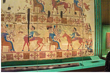
Görsel G. Sazak'a aittir (2012).