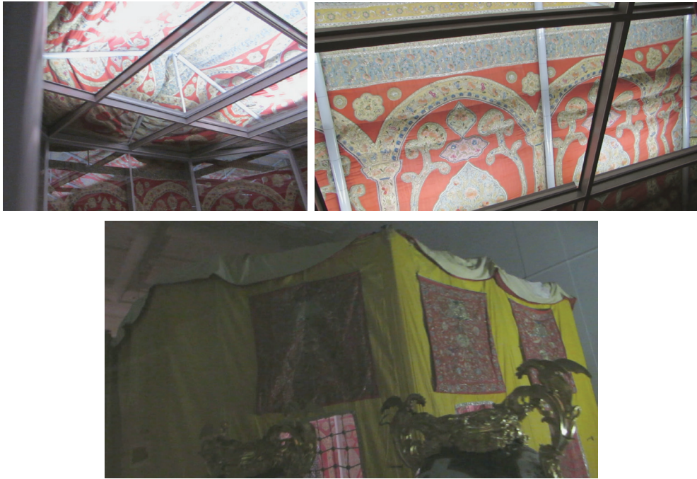
Resim 10: III. Selim'in II. Katerina'ya hediye ettiği otağ.

Bu merkezde korunan Türk kültürüne ait eserlerden birine özellikle dikkat çekmek gerekir. Bu çok kıymetli eser, III. Selim Han'ın Rus Çarıçesi II. Katerina'ya hediye olarak gönderdiği ve Ermitaj Müzesi bünyesinde ilk kez sergilenen "Türk Otağı"dır (Resim 10). Bu otağ Rus İmparatoriçesine 1787 Rus-Türk savaşı sonunda imzalanan Yaş Muahedesi'nden sonra hediye edilmiştir. Hediye St. Petersburg'a altı ay süren uzun bir yolculuk sonunda 1793-94 yılında sefir Mustafa Rasih Paşa getirmiştir 22 . Otağ, cam ve alüminyumdan yapılmış bir iskelet üzerine giydirilmiş şekilde sergilenmektedir. Bu şekilde ziyaretçilerin hiç biri otağ ile temas edememesine rağmen otağın içinde gezebilmektedir. Otağın cam iskelet dışında kalan kısımları ise özel iklimlendirme ve ışıklandırılması yapılmış ortamda korunmaktadır.