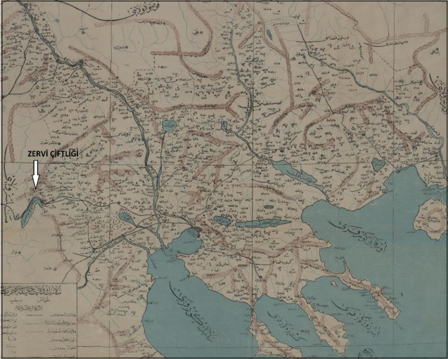
Harita 4: Selanik Vilayeti Haritası (HRT.h, 325)