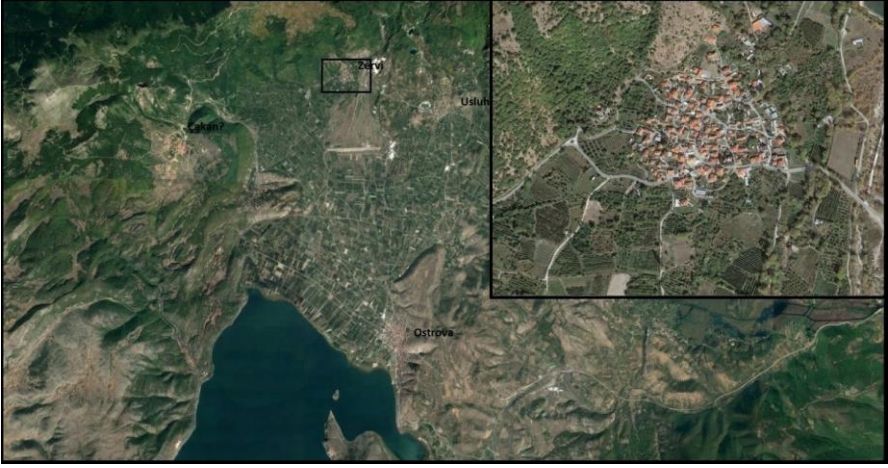
Harita3: Günümüzde Zervi Çiftliği ve Çevresini Gösterir Harita