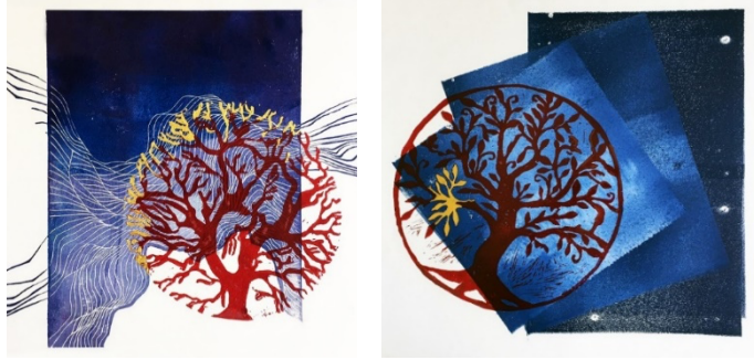
Şekil 17-18. Zeliha Kayahan, Hayat Ağacı Serisi, Karışık Teknik, 2021

Linol baskının en büyük avantajlarından birisi de baskı işleminin makine ile yapılmasının yanı sıra el ile de basımın mümkün olmasıdır. Bu durum farklı işleme tabi olmuş tasarımsal yüzeylere linol baskının uygulanabilirliğini sağlamaktadır. Genel bir açıklama ile bu durum tasarımdaki kontrol edilebilirliği artırmasının yanı sıra kompozisyonun katmanlar halinde oluşturulmasına da olanak tanımaktadır. Şekil 15 ve 16'da yer alan renk uygulamalarının ve belirli bir tasarımın yapılmış olduğu zeminlerin üzerine uygulanan linol baskıyı görmek mümkündür. Bu durum baskı ile oluşturulan katmanlı yapının üzerine bir diğer katman olarak elle müdahale edilmesine de olanak tanımaktadır.