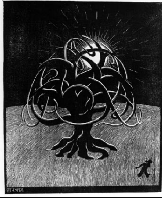
Şekil 11. M.C. Escher, Tree, woodcut print, 1919.