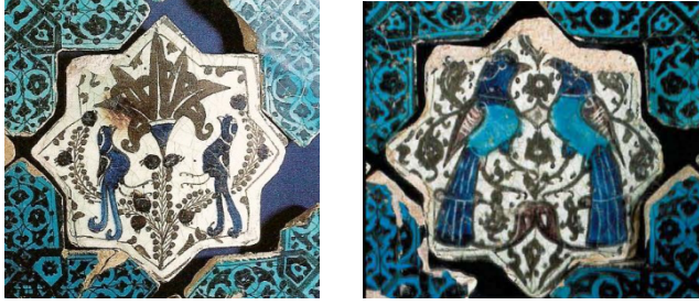
Şekil 9-10. Kubad Âbad Sarayı Çinileri, 13. Yüzyıl.

Şekil 9 ve 10'da yer alan Kubadabad Sarayı çinilerinde hayat ağacının iki farklı örneği iki kuş ve tavus kuşları ile birlikte kullanılmıştır (Öney, 1988' den Aktr. Papagan, 2018:61-62). Beyaz zemin üzerine çok renkli bir anlatımı gördüğümüz eserler ağaçların dönemin biçim ve üslup anlayışı çerçevesinde stilize edildiği görülmektedir.