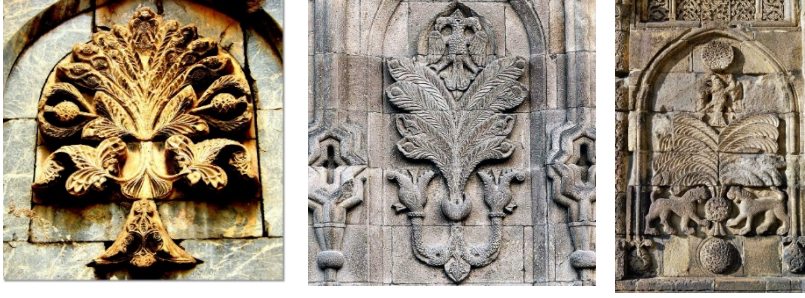
Şekil 6. Sivas Gökmedrese, Hayat Ağacı