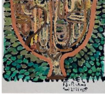
Şekil 12. Bedri Rahmi Eyüboğlu, Hayat Ağacı, Kumaş Üzerine Baskı, Yazma.