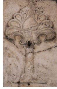
Şekil 1. Silindir Mühür, Kuş ve Geyiklerle Birlikte Stilize Yaşam Ağacı, Mezopotamya.