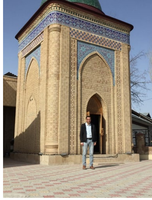
Resim:2 Özgen İmam Serahsi Türbesi ve Camii: Yazar tarafından oluşturulmuştur. (11.04.2023)