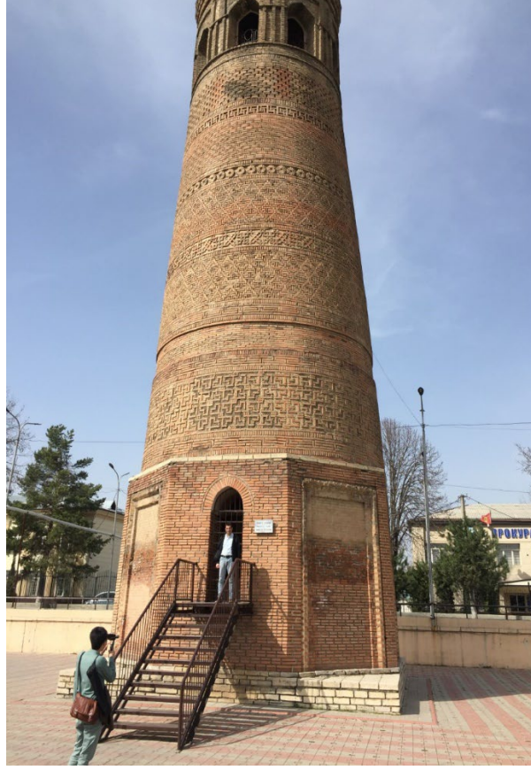
Resim:1 Özgen Minaresi: Yazar tarafından oluşturulmuştur. (11.04.2023)