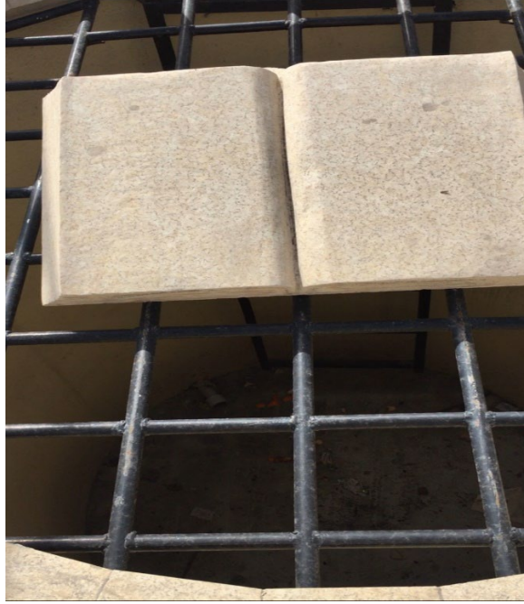
Resim:3 Hücre (Hapishane): Yazar tarafından oluşturulmuştur. (11.04.2023)

Resim 3'te Külliye'nin avlusunda hücre olarak bilinen, 1 metre derinliğinde yuvarlak ve üzeri demir parmaklıklarla çevrilmiş bir yer bulunmaktadır. Hapis 3 hayatında İmam Serahsi'nin burada yıllardır kaldığı araştırmalarda geçmektedir.