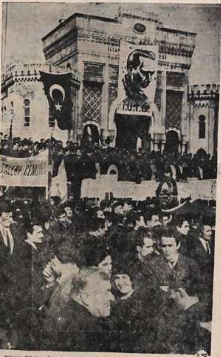
Birleşmiş Milletlerin Kıbrıs konusunda aldığı kararın protestosu için dün yapılan mitingde bir görünüm

TÜRK DE İTTİFAKÇI AKIMLARIN İTTİFAKÇILIK -AKIMLARIN POLİTİKASI İSTANBUL'da dün saat 17.00'te Çarşı Meydanı meydanında toplanarak, Millîyetçi Halkın Birliği ve Türk Halkı İttifakı'nın bir araya gelmesiyle bir miting yapıldı. Mitingte konuşan Rauf Denktaş, "Kıbrıs'ın mutlaka çıkarılması için son sözü söylemişlerdir. Aksi halde Kıbrıs'ı kaybederiz, demeyiştir.