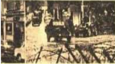
100 kişiyle Yıkılan bin yıllık yapılar ve binlerce kişi öldü

(Yatırım 5 saat süresinde bitirilecektir)