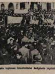
Birleşmiş Milletlerin Kıbrıs konusunda aldığı kararın protestosu için dün yapılan mitingde bir görünüm