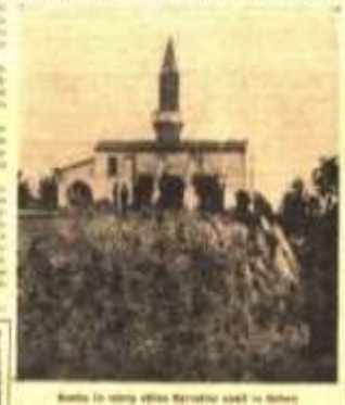
100 kişiyle Yıkılan bin yıllık yapılar ve binlerce kişi öldü

İnönü, Bakanlar Kurulu toplantısında, Kıbrıs adasının barış ve huzurunu sağlamak için yapılacak işleri konuştu. İnönü, Kıbrıs adasının barış ve huzurunu sağlamak için yapılacak işleri konuştu.