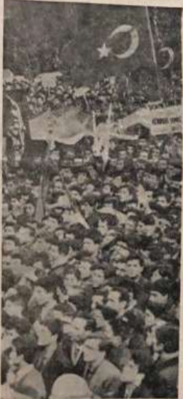
Dün Ankara'da yapılan mitingde bir görünüm

" Aşırı akımlarla mücadelede kararlıyız "