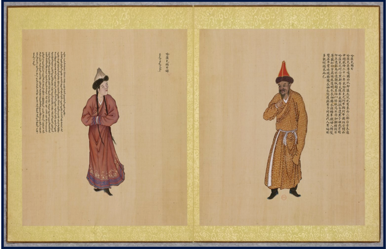
1. Kazak Kabile Reisi (ve) Kazak Kabile Reisinin Eşi