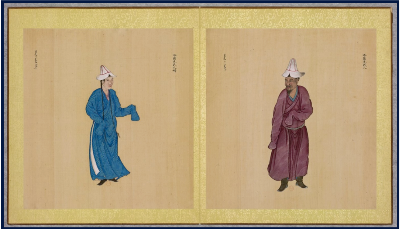
2. Sıradan Kazak (ve) Sıradan Kazak'ın Eşi