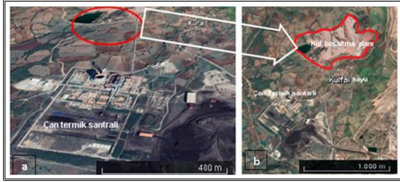
Şekil 2. a. Google Earth uydu görüntüsünde Çan Termik santrali görünümü (Görüntü tarihi 21.03.2021 Kamera 1,439 m 40*01'48*N27*01'12"E 165 m) b. Google Earth uydu görüntüsünde Çan Termik santrali kül boşaltma alanı görünümü (Görüntü tarihi 28.03.2021 Kamera:7,030 m)

Çalışmada kullanılan Çan Termik Santral uçucu külünün analizi Çanakkale Onsekiz Mart Üniversitesi Bilim ve Teknoloji Araştırma Merkezi'nde ICP-OES (İndüktif Eşleşmiş Plazma/Optik Emisyon Spektrometresi) cihazı ile gerçekleştirilmiştir. Külün içerdiği metal konsantrasyonu sırasıyla Al(156,1mg/Kg)>Fe(69,36mg/Kg)>Ni(49mg/Kg)>Zn(23,82mg/Kg)>Cr(10,38mg/Kg)>Cu(3,90mg/Kg)>Pb(3,59mg/Kg) Cd (0,08mg/Kg)>Mn (-0,34mg/Kg)Co (-0,93mg/Kg) ile kimyasal içerikleri; Na,(1277mg/Kg)> Ca (542,3 mg/Kg),>Mg(350,4 mg/Kg)> P (308,2 mg/Kg)>K(166,7 mg/Kg)>B (2,03 mg/Kg) , pH aralığı 8,10 ve tuzluluk 1,6 (g/lt) olarak tespit edilmiştir..