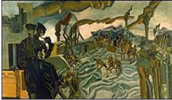
Resim 7; “Bombalanmış Batarya”, 1919, tuval üzerine yağlı boya, 152.5x317.5 cm. Imperial War Museum-Londra.

Birinci Dünya Savaşı'nı konu alan ve bilinen en önemli çalışmalardan biri de, sanatçı Lewis'e ait olan “bombalanmış batarya’dır”. (Arkın, 1970:389.). Wyndham Lewis, yaptığı çalışmada Kübizmin ve Fütürizmin etkilerini bir arada kullanmıştır. Resimde ilk dikkati çeken unsur, birer robota benzeyen ve geometrik hatlarıyla beliren askerler ile bombalanmış bataryanın yarattığı dalgalı ve hareketli görünümüdür. Özellikle, zeminde oluşan dalgalı görünüm hareketli bir denizi çağrıştırmaktadır. Ön sırada bulunan askeri üst düzey subaylar, emir erlerini teftiş etmektedir. Bomba etkisiyle oluşan dumanlar da, resmin farklı anlatım tekniğine uygun betimlenmiştir. Resim, bütünüyle yarattığı mekanik hava ile benzerlerinden ayrı bir yere sahiptir. (Yapı-Endüstri Merkezi Yayınları, 1996.).