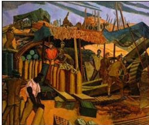
Resim 8; “Mermi Cephaneliğinde Kanada Müfrezesi”, 1918, tuval üzerine yağlı boya, 305x362 cm, National Gallery of Canada, Ottawa.

Birinci Dünya Savaşı'nı konu alan ve bilinen en önemli çalışmalardan biri de, sanatçı Lewis'e ait olan “bombalanmış batarya’dır”. (Arkın, 1970:389.). Wyndham Lewis, yaptığı çalışmada Kübizmin ve Fütürizmin etkilerini bir arada kullanmıştır. Resimde ilk dikkati çeken unsur, birer robota benzeyen ve geometrik hatlarıyla beliren askerler ile bombalanmış bataryanın yarattığı dalgalı ve hareketli görünümüdür. Özellikle, zeminde oluşan dalgalı görünüm hareketli bir denizi çağrıştırmaktadır. Ön sırada bulunan askeri üst düzey subaylar, emir erlerini teftiş etmektedir. Bomba etkisiyle oluşan dumanlar da, resmin farklı anlatım tekniğine uygun betimlenmiştir. Resim, bütünüyle yarattığı mekanik hava ile benzerlerinden ayrı bir yere sahiptir. (Yapı-Endüstri Merkezi Yayınları, 1996.).