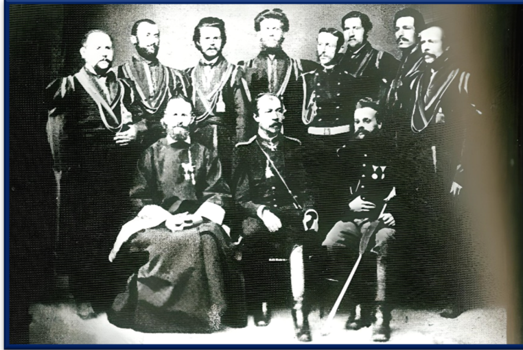
General Çernayef ve Onun Kurmayları, Sırbistan 1876.