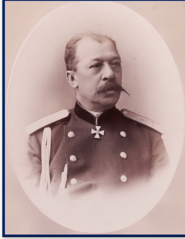
General Mihail Çernayef