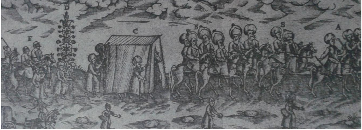
*16. yüzyılda bir düğün alayı (Sakaoğlu, 2009, s.218)