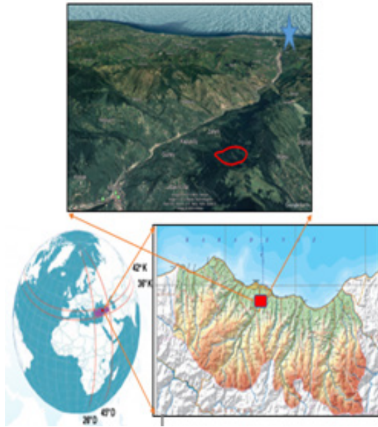
Şekil 1. Araştırma alanı Figure 1. The study area

Araştırma sahası, Karadeniz Bölgesi'ne ait Doğu Karadeniz Bölümü'nde bulunan Trabzon ilinin Maçka ilçesi Zaferli Mahallesi Mevkiinde 40°48'40" K-39°38'51"D ve 40°48'58"K-39°39'12"D boylamında bulunmaktadır. Genel olarak dağlık araziye sahip bu sahanın ortalama yükseltisi 1042 m, ortalama eğimi %56,8 ve hakim bakışı kuzey-kuzey batıdır (Şekil 1).