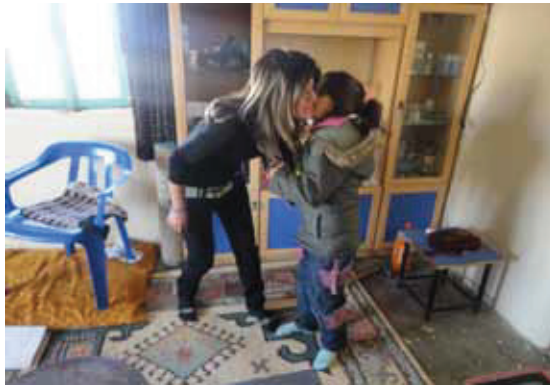
Resim 9: Ezi bayramından, bayramlaşma detayı.