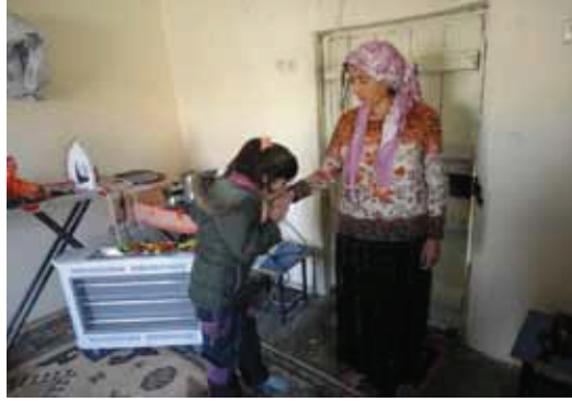
Resim 8: Çevrede yaşayan müslüman köylülerin çocukları Ezidi komşularının ellerini öperek, bayram harçlıklarını istemektedirler.