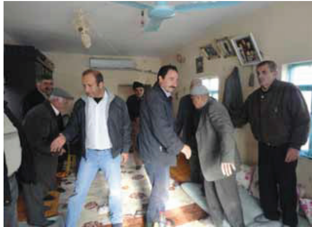
Resim 6: Çevre Köyde yaşayan Müslümanlar Ezidi komşularının Ezi bayramı kutlamakta.