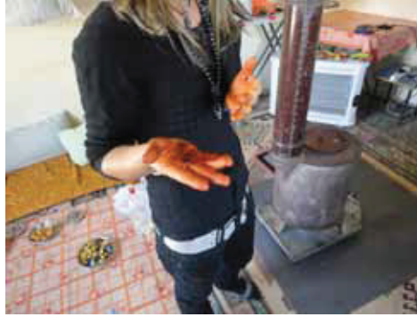
Resim 10: Kızların eline kına yakması.