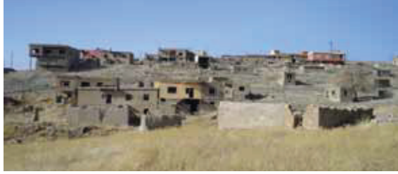
Resim 1: Bir zamanlar Yezidilerin yoğun olarak yaşadığı Fakira Köyü, Günümüzde bir kaç aile ikamet etmektedir. Köyün büyük bir kısmının boş olması nedeni ile köy, harabe görünümündedir.

mız, yařadığımız ve yařatmaya çalıştığımız geleneksel kültürümüzden farklı olmaması Anadolu kültürünün 1000 yıllık kültürel motifleri ile örtüştüğünü bir kez daha göstermesi açısından çok önemlidir.