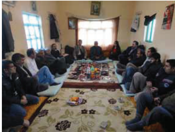
Resim 3: Ezidiler son derece konuksever olduklarından dolayı evlerine gelen misafirlere mutlaka yemek ikram ederler. Bayram günü gün boyu sofa yerde kalır