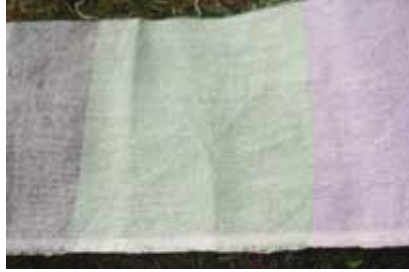
Son yıllarda dokunan renkli kumaş örneği