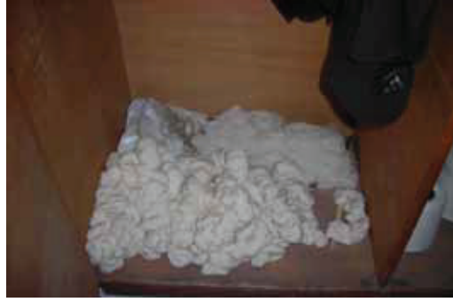
Kumaş dokumasında kullanılan pamuk iplikler