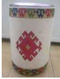
Elde dokunmuş kumaştan puf yapılmış ve kumaş boyama yapılarak desenlendirilmiş.