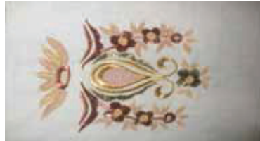
Son zamanlarda dokunmuř ve Marař iři tekniđi ile desenlendirilmiř kumař.