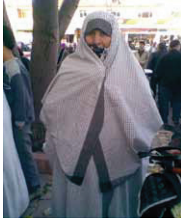
Hacılar y6resi kadınlarının evden 7ıkarken giydikleri el dokuması kumařından yapılmıř “7ar”