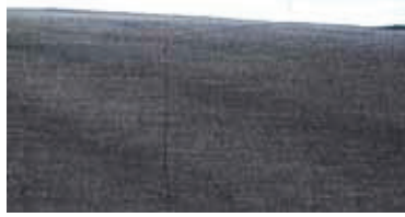
Diril/Tiril kumař dokuma 6rneđi