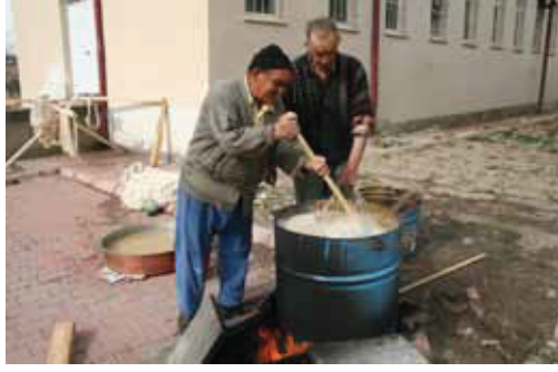
İplere "Şoylama işlemi" yapılması.