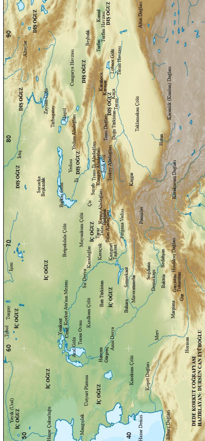
Harita 2. Dede Korkut Coğrafyası