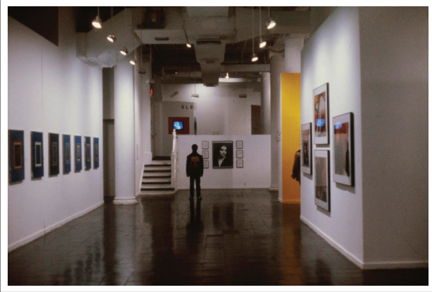
Şekil 1. The Art of The Memory: The Loss of History , New Museum of Contemporary Art, 1985.