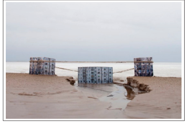
Şekil 3. DOM (Document object Model), Julia Borissova, 15x20 cm, 2014.