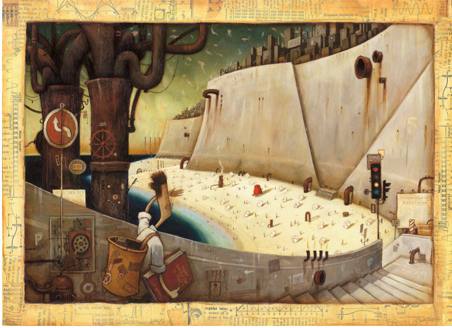
Görsel 8. Shaun Tan, 1999, Plaj /Beach. Erişim: 07.05.2023. Kayıp Şey. https://www.shauntan.net/thelost-thing-book

“Bazen hala o kayıp şeyi düşünüyorum. Özellikle de göz ucuyla oraya ait olmayan bir şey gördüğümde. Anlarsınız ya, hani o tuhaf hüzünlü kaybolmuş gibi görünen şeyler” (Tan, 2014, s. 30). Tan tarafından “ilgilenecek daha önemli şeyleri olanlar için bir öykü” olarak nitelenen roman, toplumda yabancılaşma hissi yaşayan insanların duygusal durumunu anlatan güçlü bir metafor olarak kabul edilebilir. Aynı zamanda, grafik romanın bütününde kullanılan görsel imgeler ve illüstrasyonlar, hikâyenin duygusal derinliğini artırır niteliktedir. Shaun Tan'ın çizimleri, kaybolmuş şeyler evi gibi fantastik yerleri tasvir ederek, okuyucuyu bu evrene çeker (Görsel 9) Ayrıca, kitabın içeriği, herhangi bir yaş ve kültürden insanın anlayabileceği şekilde, çok katmanlı ve evrensel olarak tasarlanmıştır. Bu bağlamda Shaun Tan'ın “Kayıp Şey” adlı eseri, duygusal bir yolculuk sunan ve yabancılaşma, kabul edilme, aitik hissi gibi evrensel temaları işleyen bir başyapıt olarak kabul edilebilir.