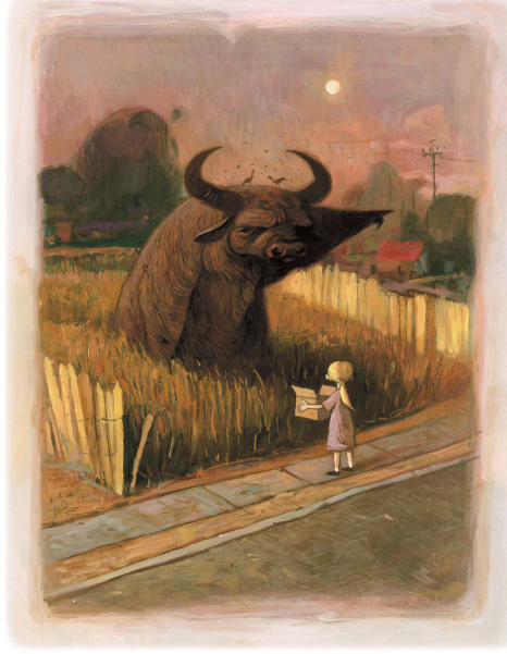
Görsel 11. Shaun Tan, 2006, Su Bufalosu / The Water Buffalo. Taşradan Öyküler. Erişim:07.05.2023. https://www.shauntan.net/new-page-30

“Banliyö’ hem bir ruh halini hem de bir yeri ifade ediyor olabilir: yakın ve tanıdık bir yer ama aynı zamanda bilincin sınırında (ve ‘uzaydan’ farklı değil). Banliyö çoğu zaman dikkatten kaçan sıradan, sıradan, hatta sıkıcı bir yer olarak temsil edilir. Yine de buranın aynı zamanda bilinçaltı hayallerin mekânı olan orta çağ masal ormanlarının yerini alacak güzel bir yer olduğunu düşünüyorum. Sıradan ve sıra dışı arasındaki zıtlık nedeniyle hem kendi çalışmalarım da hem de diğer yazar ve sanatçıların çalışmalarında banliyö ‘fantezi’ fikrini her zaman çok çekici bulmuşumdur; bunun etkisi eğlenceli veya rahatsız edici olabilir ve potansiyel olarak düşündürücü” (Tan, Taşradan Öyküler. Erişim:07.05.2023. https://www.shauntan.net/new-page-30 ).