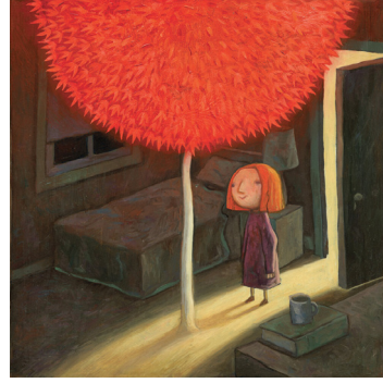
Görsel 4. Shaun Tan, 2000, Otoportre / Self portrait. Kırmızı Ağaç. Erişim: 20.04.2023.