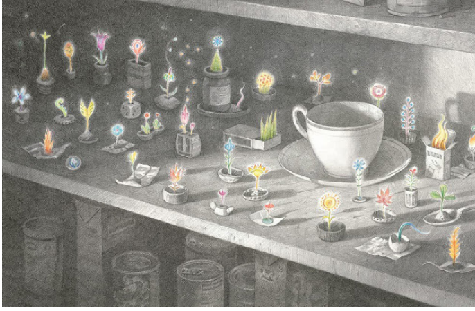
Görsel 12. Shaun Tan, 2006, Eric, Bu harika zaman için teşekkür ederim / Thank you for a wonderful time. Taşradan Öyküler. Erişim: 07.05.2023. https://www.theguardian.com/books/gallery/2009/may/13/shaun-tan-eric-story-pictures#img-12

Pek çok romanında olduğu gibi bu romanın da en etkileyici özelliklerinden biri, Tan'ın sıradan nesnelere ve olaylar üzerinden önemli varoluşçu konuları ele almasıdır. Örneğin, "Panikte Değil Tetikte" öyküsü, günlük hayatta karşılaşılan sıradan bir olayı sıra dışı şekilde ele alarak, nasıl davranılması gerektiği konusunda düşündürür. En etkileyici öykülerinden biri olan Eric'te ise yalnızlık ve yabancılaşma temalarını, yalnız ve tuhaf görünen bir çocuğun kendi fantastik evrenini yaratması üzerinden ele alarak şiirsel bir dille anlatır. Eric, çevresindeki insanlarla iletişim kurmakta zorlanan ve kendini yalnız hisseden bir çocuktur. Yarattığı fantastik dünya, onun gerçek dünyadan kaçmasına ve kendini başka bir yerde daha iyi hissetmesine olanak tanır (Görsel 12). Eric, okuyucuya fantastik bir dünyaya kaçmanın cazibesini ve gerçek dünyayla yüzleşmenin zorluğunu hatırlatmaktadır.