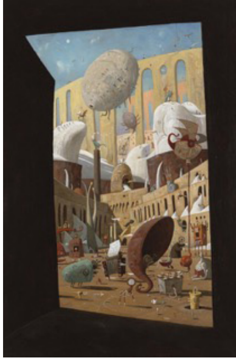
Görsel 9. Shaun Tan, 1999, Ütopya/ Utopia Erişim: 04.10.2023. Kayıp Şey. https://www.nla.gov.au/stories/blog/lost-thing