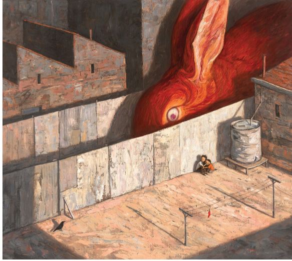
Görsel 10. Shaun Tan, 2012, Çamaşır ipinde asla bir kırmızı çorap bırakma / Never leave a red sock on the clothesline. Asla Neden Diye Sorma. Erişim: 07.05.2023. https://www.shauntan.net/summer-book

Kitap, okuyuculara farklı düş dünyalarının kapılarını açar, farklı kuralların ve mesajların olduğu varoluşçu bir maceraya davet eder.