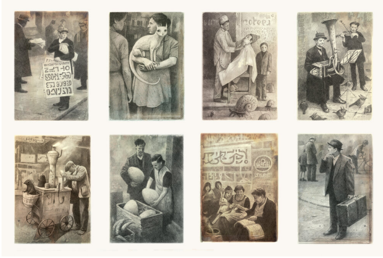
Görsel 3. Shaun Tan, 2004, Sokak Yaşamı / Street Life. Uzak. Erişim: 19.04.2023. https://www.shauntan.net/arrival-book