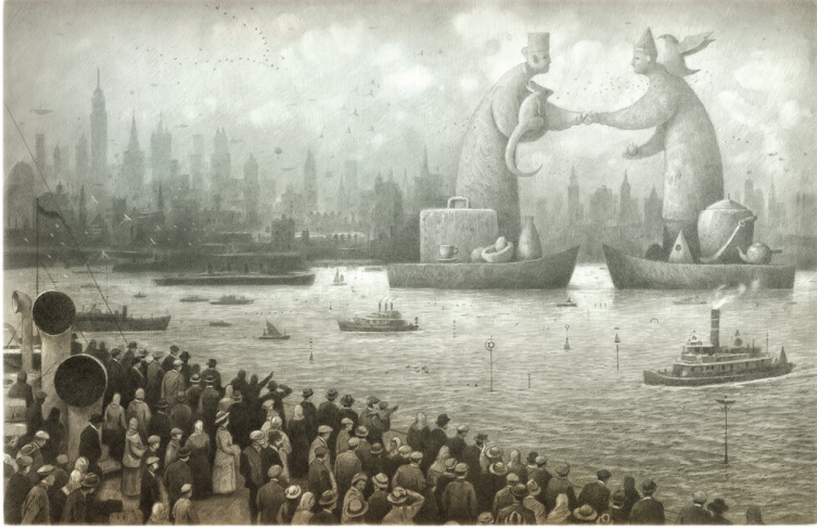
Görsel 2. Shaun Tan, 2004, Yeni Ülke / The New Country. Uzak. Erişim: 19.04.2023. https://www.shauntan.net/arrival-book

Romanın en çarpıcı özelliği, Tan'ın her sayfada güçlü bir görsel anlatım dili kullanmasıdır. Resimler romanda anlatılan metinsiz hikâyeyi tamamlar ve okuyucunun hikâyenin derinliklerine dahil olmasını sağlar. Romanın ana teması olan yabancılaşma kapsamında ele alınan bölümler, Tan tarafından ustalıkla görselleştirilirken, insanlar ve coğrafyalar arasındaki mesafeyi vurgulayan görsel imgeler, izleyicinin kendini hikâyenin içinde hissetmesini sağlayan içten ve güçlü bir desen diliyle desteklenir.