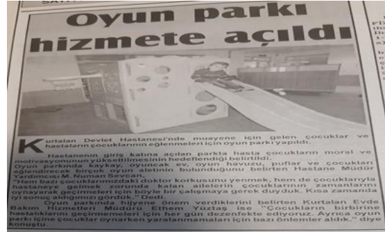
Görüntü 4: 27 Mayıs 2014, s. 4.