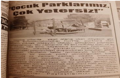
Görüntü 3: 29 Haziran 2013, s. 1.