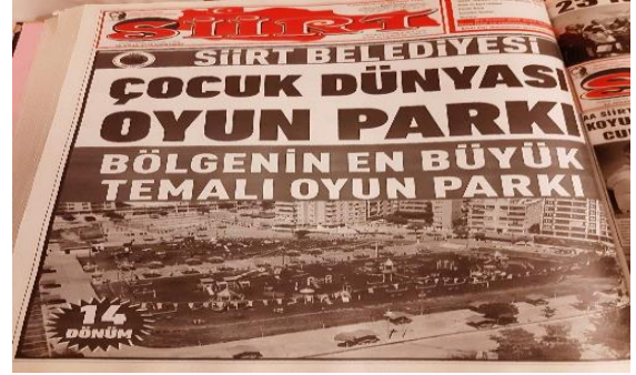
Görüntü 6: 25 Nisan 2018, s. 8