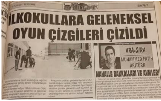
Görüntü 5: 19 Ocak 2017, s. 7