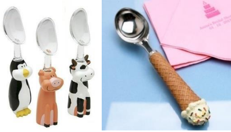
Şekil 1. Sevimli Dondurma Kaşıkları

Nenkov ve Scott(2014, s. 332) tarafından tüketiciler üzerinde yapılan araştırmalarda sevimliliğin ürün tasarımlarına ve tüketici tercihlerine etkisi analiz edilmiştir. Örneğin, araştırmada tüketicilerin dayanıksız olduğunu bildikleri halde sevimli tasarımlı dondurma kaşığına normal tasarımlı kaşığa tercih ettikleri görülmüştür.