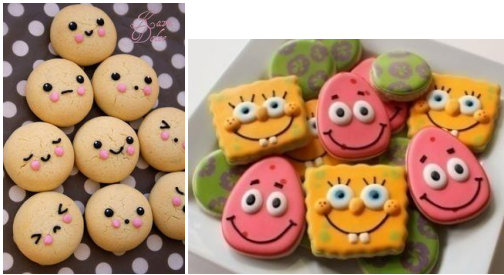
Şekil 2. Sevimli Bisküviler

Çalışmanın devamında tüketicilerin sevimli tasarımlı ve normal tasarımlı zımbalardan timsah şeklinde sevimli tasarımlı olanı seçtikleri görülmüştür. Benzer şekilde aynı özellikli bisküvilerden ayıcık desenli olan tüketiciler tarafından daha çok tercih edilmiştir.