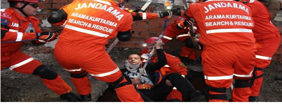
Şekil 5: Afete Müdahale Örneği