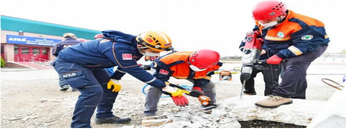
Şekil 4: Afet Hazırlık Tatbikat görüntüsü