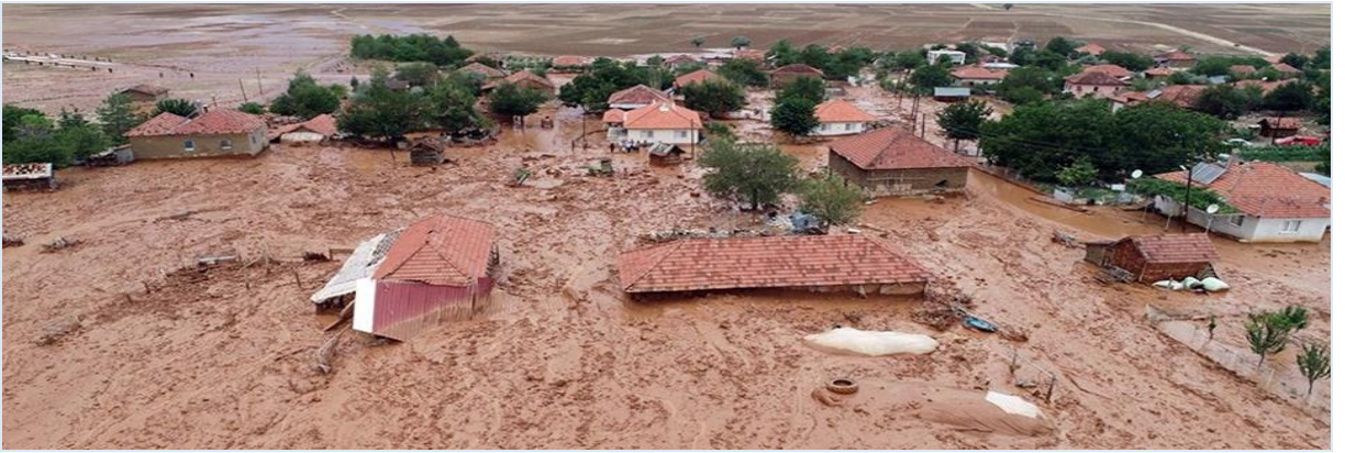
Şekil 1: Su Baskını Görüntüsü

“Akdağ, (2002)’e göre; Doğal Afet, ülkelerin hem fiziki kayıpları ve hem de ekonomik yönden büyük hasar ve kayıpların gerçekleştiği yaşamı ve insan hareketlerini durdurarak, hayatın akışını negatif şekilde etkisi altına alan doğal, teknolojik veya insan kaynaklı çıkarılan olayların tümüdür.” Can ve mal kaybına yol açabilecek, genel hayatı etkileyen, kaynakların yetersiz kaldığı, sistemlerin işlemediği olaylara afet denir. Afetler doğa veya insan kaynaklı olarak oluşur. “Güvel, (2001)’e göre; Red Cross ve Red Crescent Societies’in hazırladığı World Disaster Report’a göre afet, ondan fazla insanın ölümüne ve yüzdenden fazla insanın etkilenmesine ya da yardım için devletlerin ilgili kuruluşlarına talepte bulunmasına neden olan olaylar olarak tanımlanmaktadır.”