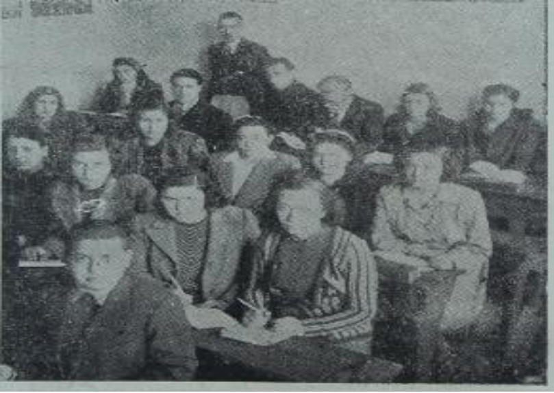
İzmir Halkevi Kurslar Şubesinin Faaliyeti, Fikirler, 30 Nisan 1944, s.24.