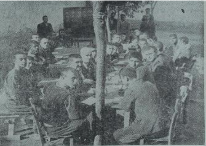
Cezaevinde Açılan Bir Kurs, Fikirler, 30 Nisan 1944, s.24.