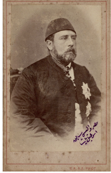
Görsel 1: Mısır Valisi sabık İsmail Paşa.