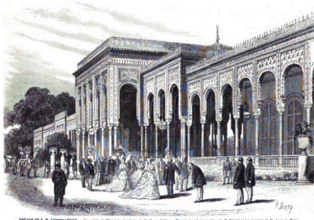
YOTAGE DE S. M. L'IMPERATRICE. — Le palais de Ghézire, résidence de S. M. au Caire. — D'après les photographes de M. Gibert et les croquis de M. Auguste Marc.

Auguste Marc'in çizimlerine göre İmparatoriçe Eugénie'nin Kahire'deki Süveyş Kanalı'nın açılışı için inşa edilmiş olan ikametgâhı Cezire Sarayı (L'illustration, 1869, 312).