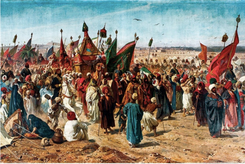
Görsel 6: Stefano Ussi, Surre Alayı, 1873, tuval üzerine yağlıboya, 270.5 x 498.5 cm. İstanbul Dolmabahçe Sarayı, Env.No.11/246 (Kaya ve Kılınç, 2019, 85).

(Görsel 6.) Bir yandan bu sanat alışverişi sürerken diğer yandan kentte bulunan sanatçıların yaşam koşullarıyla İsmail Paşa bizzat ilgileniyordu. Kentte bir saray, şehirde rahatça konaklayabilmeleri için Avrupalı sanatçılara tahsis edildi. 62 Hıdiv, 1868 yılında ressam Frederic Leighton'a (1830- 1896) Nil kıyılarını rahatça gezebilmesi için kendi buharlı gemisini tahsis edecek kadar sanatçılara karşı cömertti. 63 Kahire'ye gelen ressamlar tavsiye mektupları ile saraya başvurarak şehirde çalışmalarını sağlayacak izinlerini alıyor ve saray tarafından destekleniyordu. 64 Bu durum Kahire'nin sokaklarında gün geçtikçe Batılı sanatçıların sayılarının artmasını sağladı. İngiliz ressam George Price Boyce (1826-1897), 1861 kışında Mısır'a giderek yaklaşık bir yıl çalışmalarına bu coğrafyada devam etti. 65 Felix Auguste Clement (1826-1888), Mehmed Abdülhalim Paşa tarafından Şubra sarayının dekorasyonu için görevlendirildi ve yaklaşık dört yılını Kahire'de geçirdi. 66 İstanbul Yeniköy'de yüzyılın son çeyreğinde inşa edilen Said Halim Paşa yalısında, 1865 yılında Kahire'de yapıлып sonradan yalıya getirilen Clement'in Çölde Av Sahnesi temalı tablosu yer alır. 67 Clement'in İsmail Paşa ile doğrudan ilişkisi saptanamasa da tablonun yapılış tarihi İsmail Paşa'nın Mısır yönetiminde olduğu döneme rastlamaktadır.