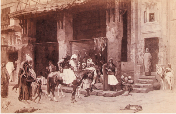
Görsel 5: Gérôme'un eserlerinden oluşan albüm, Dolmabahçe Sarayı Halife Abdülmecid Efendi Kütüphanesi, Env. No. K.Y.F.16 (Kaya ve Kılınç, 2019, 80).

İsmail Paşa'nın Batı sanatına olan merakı ülkede bulunan ressamlarla yakın ilişkiler geliştirmesini de sağladı. Oryantalist resmin tanınmış isimlerinden Jean Léon Gérôme (1824-1904) 1868 yılında Kahire'de çalışmalarını sürdürdüğü esnada desen ve çizimlerine Paşa'nın ilgisinden haber olmalıydı ki, Paris'e döndükten sonra Kahire'yi konu edinen eserlerinin fotoğraflarından oluşan bir albümü İsmail Paşa'ya gönderdi. 61 (Görsel 5.)