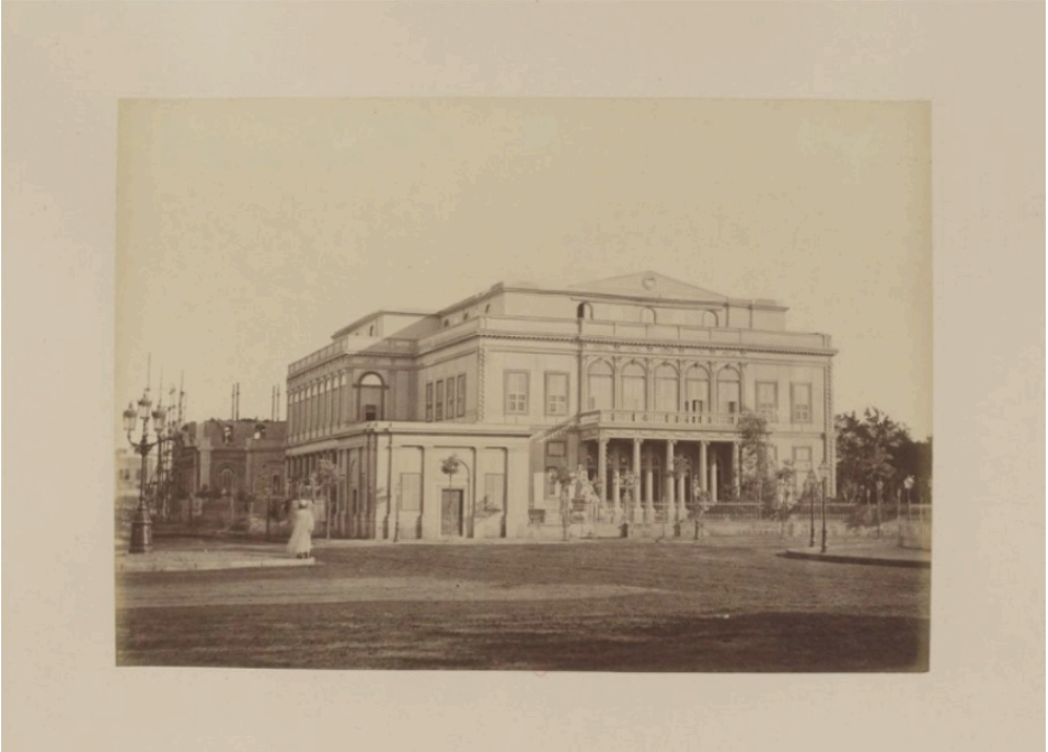
Görsel 3: Opera Binası, Özbekiye, 1874, foto: Emile Béchard (Béchard, 1874).