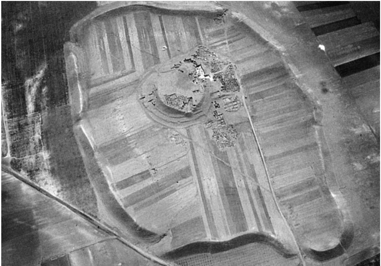
Ebla kentinin kurulduğu Tell Mardikh'in havadan görünümü (Liverani, 2014: s. 120).