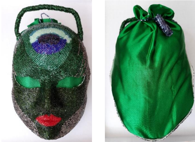
Şekil 8. Maske Çantanın Bitmiş Son Hali Figure 8. The finished final version of the Mask Bag

Tasarım sürecinin son aşaması tasarımın ürün haline dönüştürülmesi olarak ifade edilebilir. Hedeflenen görünüm ve özellikler doğrultusunda ortaya çıkarılan ürün, işlevselliği dışında dekoratif amaçlı kullanım için de uygunluk sağlamaktadır.