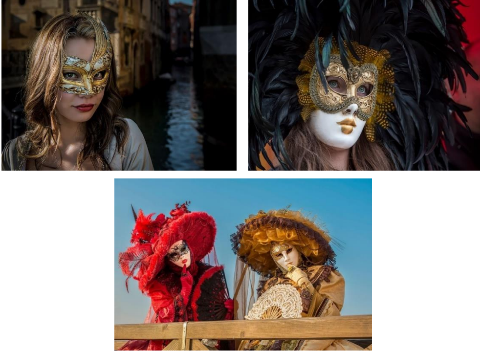
Şekil 1. Venedik Karnavalında Kullanılan Maskeler Figure 1. Masks Used in Venice Carnival

Venedik Karnaval maskelerinin en bilineni “Batua” olarak adlandırılan düz beyaz görünüme sahip maskedir (Şekil 2.). Tüm yüzü kapatan, çıkık burun ve çeneye sahip, ağız kısmı bulunmayan bu maskede ön plana çıkan özellik anonimlik sağlamasıdır.