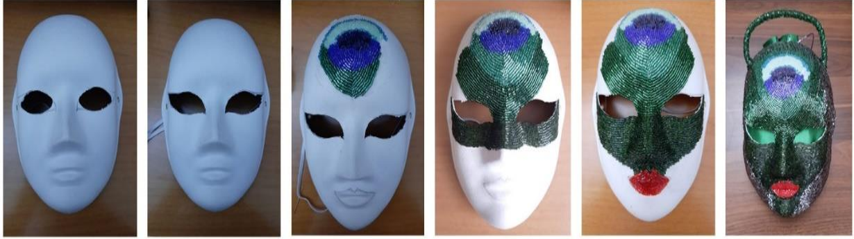
Şekil 7. Maske Çanta Yapım Aşamaları Figure 7. Mask Bag Making Stages

Çantanın sap kısmı için misina ipi ile yeşil renkteki kum boncuklar kordon şeklinde örülerek çanta ile birleştirilmiştir. Çantanın arka tarafına konumlandırılan kese, torba şeklinde dikilerek maskenin iç yüzeyine sabitlenmiştir. Kesenin kapama kısmı için yine kum boncuklar ve misina ipi ile oluşturulan köprü ve kemer ile tasarımın bütünlüğünün sağlanması amaçlanmıştır.