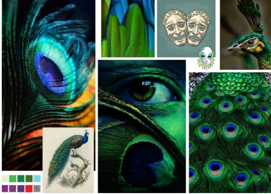
Şekil 3. Çantada Kullanılacak Hikaye ve Renk Panosu Figure 3. Moodboard and Colorboard to be Used in the Bag

Oluşturulması amaçlanan çanta tasarımının temasını aktaran, hikâye ve renk panosu Şekil 3.'de verilmiştir.