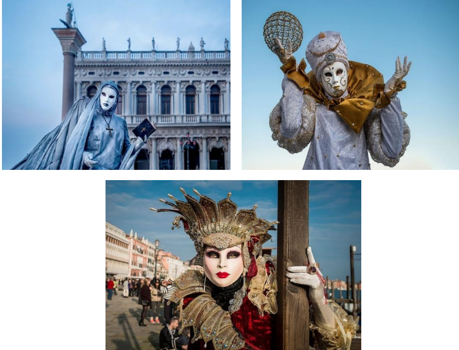
Şekil 2. Venedik Karnaval Maskesi Batua Figure 2. Venetian Carnival Mask Batua

Venedik Karnaval maskelerinin en bilineni “Batua” olarak adlandırılan düz beyaz görünüme sahip maskedir (Şekil 2.). Tüm yüzü kapatan, çıkık burun ve çeneye sahip, ağız kısmı bulunmayan bu maskede ön plana çıkan özellik anonimlik sağlamasıdır.