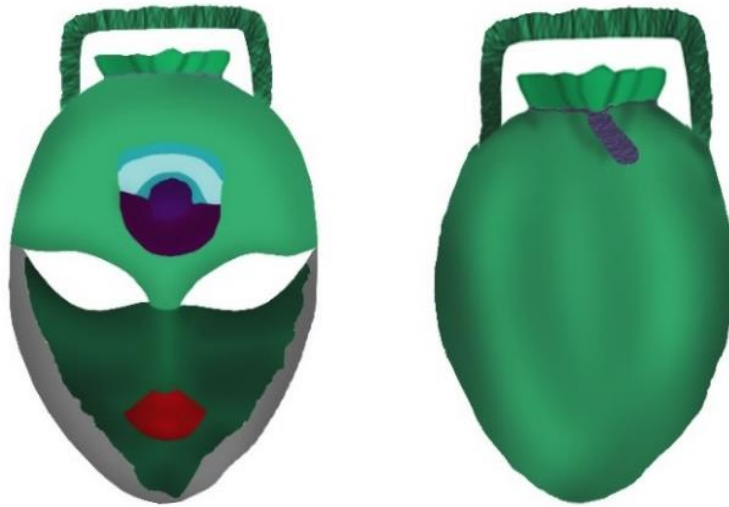
Şekil 5. Maske Çanta Tasarımının Artistik Çizimi Figure 5. Artistic Drawing of Mask Bag Design

Tavus kuşunun kuyruğunda bulunan dairesel formlardan ilham alarak mistik anlamlar barındırması sebebiyle iki gözün arasına konumlandırılacak şekilde desen oluşturulmuştur. Mavi tavus kuşu olarak adlandırılan türün renklerinden esinlenerek seçilen renkler; mor, lila, ton geçişli mor renk, turkuaz, mint yeşili, açık yeşil, koyu yeşil olmak üzere renklendirilmiştir. Desenin dışında kalan kısım için gümüş renk tercih edilmiştir. “Adobe Photoshop CS6” programında çizimi ve renklendirilmesi yapılan artistik çizim ön ve arka görünümü ile aktarılmıştır.