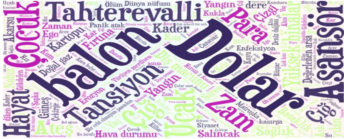
Şekil 1. Enflasyon Kavramına Yönelik Oluşturulan Metaforlara Yönelik Kelime Bulutu

Araştırmanın birinci alt problemini oluşturan “Sosyal bilgiler öğretmen adaylarının enflasyon kavramına ilişkin oluşturdukları metaforlar nelerdir?” sorusuna ilişkin öğretmen adaylarının verdikleri cevapların analizi sonucunda oluşturulan Şekil 1’de kelime bulutu ve Tablo 2’de öğretmen adayları tarafından geliştirilen metaforlar detaylı bir şekilde sunulmaktadır.