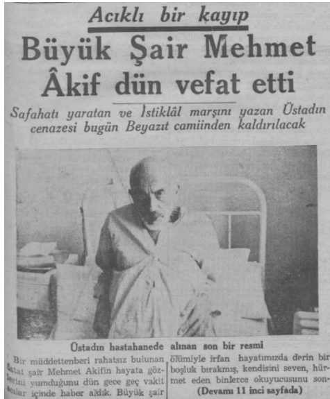
Ek 12: Son Posta Gazetesi (29 Aralık 1936)