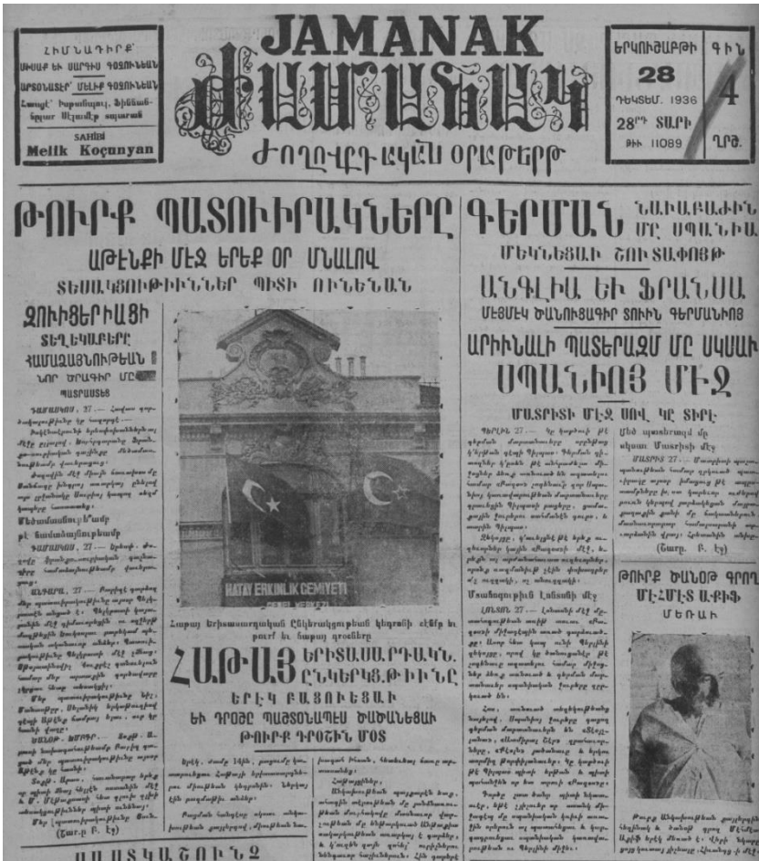
Ek 10: Jamanak (Türkiye Ermenileri Patriklığı Gazetesi), (28 Aralık 1936)