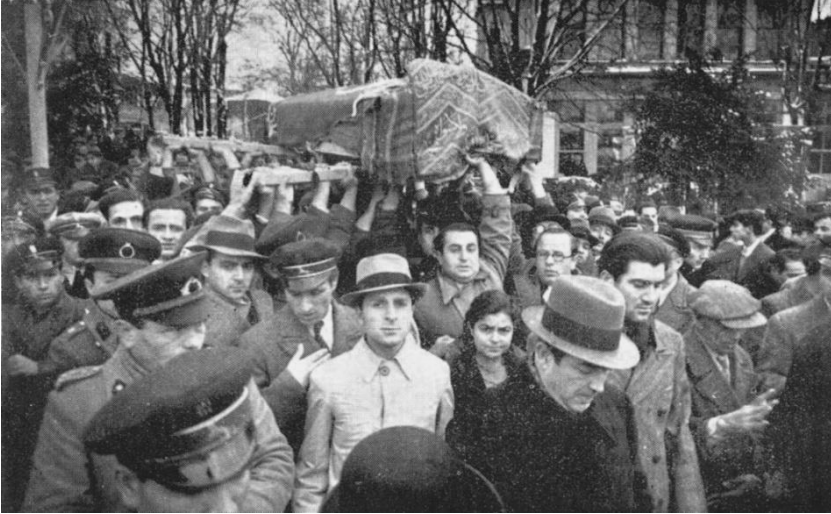
Ek 4: Mehmet Akif Ersoy'un tabutu omuzlarda