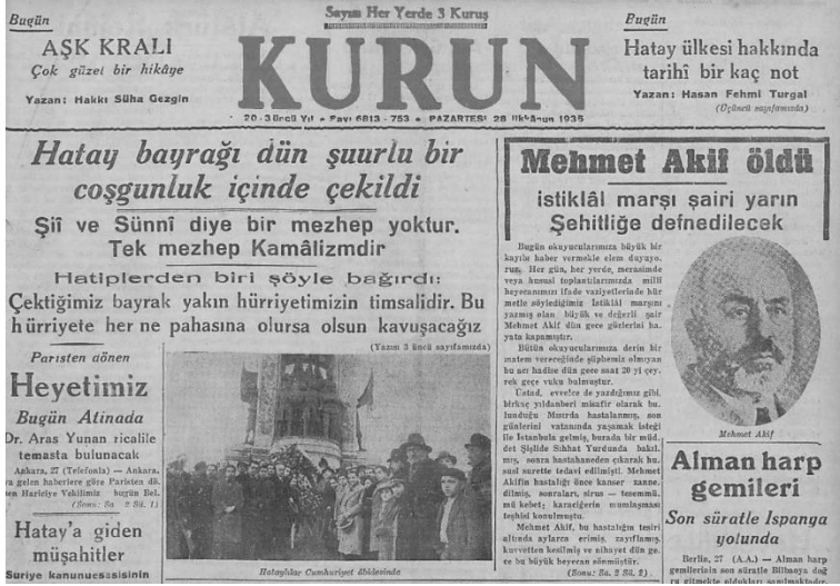
Ek 11: Kurun Gazetesi (28 Aralık 1936)