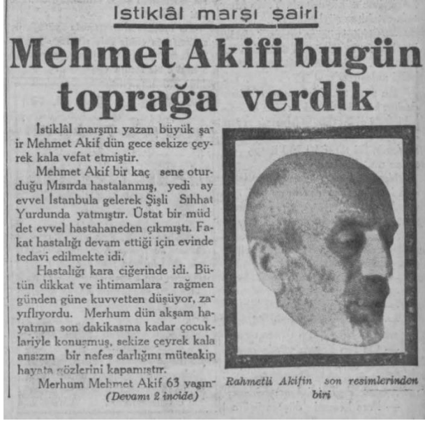
Ek 8: Haber Gazetesi (28 Aralık 1936)