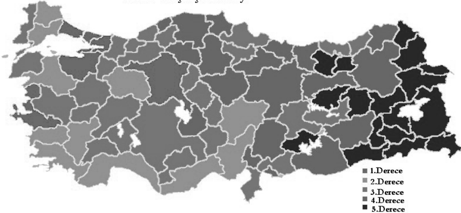
İllerin Gelişmişlik Düzeyi

Şekil 1: İllere göre sosyo-ekonomik gelişmişlik derecesi- Renk koyulaştıkça gelişmişlik derecesi düşmektedir