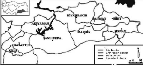
Şekil 3: GAP şehirleri

1989 GAP Master Planı ile başlamış ve 2005'te tamamlanması öngörülmüştür. Tarım, sanayi, eğitim, sağlık, turizm, ulaşım ve kamu altyapısında çok sektörlü bir dönüşüm programı hâlini alan GAP yavaşlansa da hâlâ devam etmektedir (Benek 2009; Fazlıoğlu&Biçer 2009) .