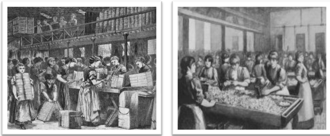
Resim 1: Kibrit Fabrikasında Çalışan Kadınlar