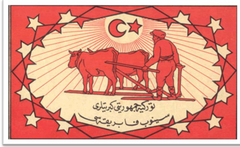
Resim 3: Sinop Kibrit Fabrikasının Reklam Broşürü 28

şirkette Türk Hükümetini dava etmiştir 26 .Daha sonraki yıllarda ise inhisar Amerikan şirketine verilmiştir 27 .