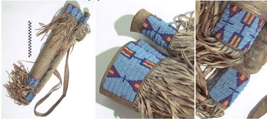
Görsel 8. Hunkpapa Lakota kabilesine ait ok ve yay çantası ("Hunkpapa Lakota Bowcase and Quiver", 2023)

Kızılderili kültüründe çeşitli teknikler ile özellikle boncuklarla, püsküllerle, hayvan uzuvlarıyla süslenen ok ve yay çantalarına olduğu gibi; desensiz, sadece deri kullanılarak oluşturulmuş ok ve yay çantaları da bulunmaktadır.