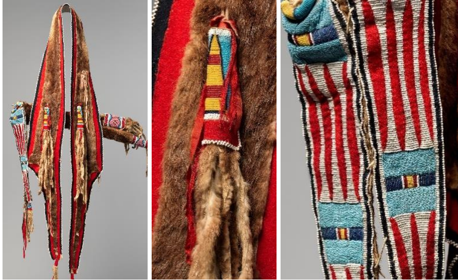
Görsel 2. Nez Perse kabilesine ait olduğu düşünülen ok ve yay çantası örneği (Perce, 1999)

Bu ok ve yay çantası, Apsaalooke ve Nimi İpuu kabileleri ile ilişkilendirilmektedir. Daha önce Nimi İpuu kabilesinin bu çantayı kullandığı ve ticari ilişkiler karşılığında Apsaalooke kabilesi ile takas edildiği düşünülmektedir. Su samuru kürkü ve derisinin kullanıldığı çantada, yün parçaları, ipek kurdeleler ve kumaş kullanıldığı, geometrik desenlerler, mavi, yeşil, kırmızı, pembe ve sarı renkli boncuk işlemleri ile gözükmetedir (Eroğlu, 2015b).