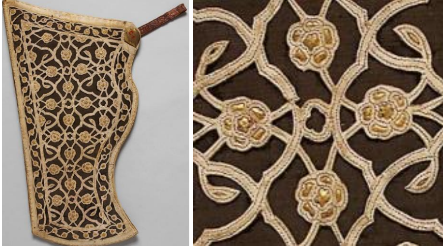
Görsel 14. 15. Yüzyıla ait ok kılıfı örneği ve işleme detayı ("Ok Kılıfı", t.y.)

Müze envanter kayıtlarında koyun ve keçi derisi kullanılarak yapıldığı yazılı olan bu ok kılıfı 1550 yılına tarihlendirilmiştir. Siyah renkli ipek kadife kumaş üzerine, desenlere göre kesilmiş deri parçalarının ipek iplikler ile dikildiği, helezon ve dalların oluşturduğu kompozisyonun birleşim yerlerine çiçek motiflerinin, altın varaklar ile işlendiği görülmektedir ("Ok Kılıfı", t.y.).