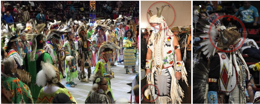
Görsel 12. Powwow festivali ve ok ve yay çantaları haricinde hayvan uzuvlarının kıyafet ve aksesuarlarda kullanımı, Albuquerque (Eroğlu, 2015d)

Şubat 2015 yılında Albuquerque şehrinde; Kızılderili kültüründe yaygın olan, onlar için mistik ve mitolojik önem taşıyan, "powwow" denilen dans ritüellerine katılmıştır. Powwow festivallerine Amerika kıtasının birçok farklı noktalarından; Kanada, Peru, Arjantin gibi diğer kıta ülkelerindeki yerliler de katılmaktadır. Festivalde karşılaşılan birçok kıyafet, aksesuar ve benzeri kullanım eşyalarında, ok ve yay çantalarında hayvan uzuvlarının kullanıldığı gözlemlenmiştir. Kürklü olan bu çanta örneklerinde süsleme unsuru olarak; hayvan tüylerinin ve uzuvlarının kullanıldığı görülmektedir (Bkz. Görsel 12) (Eroğlu, 2015b).