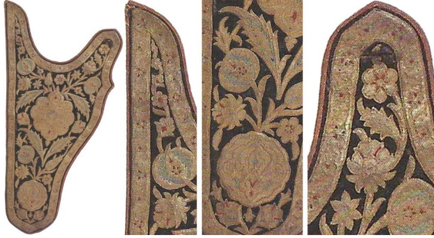
Görsel 18. 16. Yüzyıla ait Osmanlı sadak (ok ve yay çantası) örneği, T.S.M. 1/1302 (Aydın, 2020, s. 96)

16. Yüzyılın ikinci yarısına ait, 64x36 cm boyutlarında, siyah kadife kumaş üzerine motif bezemeleri olan bu yay çantasının dar bölümünde küçük, geniş bölümünde büyük olmak üzere iki adet madalyon bulunmaktadır. Madalyonlar arasında lale, gonca, nergis, nar ve iri yapraklardan oluşan zengin bir kompozisyon görülmektedir. İç bölümdeki kompozisyonun etrafında, stilize çiçekler ve yapraklardan oluşan bir kompozisyonun olduğu ince bir bordür görülmektedir. Arka kısmı kadife kumaş, iç kısmı ise deri ile kaplı olan çantanın işlemlerinde gümüş iplikler kullanılmıştır (Aydın, 2020, s. 96).