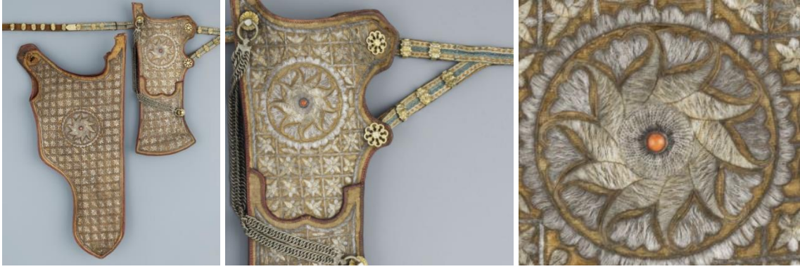
Görsel 16. 18. Yüzyıla ait ok ve yay çantası örneği, bağlantı ve motif detayı (“Osmanlı Sadak ve Ok Kılıfı”, t.y.)

1780 yılına ait olduğu düşünülen, 64,5x33 cm ölçülerinde, 593 gr. ağırlığında olduğu bilinen ok ve yay çantası örneği deri malzemeden yapılmış olup, yüzeyi yeşil renkte ipek kadife ile kaplanarak, ızgara şeklinde karelerin içlerine çiçek motifleri işlenmiştir. İşlemelerin altın ve gümüş teller ile yapıldığı, kompozisyon ortasında madalyon biçiminde, merkezinde kırmızı mercan boncuk bulunan, çarkıfelek şeklini anımsatan penç motifi kullanıldığı görülmektedir. Metal aksamlarını ve çantanın saplarını birleştirmek için metal işlemeli perçemler kullanılmıştır (“Osmanlı Sadak ve Ok Kılıfı”, t.y.).