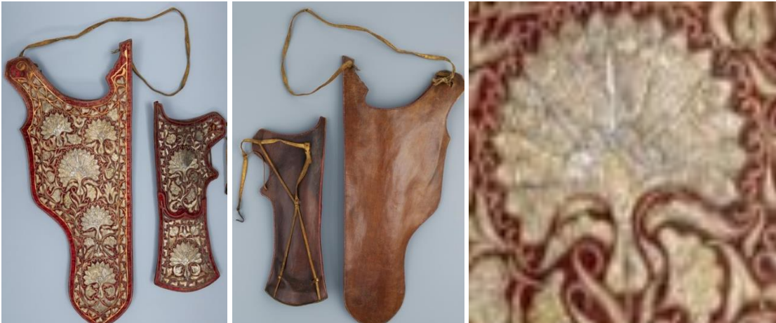
Görsel 15. 17. Yüzyıl'a ait Osmanlı ok kılıfı örneği, ön ve arka görünüm, işleme detayı ("Osmanlı Ok Kılıfı", t.y.)

Müze envanter kayıtlarında koyun ve keçi derisi kullanılarak yapıldığı yazılı olan bu ok kılıfı 1550 yılına tarihlendirilmiştir. Siyah renkli ipek kadife kumaş üzerine, desenlere göre kesilmiş deri parçalarının ipek iplikler ile dikildiği, helezon ve dalların oluşturduğu kompozisyonun birleşim yerlerine çiçek motiflerinin, altın varaklar ile işlendiği görülmektedir ("Ok Kılıfı", t.y.).