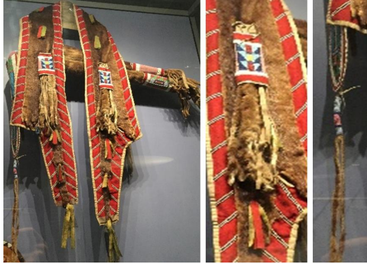
Görsel 1. Apsaalooke ve Nimi İpuu kabilelerine ait Kızılderili ok ve yay çantası örneği (Eroğlu, 2015a)

Bu ok ve yay çantası, Apsaalooke ve Nimi İpuu kabileleri ile ilişkilendirilmektedir. Daha önce Nimi İpuu kabilesinin bu çantayı kullandığı ve ticari ilişkiler karşılığında Apsaalooke kabilesi ile takas edildiği düşünülmektedir. Su samuru kürkü ve derisinin kullanıldığı çantada, yün parçaları, ipek kurdeleler ve kumaş kullanıldığı, geometrik desenlerler, mavi, yeşil, kırmızı, pembe ve sarı renkli boncuk işlemleri ile gözükmetedir (Eroğlu, 2015b).