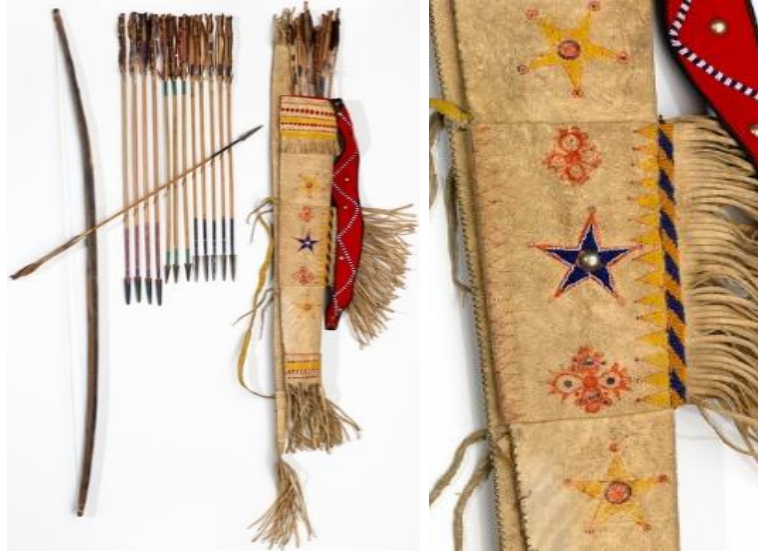
Görsel 6. Chiricahua Apaçi kabilesine ait ok ve yay çantası ("Chiricahua Apache Bowcase", 2023)

Apsaalooke kabilesine ait, 160,5 x 34,29 x 15,25 cm ölçülerindeki bu ok ve yay çantası, 1885 yılına tarihlendirilmiştir. Su samuru derisinden yapılan ok ve yay çantasının yapımında pamuk, yün, metal ve ahşap kullanılmıştır. Çantaların süsleme kompozisyonunda geometrik desenler tercih edilmiş ve bu desenler boncuk işleme sanatı ile yapılmıştır. 1830'lu yıllarda Apsaalooke kabilesi ile temasta bulunan araştırmacılar tarafından, ok ve yay çantalarına sadece iyi giyinen erkeklerin sahip olduklarından bahsedilmektedir. Kabile içerisinde yüksek mevkideki erkeklerin kullandığı kakan, tüylü başlık, ok ve yay çantalarının yapımında, su samuru derisinin kullanımı ve boncuk işlemeli panellerin bulunması; erkeğin statüsünü, onurunu temsil etmektedir ("Bow Case and Quiver", 2023).