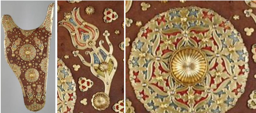
Görsel 17. 17. Yüzyıla ait sadak (ok ve yay çantası) örneği ve detayları (“17. Yüzyıl Sadak Örneği”, t.y.)

1780 yılına ait olduğu düşünülen, 64,5x33 cm ölçülerinde, 593 gr. ağırlığında olduğu bilinen ok ve yay çantası örneği deri malzemeden yapılmış olup, yüzeyi yeşil renkte ipek kadife ile kaplanarak, ızgara şeklinde karelerin içlerine çiçek motifleri işlenmiştir. İşlemelerin altın ve gümüş teller ile yapıldığı, kompozisyon ortasında madalyon biçiminde, merkezinde kırmızı mercan boncuk bulunan, çarkıfelek şeklini anımsatan penç motifi kullanıldığı görülmektedir. Metal aksamlarını ve çantanın saplarını birleştirmek için metal işlemeli perçemler kullanılmıştır (“Osmanlı Sadak ve Ok Kılıfı”, t.y.).