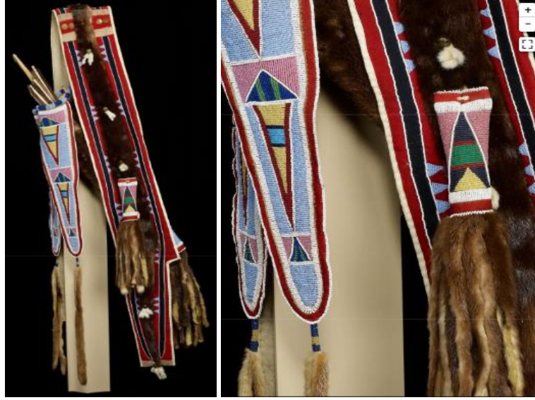
Görsel 5. Apsaalooke Kızılderililerine ait ok ve yay çantası ("Bow Case and Quiver", 2023)

Apsaalooke kabilesine ait, 160,5 x 34,29 x 15,25 cm ölçülerindeki bu ok ve yay çantası, 1885 yılına tarihlendirilmiştir. Su samuru derisinden yapılan ok ve yay çantasının yapımında pamuk, yün, metal ve ahşap kullanılmıştır. Çantaların süsleme kompozisyonunda geometrik desenler tercih edilmiş ve bu desenler boncuk işleme sanatı ile yapılmıştır. 1830'lu yıllarda Apsaalooke kabilesi ile temasta bulunan araştırmacılar tarafından, ok ve yay çantalarına sadece iyi giyinen erkeklerin sahip olduklarından bahsedilmektedir. Kabile içerisinde yüksek mevkideki erkeklerin kullandığı kakan, tüylü başlık, ok ve yay çantalarının yapımında, su samuru derisinin kullanımı ve boncuk işlemeli panellerin bulunması; erkeğin statüsünü, onurunu temsil etmektedir ("Bow Case and Quiver", 2023).