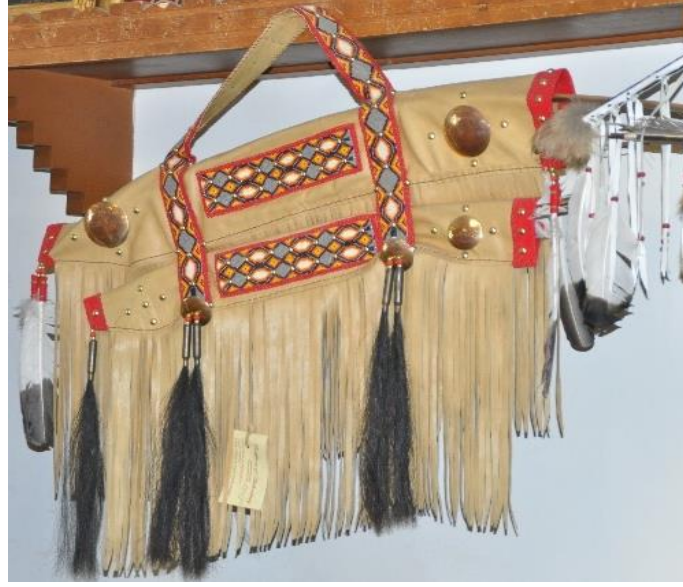
Görsel 9. Yakın tarihli ok ve yay çantası örneği, Navajo rezervasyon alanı (Eroğlu, 2015c)

hayvan siniri ile birleştirilmiş, boncuk işleme ile yapılan motifler ve püsküller süsleme unsuru olarak kullanılmıştır (“Hunkpapa Lakota Bowcase and Quiver”, 2023).