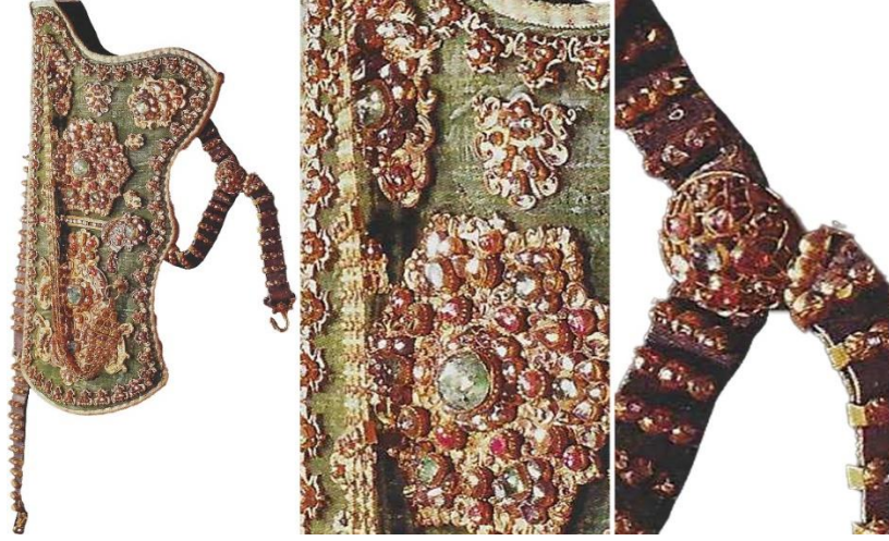
Görsel 20. 16. Yüzyıla ait Osmanlı Ok Çantası Örneği, T.S.M. 2/453 (Aydın, 2020, s. 97)

18. yüzyıla ait, 42x22 cm ebatlarındaki bu ok çantasında; yeşil renkte kadife kumaş üzerine 4 adet büyük altın plaka yerleştirildiği görülmektedir. Altın plakalarda zümrüt, yakut, elmas taşlarının kullanıldığı bu çanta örneğinin orta kısmında bulunan metal ve taş işlemlerinin etrafı da yine aynı şekilde küçük altın plakalar ve yakut taşlarla süslenen bir bordüre sahiptir. Sırta ya da bele bağlamak için yapılan kayış kısımlarında da sıralı biçimde işlenmiş değerli taşlar görülmektedir (Aydın, 2020, s. 97).