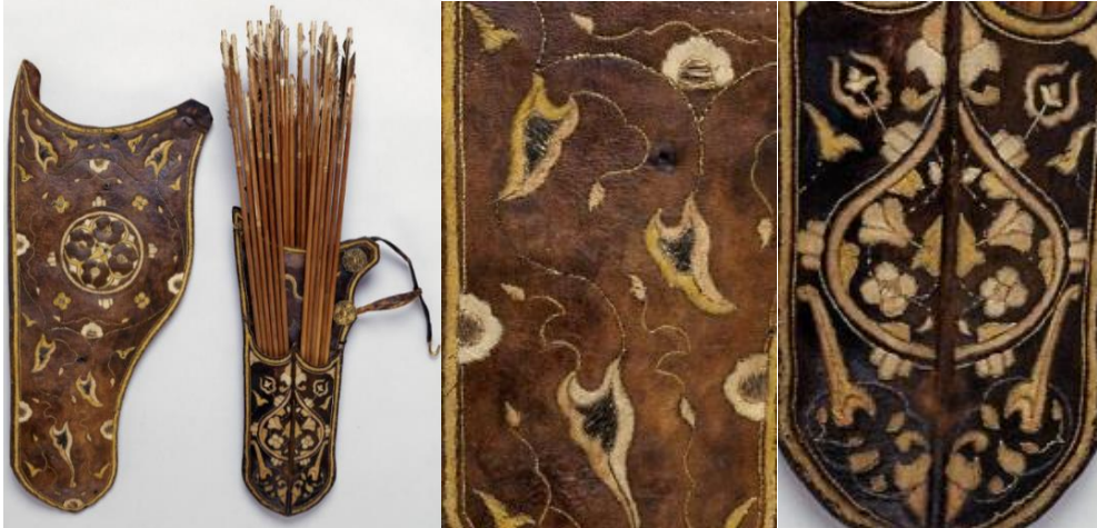
Görsel 13. 15. Yüzyıla ait sadak (ok ve yay çantası) örneği ve işleme detayları (“Sadak, Ok Kılıfı”, t.y.)

1550 yılına tarihlendirilmiş, Türk kültürüne ait olan bu sadak (ok ve yay çantası) örneğinde; ipek kumaş ile kaplanmış deri malzemenin üzerine, yaldızlı ve gümüş iplikler ile bitkisel motiflerin işlendiği görülmektedir. Taşıma kayışlarının ana gövdeye metal işçiliği ile tutturulduğu, iki ayrı parça olan bu bölümlerin birleştirilmesinde telkâri tekniği ile yapılan perçinler kullanıldığı görülmektedir (“Sadak, Ok Kılıfı”, t.y.).