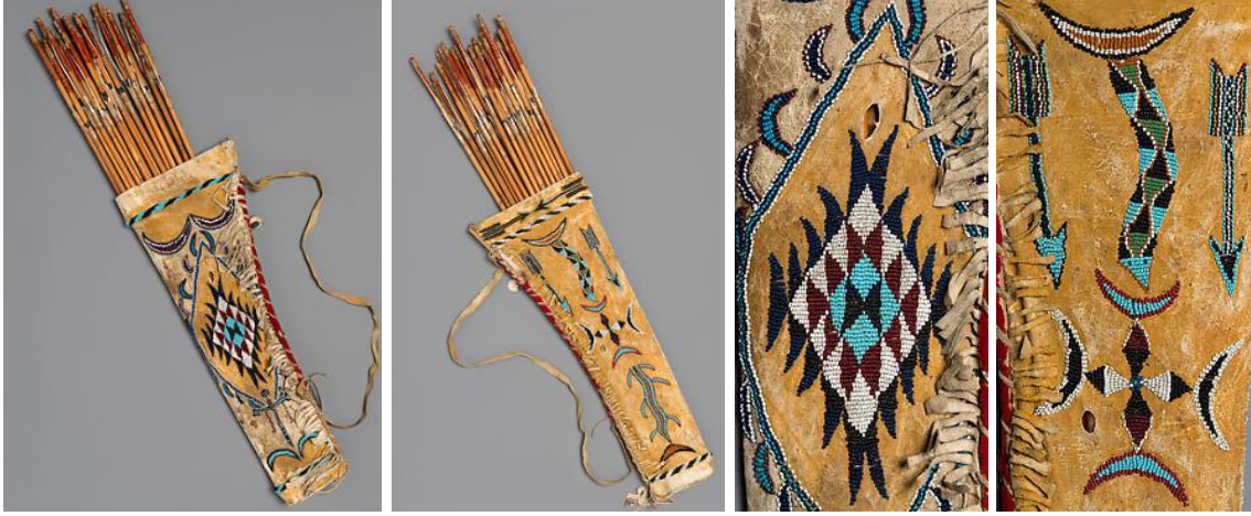
Görsel 3. Kızılderili Apaçi kültürüne ait ok ve yay çantası örneği ("Apache Quiver and Arrows", 2018)

1875 yılına tarihlendirilen Kızılderili ok çantasının Arizona'da yapıldığı düşünülmektedir. Apaçi kültürüne ait çantada, tabaklanmış deri üzerine cam boncuklar ile işlenmiş desenler görülmektedir. Desenler incelendiğinde geometrik motifler ve ok şekli ile kıvrımlı uzantılar ve hilal şekillerinin bulunduğu görülmektedir. Boncuk renkleri olarak mavi, beyaz, kahverengi ve siyah kullanılmıştır. 83,8 cm. boyu olan çantanın eni, 20,3 cm'dir. Süslemesinde ayrıca püskürlere de yer verilmiştir ("Apache Quiver and Arrows", 2018).