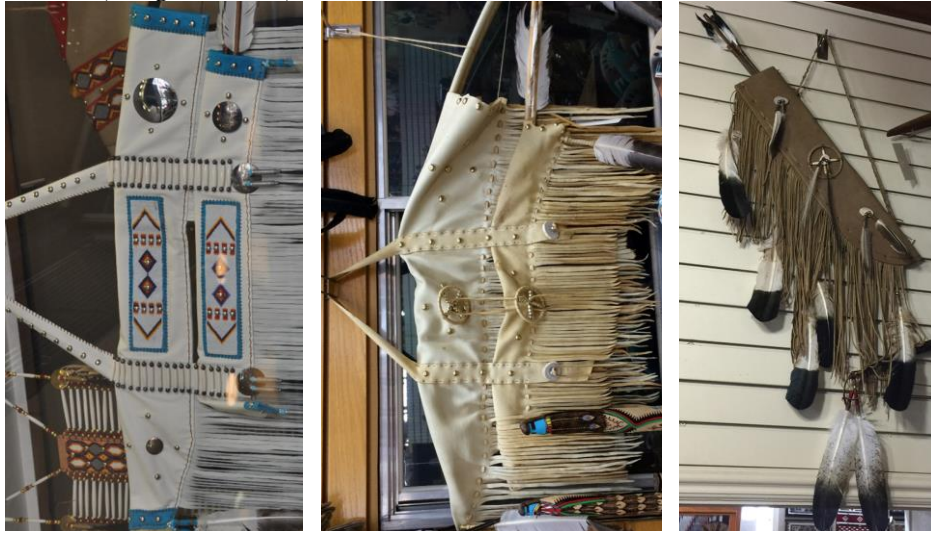
Görsel 10. Yakın dönem ok ve yay çantası örnekleri, Navajo rezervasyon alanı (Eroğlu, 2015c)

Bu ok ve yay çantasının yakın tarihli son dönem örneklerin olup, turistik ve ticari amaçlar için yapılmıştır. Çantanın hammadde özelliklerine bakıldığı zaman; suni deri kullanıldığı ve süsleme unsuru olarak da büyük metal perçinler, ay kuyruğu ve püsküller kullanıldığı görülmektedir. Bu örnek; Navajo rezervasyon sınırları içerisinde yer alan Albuquerque Kızılderili yerleşim alanında, 2015 yılında yapılmış olan alan araştırmasında tespit edilmiştir (Eroğlu, 2015b).