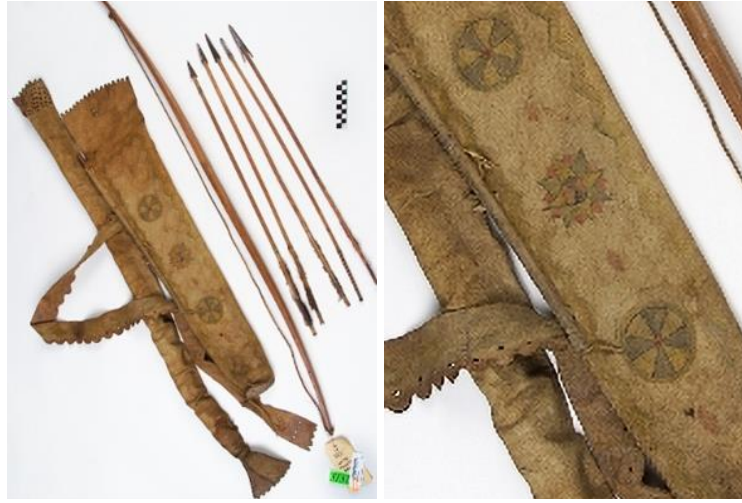
Görsel 4. Kızılderili ok, yay çantası, yay ve oklar ("White Mountain Apache Bowcase", 2023)

1875 yılına tarihlendirilen Kızılderili ok çantasının Arizona'da yapıldığı düşünülmektedir. Apaçi kültürüne ait çantada, tabaklanmış deri üzerine cam boncuklar ile işlenmiş desenler görülmektedir. Desenler incelendiğinde geometrik motifler ve ok şekli ile kıvrımlı uzantılar ve hilal şekillerinin bulunduğu görülmektedir. Boncuk renkleri olarak mavi, beyaz, kahverengi ve siyah kullanılmıştır. 83,8 cm. boyu olan çantanın eni, 20,3 cm'dir. Süslemesinde ayrıca püskürlere de yer verilmiştir ("Apache Quiver and Arrows", 2018).