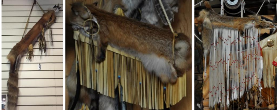
Görsel 11. Hayvan postlu Kızılderili ok ve yay çantaları, Navajo rezervasyon alanı (Eroğlu, 2015c)

Kızılderili kültüründe yaygın olarak görülen ok ve yay çantalarının birçoğunun işlenmiş deriden yapıldığı görülmektedir. Bununla birlikte işlenmemiş ham malzemelerden yapılan çantalara da rastlanmaktadır. 2015 yılında yapılan alan araştırmasında, Navajo rezervasyon alanındaki yerleşim yerlerinden olan Albuquerque, Santa Fe, Gallup, Hubbell, Shiprock ve Ganado'da hayvan postlarının olduğu gibi kullanıldığı ok ve yay çantalarına rastlanmıştır. Bu tarz çanta örneklerinde postların; tabaklanan derinin daha sert olması, daha yumuşak ve daha dekoratif olmaları gibi sebeplerden dolayı tercih edildikleri düşünülmektedir. Postlu ok ve yay çantaları; hayvanların iç organları boşaltılarak, ayaklar ve baş kısmı koparılmadan, direkt olarak gövdenin dikilmesi ile doğal bir şekilde oluşturulmuştur. Kızılderili mitolojisinde ve inanışlarında; avladıkları hayvanların uzuvlarını yanlarında taşımalarının onlara avlanan hayvanın gücünü vereceğine inanılmaktadır. Bu sebepten dolayı geleneksel Kızılderili giysi, aksesuar, ok ve yay çantalarına bakıldığı zaman; hayvan uzuvlarının eksiltmeden doğal haliyle kullanıldıkları görülmektedir (Eroğlu, 2015b).