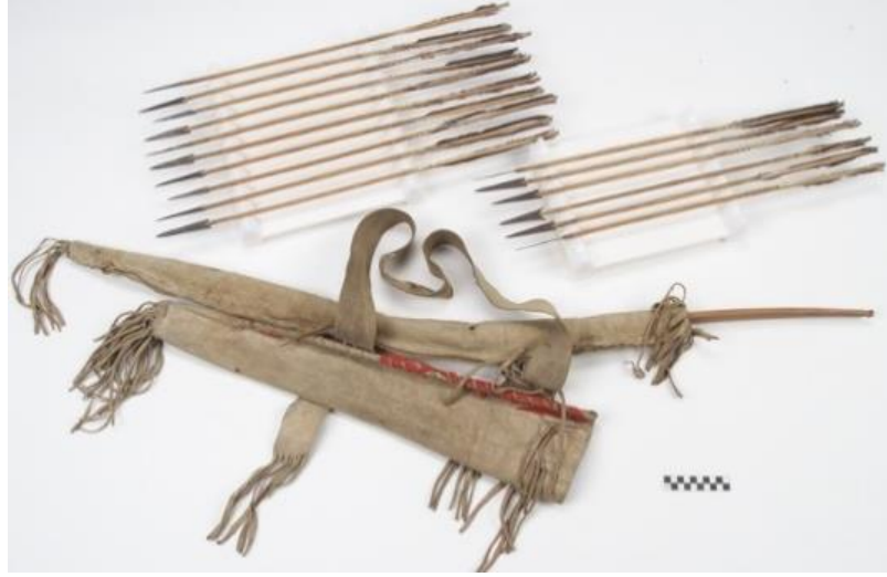
Görsel 7. Nakota (Yankton Sioux) Kızılderili kabilesine ait ok ve yay çantası ("Nakota Bowcase", 2023)

boncuklar, pirinç düğmeler, ahşap, kuş tüyü kullanılmıştır. Aplike ve tembel dikiş tekniği ile birleştirilen bu örnekte; boncuk işi ve boyama tekniğiyle yapılan süslemeler görülmektedir. Çantanın dikiminde ip olarak hayvan siniri kullanılmış, kuş tüyleri oklara, püsküller ise çantalara süsleme unsuru olarak ilave edilmiştir. Desenler oluşturulurken deri üzerine yıldız motifleri boyanmış, yıldızların ortasına metal düğmeler yerleştirilerek, çantanın orta kısmından aşağıya doğru sarkacak şekilde deri püsküller eklenerek çanta tamamlanmıştır ("Chiricahua Apache Bowcase", 2023).