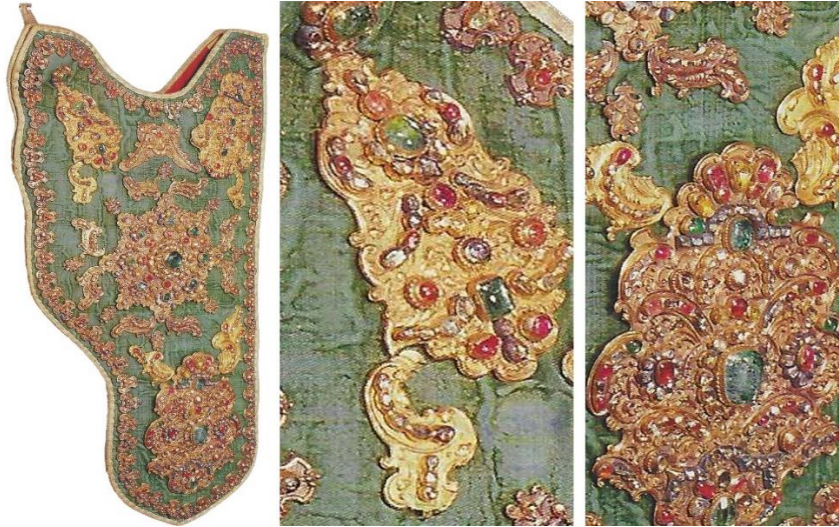
Görsel 21. 16. Yüzyıla ait Osmanlı yay çantası örneği, T.S.M. 2/454 (Aydın, 2020, s. 97)

18. yüzyıla ait, 42x22 cm ebatlarındaki bu ok çantasında; yeşil renkte kadife kumaş üzerine 4 adet büyük altın plaka yerleştirildiği görülmektedir. Altın plakalarda zümrüt, yakut, elmas taşlarının kullanıldığı bu çanta örneğinin orta kısmında bulunan metal ve taş işlemlerinin etrafı da yine aynı şekilde küçük altın plakalar ve yakut taşlarla süslenen bir bordüre sahiptir. Sırta ya da bele bağlamak için yapılan kayış kısımlarında da sıralı biçimde işlenmiş değerli taşlar görülmektedir (Aydın, 2020, s. 97).