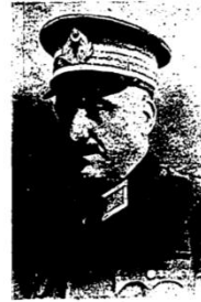
Marshall FEHVI PAŞA

Heute wird ein jeder Zeuge dessen, wie man in den 10 Jahren sich dem vom großen Retter und Führer gewiesenen Ziele genähert und welche große Umwälzungen man erlebt hat. Man freut sich und feiert heute das größte Fest seines Lebens. Überlegt man, welche Fortschritte die Nation in den letzten 10 Jahren gemacht und was für eine Strecke auf dem Wege des Aufbaus und der Erneuerung sie zurückgelegt hat, erst dann begreift man den Unterschied zwischen der türkischen Republik von heute und dem osmanischen Kaiserreich von einst.