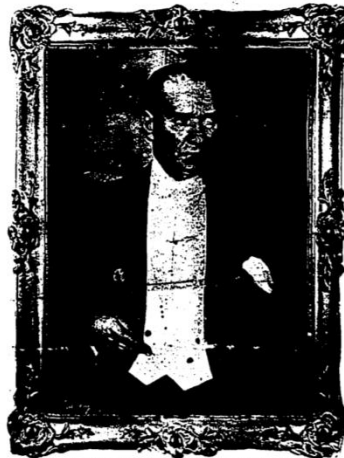
Staatspräsident GASI MUSTAFA KEMAL

Der kranke Mann von gestern ist von allen Basillen befreit und zu neuem Leben auferstanden. Denn der Türke hat endlich zu sich selbst gefunden. Wenn man alle diese Fortschritte und Neuerungen mit Stolz anführt, so wird man vor dem führenden Geiste bei allen diesen Leistungen, dem Staatspräsidenten Gasi M. Kemal, tiefer Dankbarkeit und Hochachtung das Haupt neigen. Wenn wir auf dem Wege der Umwälzung und des Fortschritts