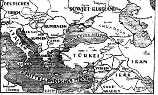
Die Balkan- und die Ostfrage. Die deutsche Politik in der Ostfrage ist durch die Belgrader Konferenz in eine schwierige Lage geraten.

Berlin, 7. Februar. Die deutsche Politik in der Ostfrage ist durch die Belgrader Konferenz in eine schwierige Lage geraten.