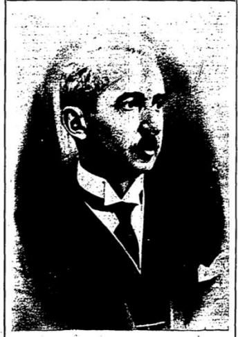
Ministerpräsident İSMET PAŞA

vor irgend einem Hindernis für einen Augenblick zögern und unser Selbstvertrauen verlieren sollten, so brauchen wir nur auf die 10 Jahre unserer Republik zurückzublicken, um festzustellen, was wir zu vollbringen imstande sind. Dann wird unsere Zaghelt verschwinden, das Feuer unseres Ideals neu aufflammen und unserem Vorwärtstreiben wird sich kein Hindernis wirksam entgegenstellen vermögen.