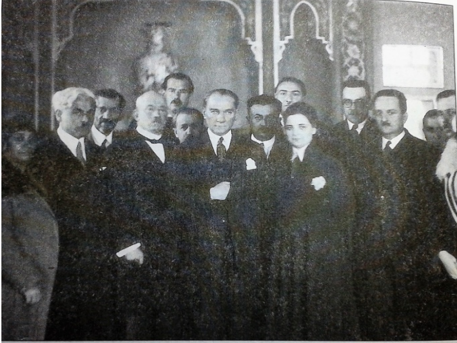
Türk Ocakları'nda, Afet Uzman'ın kadınların seçme ve seçilmesi hakkındaki konferansından sonra.

EK-1: Afet İnan'ın 3 Nisan 1930 yılında gün Türk Ocağı'nda "Seçim Haklarımız" isimli konferansından sonra diğer davetliler ile beraber çekilmiş fotoğrafı. Afet İnan'ın üzerindeki kıyafeti Atatürk tasarlamıştır.