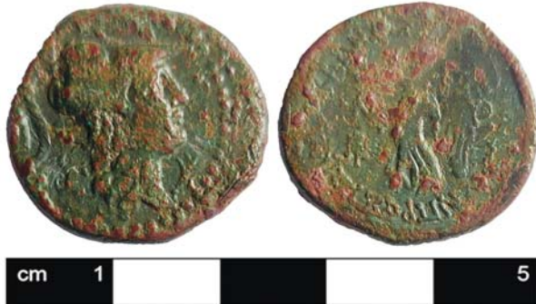
Levha 5: Kazı Alanından Ele Geçen Seleucia Darplı MÖ 1. yüzyıl Sikkesi.