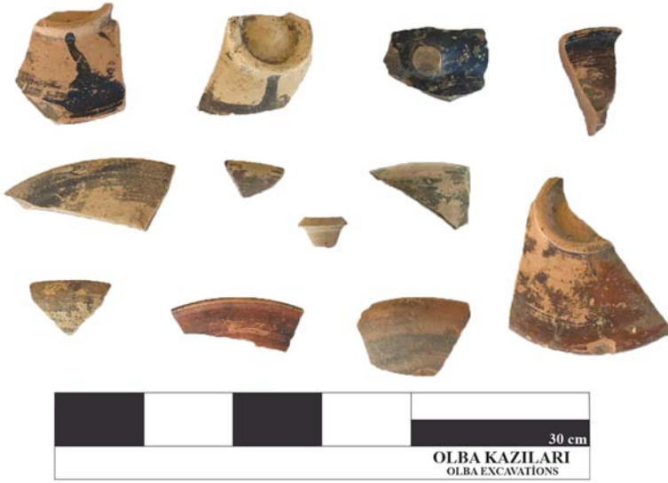
Levha 4: Kazı Alanından Ele Geçen MÖ 3-1. yy arasına tarihlenen Seramikler.