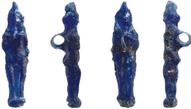
Levha 3: Cam Pendantsın Dört Tarafından Ayrıntılı Görünümü.