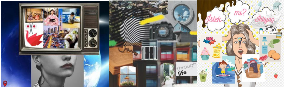
Resim 3. K10, K11 ve K8'in Kolaj Çalışmaları

Kolaj sanat etkinliklerinde ise K4, Resim 1’de görülen ilk iki kolaj çalışmasını “Popüler kültürün, kültürümüz üzerindeki etkilerini sorgular” kazanımına yönelik olarak hazırlamış ve analiz sorularıyla birlikte ders sürecini kurgulamıştır. K9 ise “Arkadaşlarıyla birlikte küresel sorunların çözümüne yönelik fikir önerileri geliştirir” kazanımı ile ilgili olarak kolaj çalışmasını hazırlayıp ders planını yapmıştır.