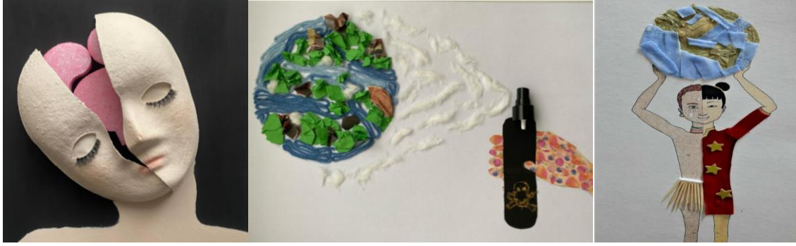
Resim 4. K1, K3 ve K5'in Asamblaj Çalışmaları

Resim 4'te görüldüğü gibi K 1, “Diğer bireylerin farklı özelliklerini saygı ile karşılar” kazanımına yönelik olarak asamblaj çalışmasını ve derste kullanım süreci ile ilgili kurgusunu hazırlamıştır. K3 de “Kaynakların bilinçsizce tüketilmesinin canlı yaşamına etkilerini analiz eder” kazanımıyla ilgili asamblaj ürününü ortaya koymuş ve ders sürecini planlamıştır. K5 ise “Kültürel öğelerin, insanların bir arada yaşamasındaki rolünü analiz eder” kazanımıyla ilgili asamblaj etkinliğini hazırlayarak ders sürecine uyarlamıştır.