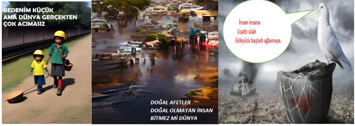
Resim 1. K6, K7 ve K12'nin Haiku Çalışmaları

Yine K 7, “Arkadaşlarıyla birlikte küresel sorunların çözümüne yönelik fikir önerileri geliştirir” kazanımı ile ilgili haiku şiir metnini üretmiş, şiirin yapay zeka ile görselini hazırlamış ve ilgili kazanımın ders planını kurgulamıştır. K 12 de K 7 ile aynı kazanıma yönelik haiku şiirini yazmış, yapay zekâ uygulamasındaki görseliyle birlikte ders sürecini hazırlamıştır.