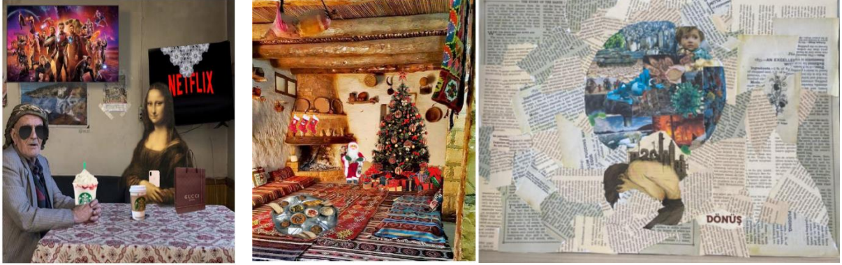
Resim 2. K4 ve K9'un Kolaj Çalışmaları

Yine K 7, “Arkadaşlarıyla birlikte küresel sorunların çözümüne yönelik fikir önerileri geliştirir” kazanımı ile ilgili haiku şiir metnini üretmiş, şiirin yapay zeka ile görselini hazırlamış ve ilgili kazanımın ders planını kurgulamıştır. K 12 de K 7 ile aynı kazanıma yönelik haiku şiirini yazmış, yapay zekâ uygulamasındaki görseliyle birlikte ders sürecini hazırlamıştır.