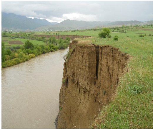
Resim 10: Tkemplana ve Sakuneti Arasında Kür Nehri'nin Sağ Sahilinin Yıkılıp Aşınması