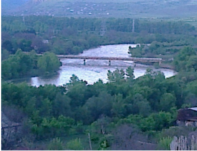
Resim 6: Agara ile Sakuneti Köylerini Birleştiren Köprü

Daha önceler bu iki köyün arasındaki geçit navla 2 sağlanmaktaydı. Sakuneti ile Kvaltakhevi (Koltakhev) köyleri arasında da “Şakir dedenin hayır köprüsü” adlanan bir köprü de bulunmaktaydı (Kişisel Görüşme: Hayrettin Keskin, 1944 Sakuneti Doğumlu).