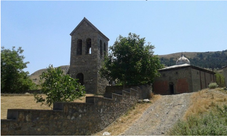
Resim 1. Kilise ve Cami Sakuneti Köyü'nün Ortasında

Sovyetler zamanında cami kültür evi, sinema kulübü, depo olarak kullanılmıştır.