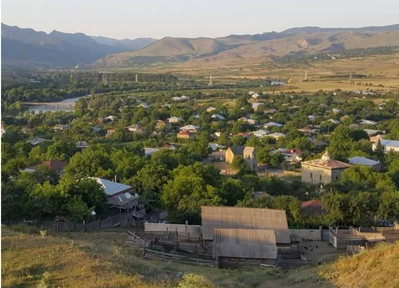
Resim 5. Sakuneti Köyü’nün Görüntüsü

41°41’12” Kuzey 43°07’46” Doğu meridiyenleri arasında yer alan Sakuneti, Samtskhe-Cavakheti Bölgesi Akhaltsikh Belediyesi’nin en güzel köylerinden biridir. Resim 5.