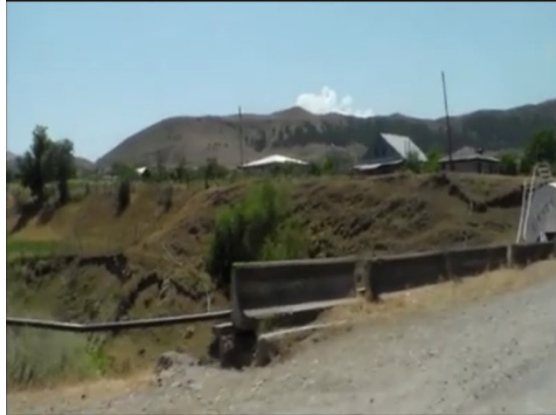
Resim 8: Kür Nehri'nde Toprak Kayması ve Aşınmalar