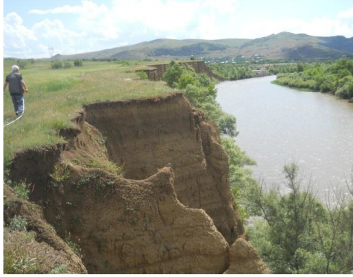
Resim 9: Tkemplana ve Sakuneti Arasında Kür Nehri'nin Sağ Sahilinin Yıkılıp Aşınması

Naokhrebi köyünde Posof çayının sağ, Varkhan köyünde Otskhe deresinin sağ, Otaskhevi çayında, Nekelekevi, Atskvita, Kuntsa ve Rustavi köylerinde Kür nehrinin sol sahilinde toprak aşınma olaylarına rastlanmaktadır (Gaprindaşvili, 2016: 91-1059. Sakuneti-Tkemplana (Temlala) arasında, nehrin gerek sağ gerekse de sol tarafta büyük aşınmalar bulunmaktadır (Gaprindaşvili, 2016: 91; Gaprindashvili, Gerkeuli, Tsereteli ve Gaprindashvili Merab, 2016: 320) (Resim 9 ve 10).