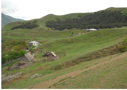
Resim 7: Sakuneti Köyü'nde Toprak Kayması

sayesinde oluşmaktadır. Yer kayması Samtskhe-Cavakheti Bölgesi'nin Akhaltsikh Belediyesi'nin Azğur, Tisel, Tkemlana, Gurkel, Ani, Abi, Naokhreb, Adigeni Belediyesi'nin Ude, Varkhan, Abastuman, Ttsakhnitskaro, Aspinza Belediyesi'nin Aspinza Kasabası, Nekelekevi, Atskvita, Kuntsa ve Rustavi'de olduğu gibi Sakuneti köyünde de tesadüf edilmektedir (Gaprindaşvili, 2016: 88-105). Köyün üst kısmında Tupi Tepesi yakınlarında "1956 yılındaki kayma bunun bir örneği olarak görülmektedir" (Gaprindaşvili, 2016: 93; Samkharadze, 2013: 54). (Resim 7).