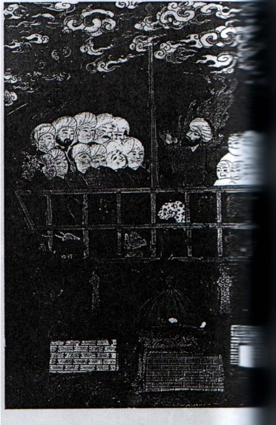
Resim 6: Nuh'un Gemisinden Kesit. ( Kısas-ı Enbiya SK. Hamidiye 980)