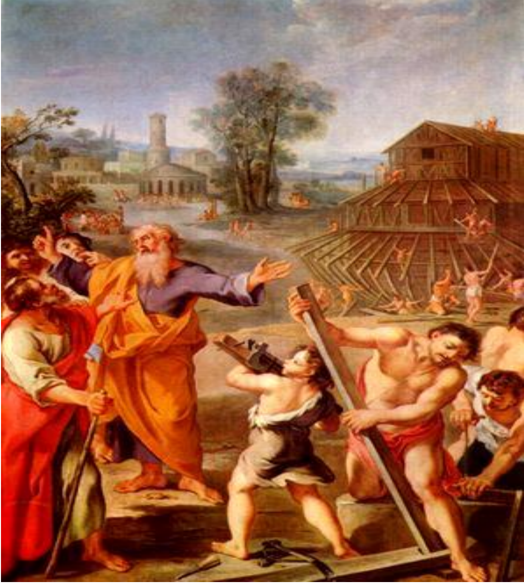
Resim 1: Gemi Yapımı Hazırlıkları