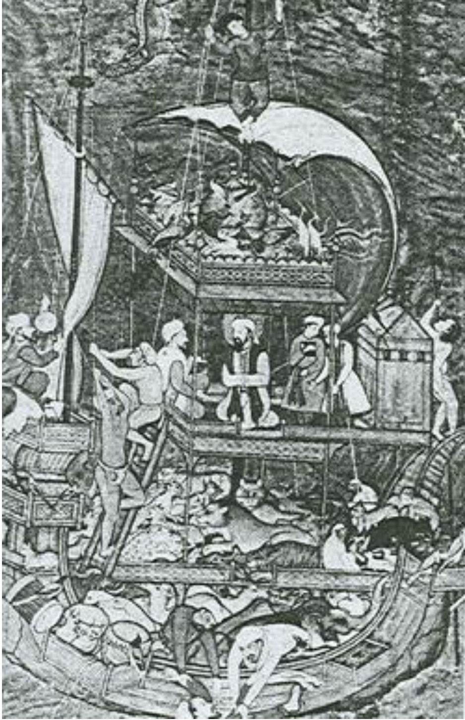
Resim 2: Nuh'un Gemisi