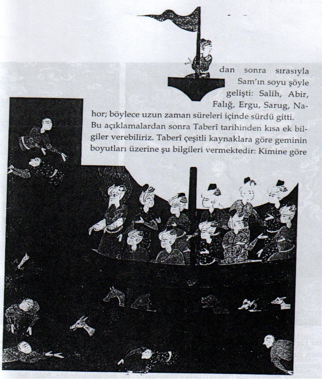
Resim 9: Tufanda Boğulanlar (Ravzatü's Safa SK Damat İbrahim Paşa 906)