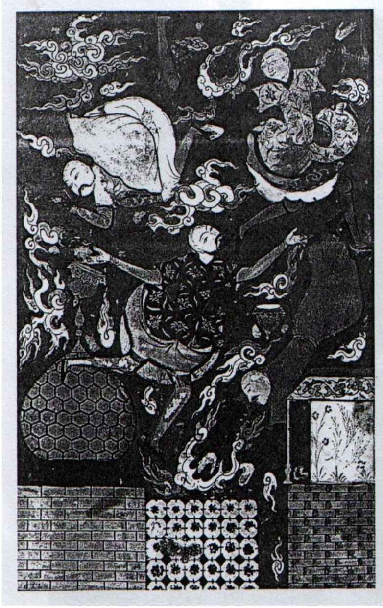
Resim 10: Hz. Nuh'a Karşı Çıkan Oğullarının Tufanda Boğulması ( Kıyas-ı Enbiya , Sk Hamidiye, 980)