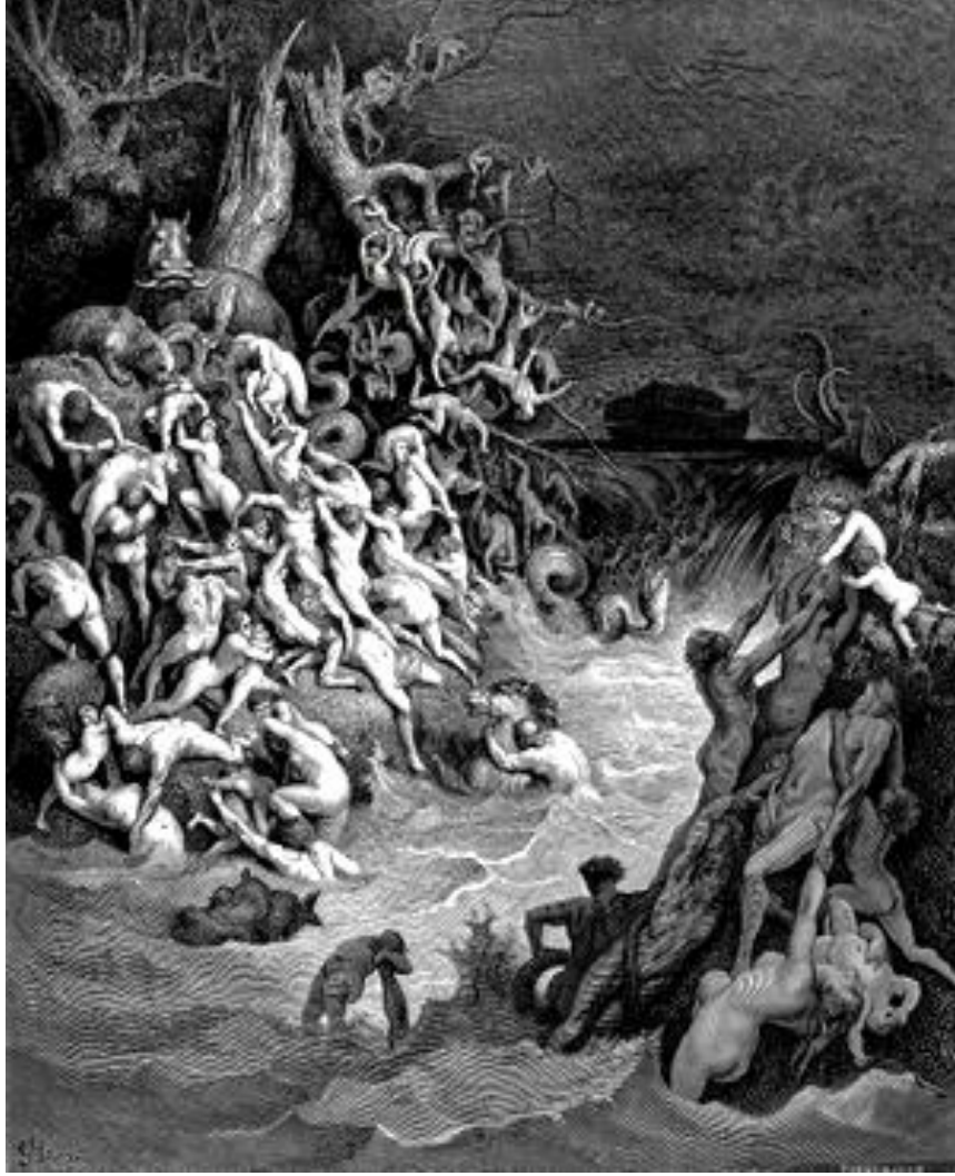
Resim 3: Tufanda Boğulanlar