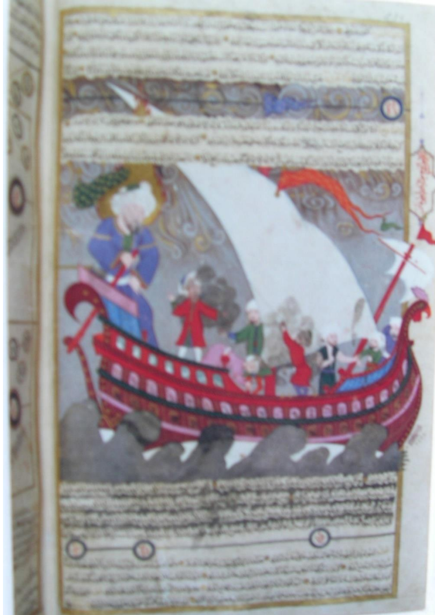
Resim 5: Nuh'un Gemisi (Zübde'tü't Tevarih, TİEM 1973)