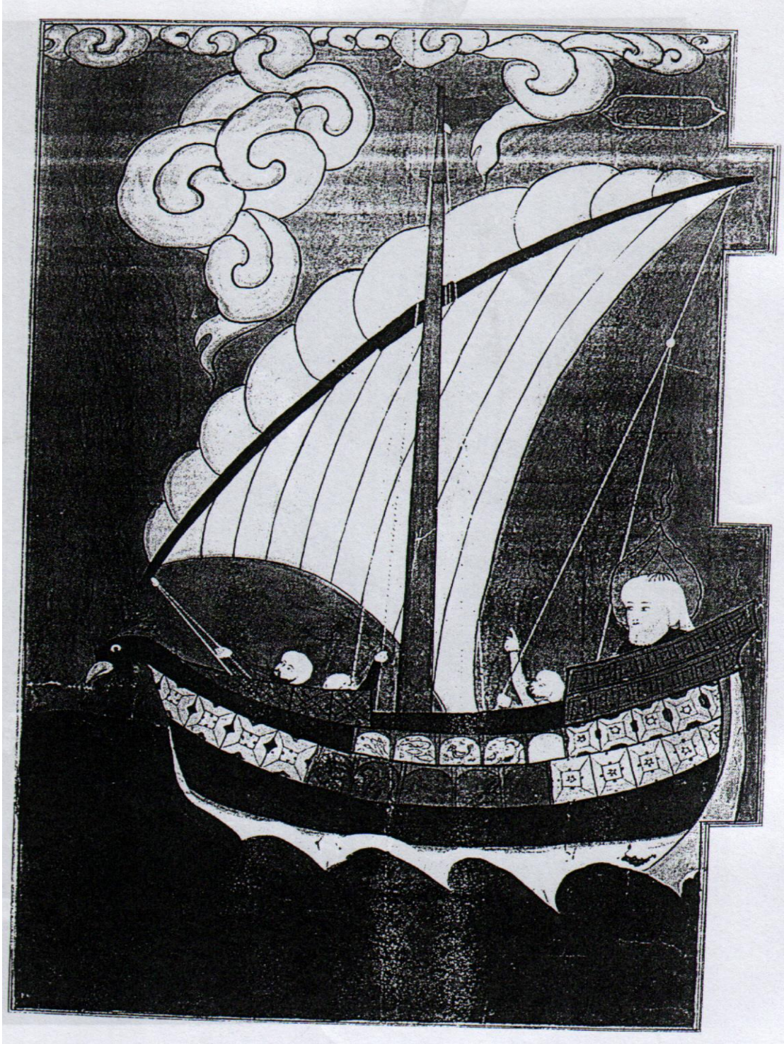
Resim 7: Nuh'un Gemisi (Zübdetü't Tevarih, CBL 414)