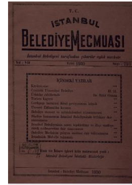
Resim 1. İstanbul Şehremaneti Mecmuası Kapak Sayfası (Soldaki Tıpkı Basım – Sağdaki Orijinal Nüsha)