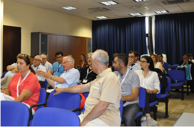
Kongreden bir oturum.