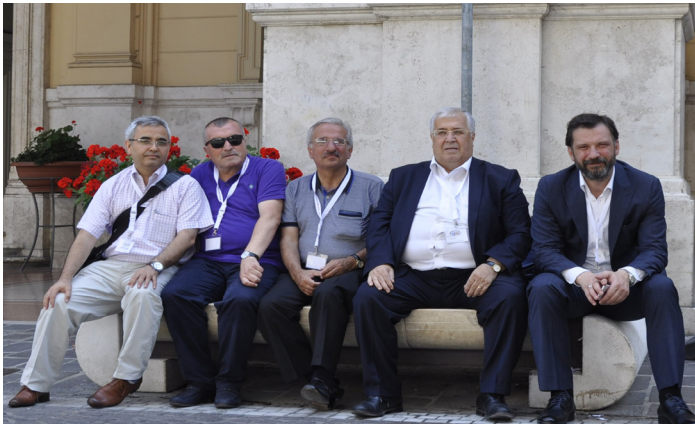
Türk dele- gasyonunun bir bölümü oturum arasında