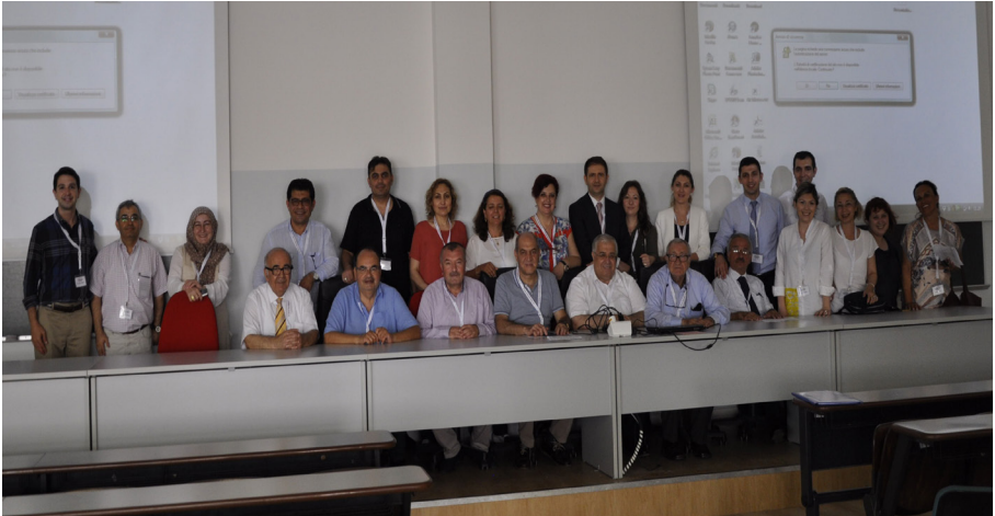
Türkiye'den bildiri sunan akademisyenler toplu halde.