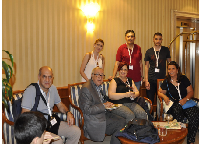
Türk delegasyo- nunun bir bölümü