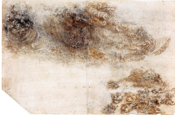
Şekil 4: Leonardo da Vinci, Diluvio, 1515, Royal Library collection

Kutsal kitaplarda yazan kıyamet günü bulutların ve şiddetli rüzgarların gazabına uğrayacaksınız ifadesi çalışmalarda; dağların doruklarında sarmalanmış bulutlar, kayalara vuran dalgalara benzer şekilde tasvir edilir. Toz, sis ve yoğun bulutlardan oluşan bu atmosfer koyu renklerin kullanımından kaynaklanan korkunç bir hava izlenimi verir. Yine Kutsal kitaplardaki imge betimlemelerinde karşılaştığımız doğal unsurların karakterizasyonu yansıtan dilsel ve görsel kodlar kullanır. Dağlardan inen yağmur suları vadilerden aşağı inerek evleri harabeye çevirir, nehirlerden akan sular taşarak su setlerini kırar, çok büyük dalgalar halinde akarak gelen sel, şehirlerin duvarlarını yıkmış gibi tasvir edilir.