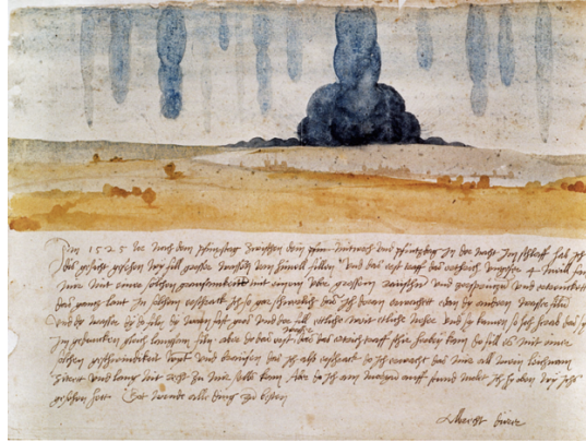
Şekil 8: Albrecht Dürer, Düş Yüzü (1525), 30 x 42,5 cm, kâğıt üzerine suluboya ve mürekkep, Sanat Tarihi Müzesi, Viyana

Tufan serisinin son noktası olarak kabul edilebilecek olan Albrecht Dürer'in 1525 tarihli "Dream Face" (Düş Yüzü) (Şekil 6) zamanının kıyamet düşüncesi bağlamında ele alındığında, Leonardo'nun Tufanları gibi tematize edilmiş olması şaşırtıcıdır.