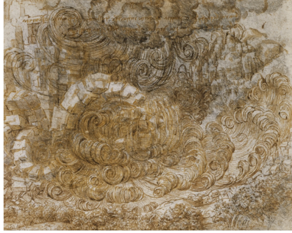
Şekil 5: Leonardo da Vinci, Diluvio, 1515, Royal Library collection The Artistic Adventure of Mankind, Leonardo Da Vinci, Part II, (2023 Haziran 8) https://arsartisticadventureofmankind.wordpress.com/tag/leonardo-da-vincis-codex-trivulzianus//

“Leonardo'nun tasvir ettiği felaketlerin halüsinasyonlu ve üzücü vizyonları, korkunç sel ve büyük fırtına ile insan uygarlığını yok edip parçaladığı görüntüler trajik ve soğukkanlı biçimde kavramsal olarak sunulur... Sanki modelden uzaklaşmış, betimlemeye ihtiyaç duymayan bir düşüncecinin içsellığı gibidir.” (Versiero, 2012:9)