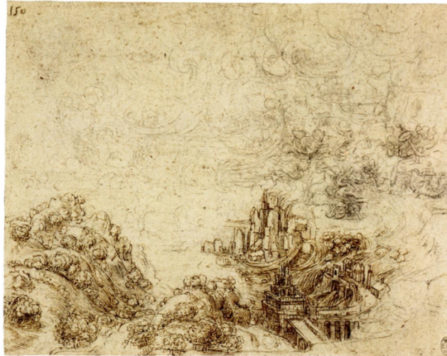
Şekil 3: Leonardo da Vinci, Kale ve viyadük bulunan bir köy üzerinde fırtına ve yükselen gelgit,1515, Castello di Windsor, Royal Library

Doğayı analiz etmek için birden çok yöntemi bir arada kullanan sanatçı, analiz için gerekli unsurları doğanın kendisinde arar; doğa olaylarını en iyi şekilde yansıtmak için sanat ve bilimi bütünleştirir. İzleyiciyi de durumu birden fazla perspektiften analiz etmesi için yönlendirir.