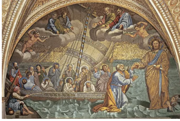
Şekil 2: Giotto Di Bondone, Navicella, (1266/7 –1337), Mozaik.

İlahi Vahiy Misyonerleri, Navicella- İnanç İkonu (2023 Haziran 8), https://www.mdrevelation.org/the-navicella-an-icon-of-faith/