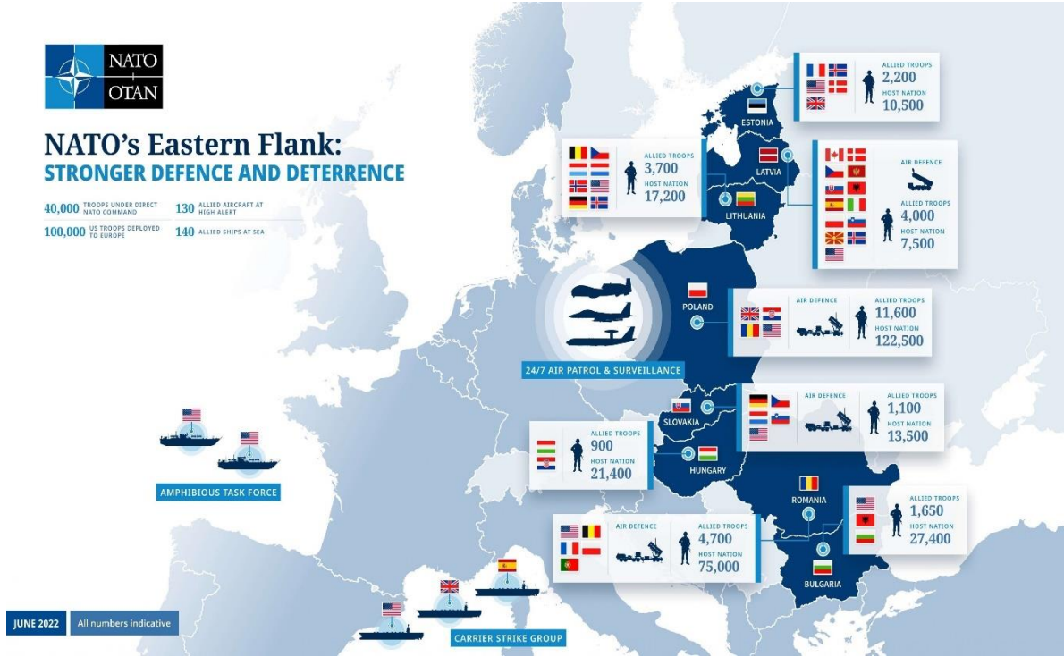
Resim 1: NDK'nın Askeri Gücü ve Konuşlandığı Ülkeler

Veriler incelendiğinde, Baltık bölgesine büyük bir askeri yığınak yapıldığı görülür. Üç Baltık ülkesi coğrafi olarak küçük ülkelerdir. Bu sebeple NATO askerlerinin büyüklüğünü o ülkenin ulusal silahlı kuvvetler sayısı ile kıyaslayarak anlayabilir. Estonya'nın 10.500 muharip askeri varken NATO 2.200 askeri konuşlandırmıştır. Yani Estonya'nın askeri varlığını NATO %22 artırmıştır. Şüphesiz NATO askerleri hem daha teknik hem de askeri teçhizatlarıyla bölgede varlar. Aynı şekilde 7.500 muharip askeri olan Letonya'ya 4.000 NATO askeri konuşlanmıştır. Yani Letonya'nın askeri sayısını NATO %53 artırmıştır. Litvanya için de durum aynıdır. 17.200 muharip askere ek olarak NATO 3.700 askerle Litvanya'da konuşlanmıştır. Böylece Litvanya ordusunu NATO, sayısal olarak, %21 artırmıştır.