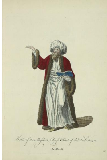
Görsel 10: Müftü ya da Türklerin İmamı Kıyafeti (Habit of the Mufti or Chief Priest of the Turks), 1700 (Jeffery, 1772, R.26)