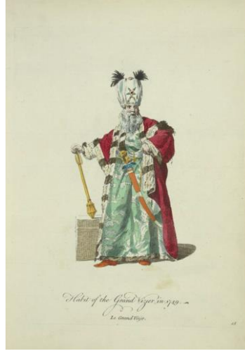
Görsel 8: Baş Vezir Kıyafeti (Habit of the Grand Vizier), 1749 (Jeffery, 1772, R.15)

Gravürlerde sunulan kıyafetler incelendiğinde farklı devlet görevlerini temsil etmelerine rağmen erkek giysilerinde kullanılan öğeler arasında büyük benzerlikler olduğu görülmektedir. Bunlardan en önemlisi iç kısmı kürklü kaftan veya pelerin ve sarıklardır. Sarıklarda mutlaka uzun ve kalın kuş tüyleri bulunmaktadır (G.7, 8 ve 9). Bunun dışında askeri görevlilerin belindeki kuşağa bağlı bir tür kılıç (G.8 ve 9) dikkat çekicidir. Bunlardan sarık ve kuşak, daha sonraları görsel sanatlarda -tek başına kullanıldığında dahi- Türk figürlerin seçilmesinde önemli ayrıntılar haline gelecektir. Zira daha 17. Yüzyıldan itibaren Osmanlı'yı ziyaret eden İngiliz seyyahlar Türk kahveleri, hamamları, seramikleri, halıları gibi unsurlardan çok etkilenmiş ve bunları İngiltere'de açma girişimlerinde bulunmuşlardır. Bunlar arasında kahvehane projeleri gerçekleşmiş; içerisinde kahve satılan ve Turk's Head ya da Sultan's Head olarak isimlendirilmiş tüm mekanların kapı girişlerinin üzerine sarıklı bir Türk figürünün başı yerleştirilmiştir ve yıllar içinde İngiltere'de sadece Londra gibi bir merkezde değil kasabalarda bile tanınır bir sembol haline gelmiştir (Yıldız, 2014, 553-554). Son olarak bu albüme -temsili bir örneği görüldüğü üzere- (G. 10) din görevlileri yukarıdaki genellemelerden bağımsız olarak sade beyaz uzun bir gömlek ve sarık ile üzerinde kaftanla, elinde ise Kuran olduğunu düşündüğümüz bir kutsal kitapla resmedilmiştir.