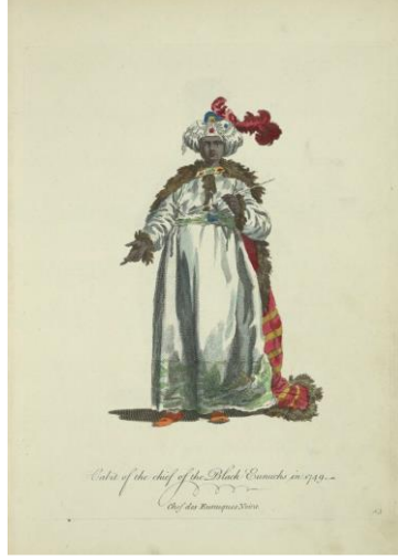
Görsel 7: Siyahi Hadım Ağası Kıyafeti (Habit of the Black Eunuch's), 1749 (Jeffery, 1772, R.13)