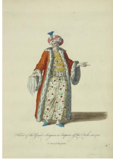
Görsel 5: Yüce Padişah ya da Türklerin İmparatoru Kıyafeti (Habit of the Grand Seignior or Emperor of the Turks), 1700, Sanatçısı bilinmiyor, (Jeffery, 1772, R.2)