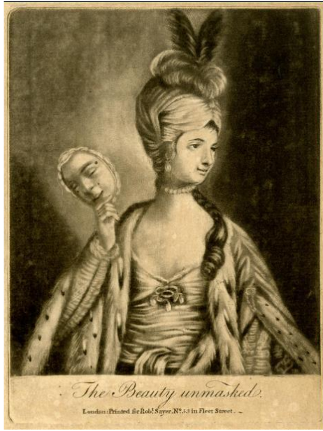
Görsel 4: The Beauty Unmasked, 1765-75, Robert Sayer için yapılmıştır, 15.1x11.2 cm British Museum:1874,0613.2671

(Kaynak: https://www.britishmuseum.org/collection/object/P_2010-7081-1649 Erişim tarihi: 30.04.2023).