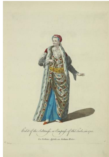
Görsel 6: Sultan ya da Türklerin İmparatoriçesi Kıyafeti, (Habit of Sultanness or Empress of the Turks) 1700, (Jeffery, 1772, R.4)

Çalışmada birer örneğine yer verebildiğimiz padişah (G.5) ve sultan (G.6) figürleri farklı türden giysiler ve aksesuarlarla tekrar tekrar resmedilmiştir (Jeffery, 1772, R.1-11). Figürlerde hem süs aksesuarları hem de kıyafetleri tamamlayan aksesuarlar resme ayrıntıyla işlenmiştir. Saç aksesuarları hemen hemen her resimde öne çıkmaktadır. Turquerie'nin bir özelliği olarak -nadir örnekler dışında- 18. yüzyılda İngiliz sanatında olduğu gibi bu albümde de harem ve hamam kavramlarına ne görsel ne de yazınsal olarak yer verilmiştir.