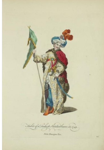
Görsel 9: Türk Sancaktar Kıyafeti (Habit of a Turkish Standardbearer), 1749 (Jeffery, 1772, R.23)