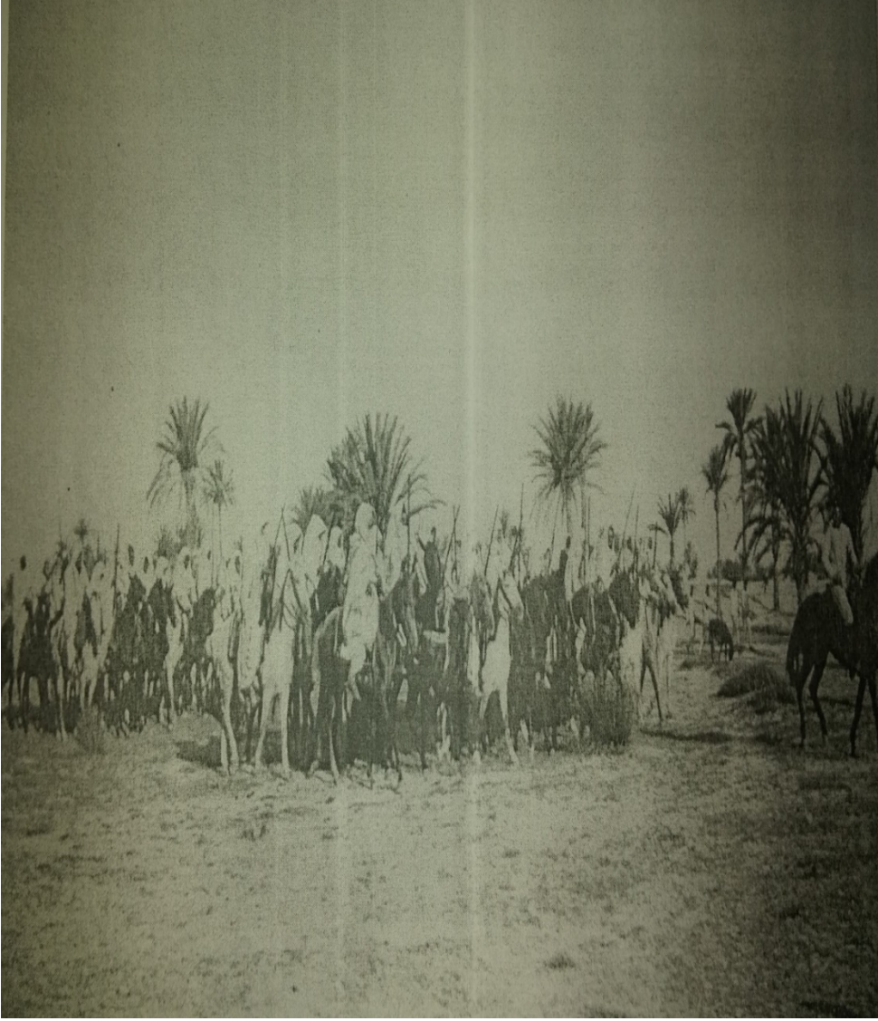
Ek-2. Trablusgarp'ta Kuloğulları Teşkilatı'nın yerine tesis edilen Hamidiye Süvari Alayları. Osmanlı Belgelerinde Trablusgarp , Devlet Arşivleri Genel Müdürlüğü Osmanlı Arşiv Daire Başkanlığı Yay., Yayın No: 125, İstanbul 2013, s. 479.