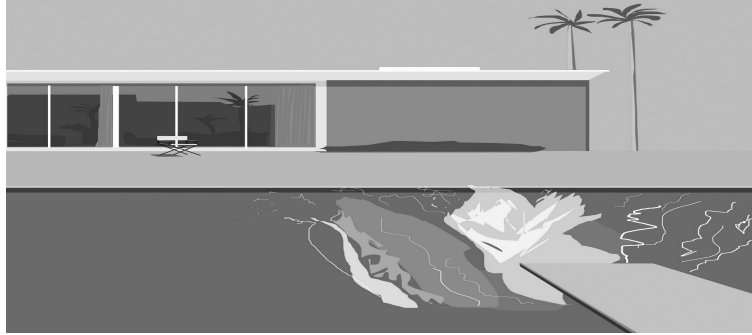
Resim 5. David Hockney, A Bigger Splash 1967, tuval üzerine akrilik, 243x244 cm.

Sanatçının resim 5'deki A Bigger Splash isimli çalışmasında; arka plan sıcak ve güneşli bir California gününü tasvir etmektedir ve geri planda orta sınıf bir modern California evi yer alır. Bu evin arkasında ve resmin sağ tarafına konumlandırılmış iki tane palmye ağacı bulunmaktadır. Camkânlı evin hemen önünde ve resmin merkezinin solunda katlanabilir bir yazlık sandalye yer alır. Ön planda, resmin kısmen yarısını kaplamış, büyükçe bir yüzme havuzu görülmektedir. Resmin ve yüzme havuzunun hemen sağından merkeze doğru uzamsal olarak kısalan bir trampenin olduğu resimde, havuzda oluşan büyük bir su sıçraması betimlenmiştir. Önceki çalışmalarında kimi zaman giyinik çoğu zamansa çıplak erkek figürlere yer vermesine karşın bu çalışmasında herhangi bir figür kullanmamış olan sanatçı, yine de izleyiciye gizemli bir figürü hissettirmektedir.