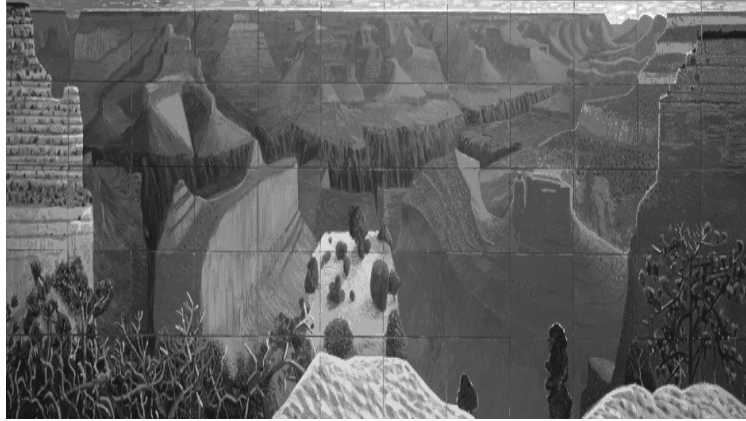
Resim 8. David Hockney, A Closer Grand Canyon , 1998, 60 adet tuval üzeri yağlıboya, 206x740 cm.

Hockney bu çalışmalarında; bütün bir kompozisyonun makro kadrageyi, farklı açı, uzaklık ve farklı ışık zamanlarında, 35 mm. Polaroid fotoğraf makinesi ile fotoğraflamış ve bu fotoğrafları birleştirerek, bütün kompozisyonu, bozuma uğratılmış olarak tekrar elde etmiştir. Sanatçı, 63 fotoğraftan oluşan bu fotomontaj çalışmasıyla perspektif ve boşluk kavramlarını yeniden tanımlamayı amaç edinmiş gibi görünmektedir. Hockney'in bu tavrının, perspektif ve boşluk problemlerini anlamlandırmaya çalışan, klasik Kübist sanatçıların resim tavırlarıyla örtüştüğünü söylemek mümkündür.