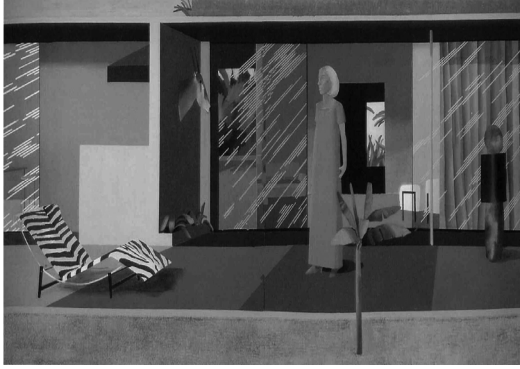
Resim 4. David Hockney, Beverly Hills Housewife , 1966, ikili tuval üzerine akrilik, 183x366 cm.

Hockney'in resimlerindeki ilk dönüşüm 1960'ların sonlarında Los Angeles'i ziyaret etmesiyle başlar ve Amerikan orta sınıfının yaşam biçimi, onun esas konusunu oluşturur. Resim 4'te, merkezin sağında, pembe elbisesinin içerisinde, ayakta duran kadın, sanatçının yakın arkadaşlarından birisi, Amerikalı fotoğraf sanatçısı Betty Freeman'dır (Jones, 2006).