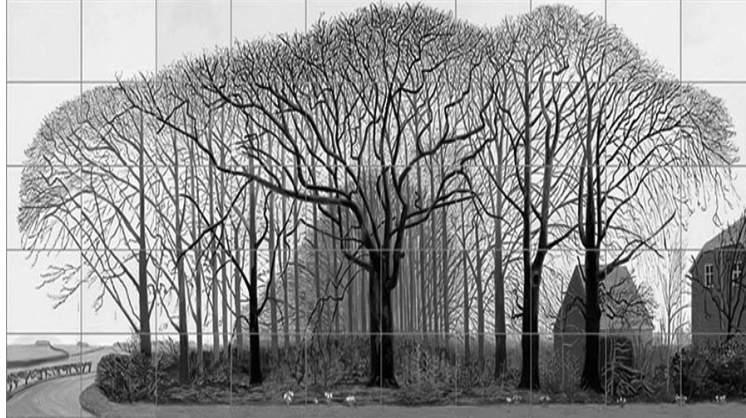
Resim 10. David Hockney, Bigger Trees Near Warter ya da ou Peinture sur le Motif pour le Nouvel Age Post-Photographique , 2007, 50 adet tuval üzerine yağlıboya, 457x1220 cm.

Livingstone gibi Hockney de Kanyon Resimleri'nin izleyici de oluşturduğu algı için şu açıklamayı getirir "Büyük Kanyon'un kenarında ayakta durmak hem korku verici hem de uzaysal bir şey. Bu kanyon, kenarından onu seyredebileceğiniz dünyadaki en büyük boşluk" (Weschler, 1998: 28).