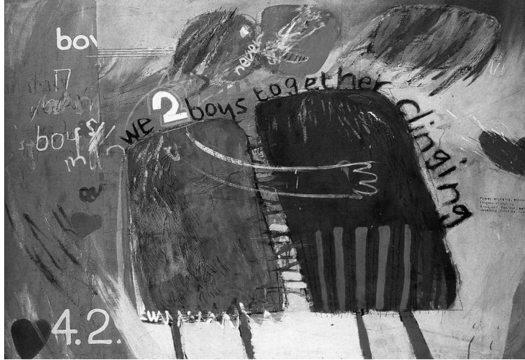
Resim 2. David Hockney, We two Boys Together Clinging Together , 1961 panel üzeri yağlıboya, 122x152 cm.

Gene bu dönemde yaptığı çalışmalarının bir diğer özelliği de, Kinley'in de belirttiği gibi; sanatçıda gözlemlenen çocuksu çizme ve boyama isteğidir. Gene kimi resimlerinde, Hockney'in, evlilik konusunu işlediği fark edilmekte, geleneksel-modern, alışlagelmiş-aykırı gibi evliliğin karşıt biçimleri üzerinde durduğu gözlenmektedir (Kinley, 2003).