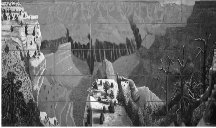
Resim 9. David Hockney, A Bigger Grand Canyon , 1998, 60 adet tuval üzeri yağlıboya, 207.0x744.2 cm.

Sanat tarihçisi Marco Livingstone'a göre kanyon resimlerinin izleyici üzerindeki etkisi çok büyüktür. Çünkü izleyici kendisini kanyonun hemen kenarında duruyormuş gibi hisseder ve uçurumdan aşağı doğru bir boşluğu izlerken bulur (Livingstone, 1999: 1).