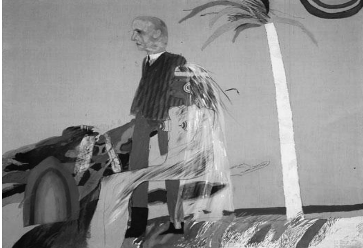
Resim 1. David Hockney, The First Marriage (A Marriage of Styles I) 1962, tuval üzerine yağlıboya, 183x214cm.

Hockney'in, eğitim gördüğü Kraliyet Akademisi yıllarında yarı-soyut, yarı-figüratif veya soyutlama olarak nitelendirebileceğimiz çalışmalar yaptığı gözlemlenmektedir. Konularını kendi çevresinden seçtiği fark edilen bu dönem çalışmalarının en bilindik örneklerinden birisi olan The First Marriage çalışmasını inceleyecek olursak, resimde bir çiftin betimlendiğini görürüz. Resimdeki bu iki figürden kadın olanı oturmuş olarak, profilden görülmektedir. Erkek figür, oturan Kadının hemen yanında ayakta durmaktadır. Her ikisinin de yüz akları tuvalin soluna çevrilmiştir. Arkalarında, naturalist renklerle boyanmaktan çok uzak olduğu fark edilen bir palmye ağacı vardır. İki figür de gerçekçi yorumlamaya hem yakın hem de uzaktırlar. Resimdeki erkek figürünün portresinde ayrıntılar kısmen resimlenmiş, kadın figürün portresi ise çok az ton kullanılarak sade bir kırmızı ile betimlenmiştir. Erkek figürünün üst kısmı, tipik batılı giyim tarzı ile resmedilirken, alt kısmı sade, gri bir ton ile boyanmıştır. Kadının üzerindeki kıyafet ise geleneksel mısır giyim formlarını andırmaktadır. Figürlerin duruş pozisyonları da Mısır duvar resimlerindeki gibi yarı frontal bir görünüş sergiler. Hockney'in 1960'larda yaptığı resimlerinin karakteristik özelliklerindeki gibi bu resmin fonunda da bir boşluk gözlenmektedir.