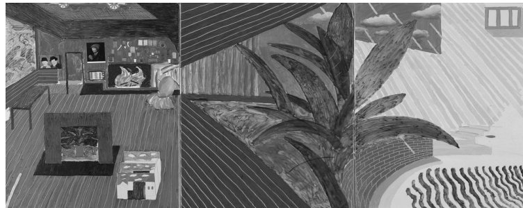
Resim 6. David Hockney, Hollywood Hills House , 1981-82 tuval üzerine yağlıboya, füzen ve kolaj, 152x305 cm.

1970'li yıllarda tekrar bir değişim sürecine giren sanatçı, özellikle Picasso'nun 1973 yılındaki ölümünün ardından, en büyük usta dediği sanatçının anısına saygı niteliğinde kübist izler taşıyan resimler yapmaya başlar. 1980'lere tarihlenen bu resimlerinde geometrik mekân kurgulamalarının yanı sıra fovist renk paleti de resimlerinde öne çıkan teknik özellikler olmuştur. Sanatçının, Hollywood Hills House isimli 1981-82 yıllarına tarihlenmiş resmi (Resim 6) üç parçalıdır ve karışık malzeme kullanılarak yapılmıştır. Sol panel diğer iki panelden kopuk olarak resmedilmiştir. Diğer iki panelden ayrılmış olarak duvarda asılı duran bu resimde, içerisinde ateş yanan bir şömine ile bir evin iç mekânı tasvir edilmiş olup, orta ve sağ panelde bahçe duvarı gökyüzü ve irice bir süs bitkisinin de yer aldığı dış mekan tasviriyle alanların parçalanması sağlanmıştır.