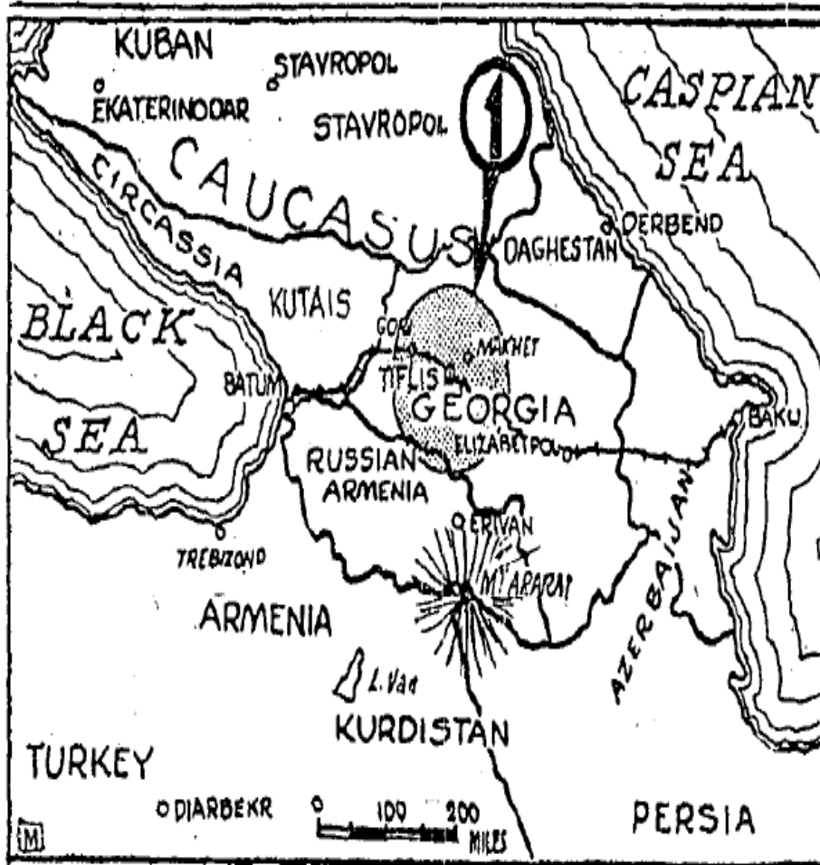
Gori depreminin haritası 58 .