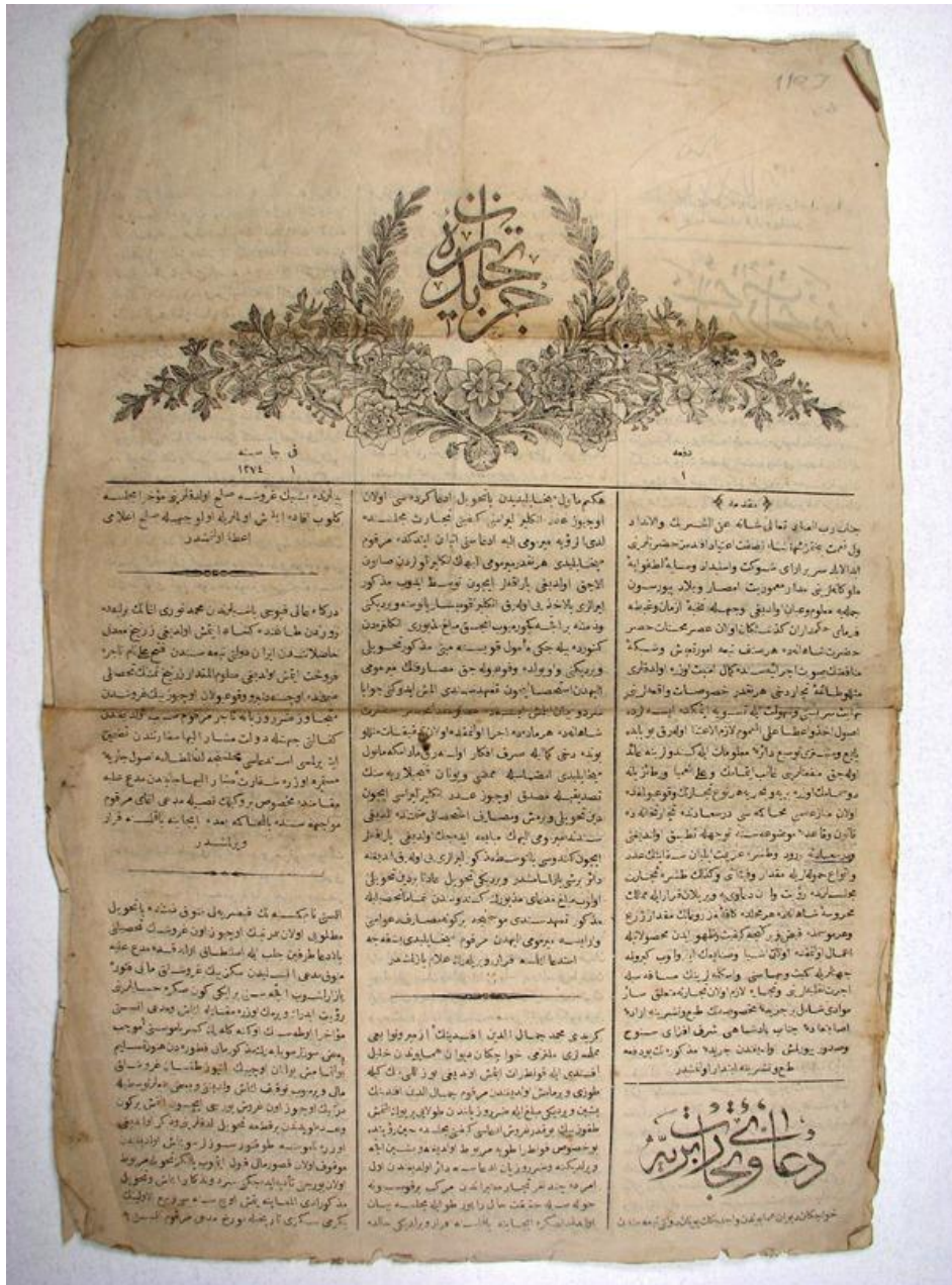
Ceride-i Ticaret'in Birinci Sayısının İlk Sayfası