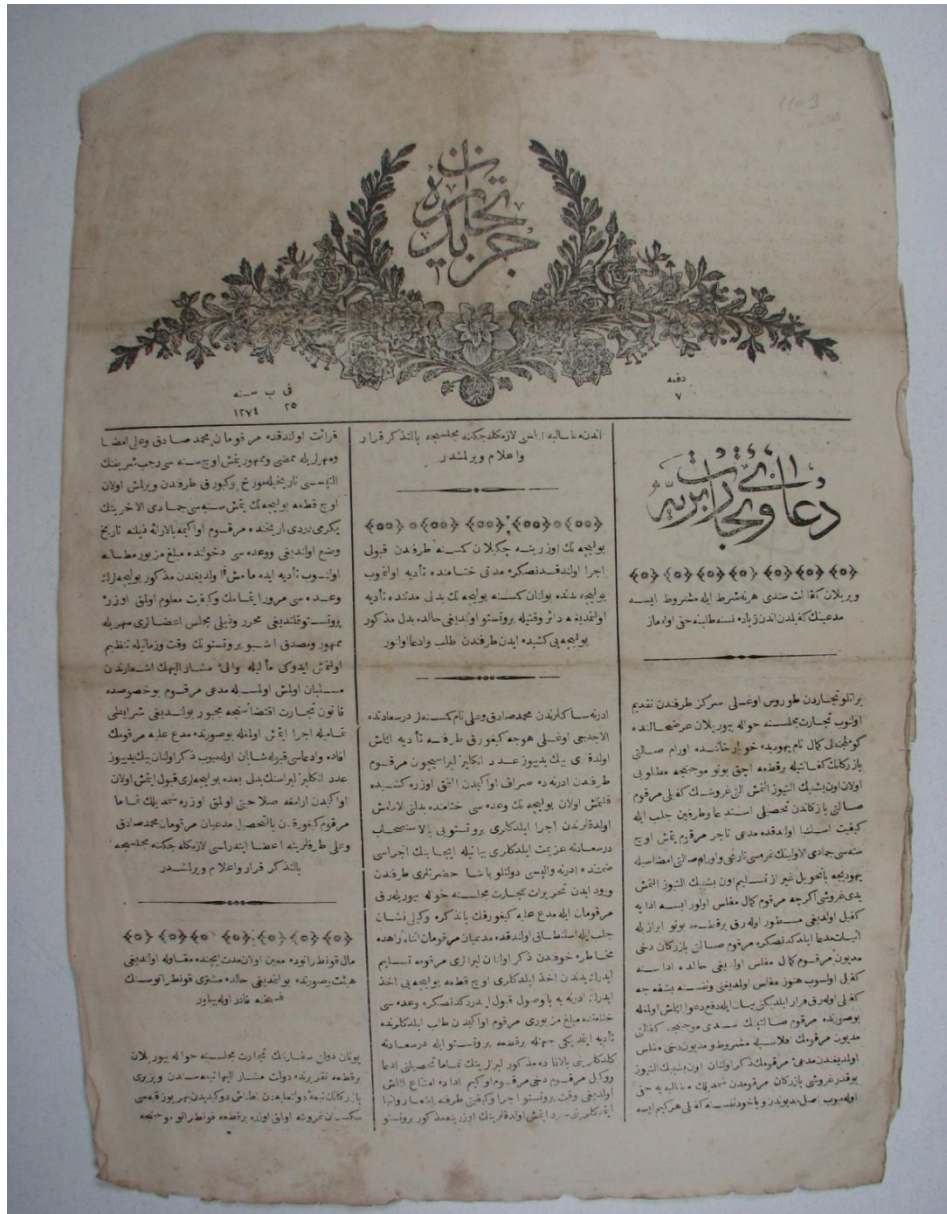
Ceride-i Ticaret'in Yedinci Sayısının İlk Sayfası