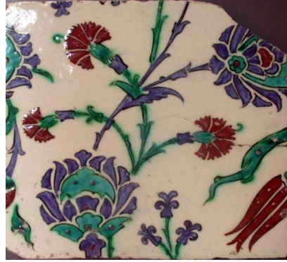
Res. 6: İznik çinisi, 17. yüzyıl. (Topkapı Sarayı Müzesi, Env. no. 250b3)

Elsley kataloguna 22.2.1887 tarihinde 2/104 ve 5/105 numaralarıyla kaydedilmiş, büyük bir panoya ait iki çini daha bulunmaktadır (Res. 7a-b). 11 Bu çiniler de İznik'te üretilmiş yaklaşık 1545 yıllarına ait çinilerden örnek alınmıştır. 12