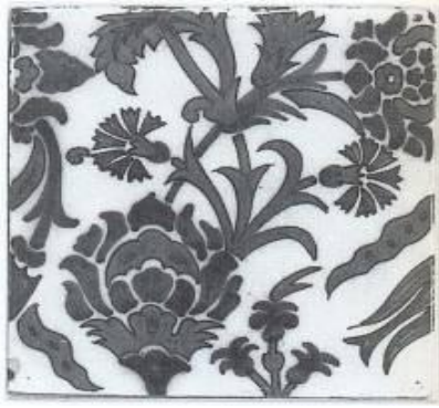
Res. 5: Hollanda çini tasarımı, 1920-40 (Pluis 1997, Kat. no. A.01.30.59)