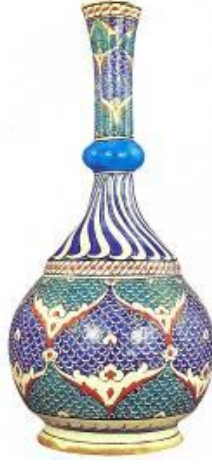
Res. 11: İznik sürahi, 16. yüzyıl. (Paris, Musee de Louvre, G. 1983. 116)