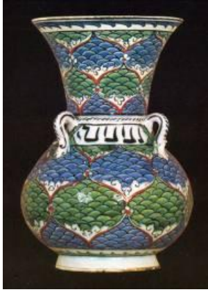
Res. 10: İznik kandil, 16. yüzyıl. (Nihal Kuyaş Koleksiyonu, L)

lejandroyla verilmektedir. 16 Ticari amaca hizmet eden bu kataloglarda bitkisel motifler için kullanılan “Persian flowers” tanımlaması, olasılıkla yoğun İran halısı ticareti nedeniyle tanınan desenlerden kaynaklanmaktadır.