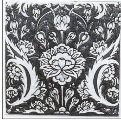
Res. 1: Hollanda çini tasarımı, 1890-1920. (Pluis 1997, kat. no. A.01.30.63)