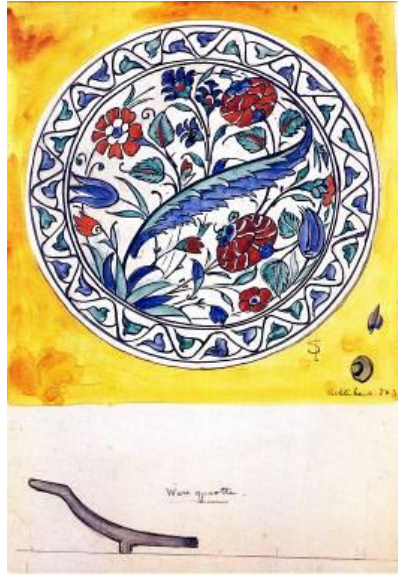
Res. 13: L. J. Senf'in tabak tasarımı, 1910. (Spaander 1986, 205-6)

taşımaktadır (Res. 13). 18 Bu tasarımlardan birine göre üretilmiş olan Delft seramik tabağı bugün Lahey Gemeentemuseum koleksiyonundadır (Res. 14). 19