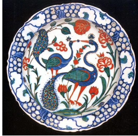
Res. 18: Hollanda üretimi tabak, De Porceleyne Fles 1910-40. (Delft, Stedelijk Museum het Prinsenhof, PDA. 249)