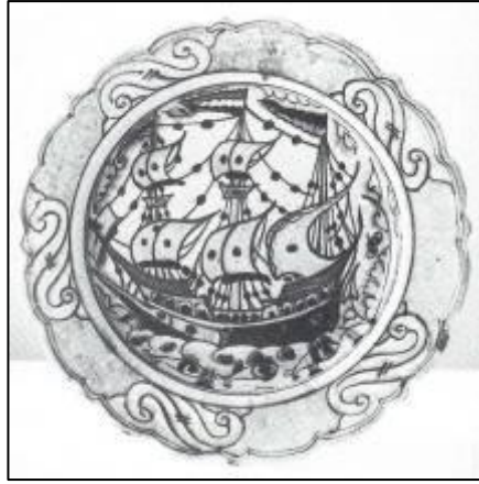
Res. 15: Hollanda üretimi tabak, De Porceleyne Fles 1909-10. (Den Haag, Rijkdienst Bildende Kunst, AA. 2768)

Leonardus Senf imzasını taşıyan Lahey Kraliyet Güzel Sanatlar koleksiyonundaki kalyon tasvirli tabak 20 (Env. no. RBK, AA. 2768), Atina Benaki Müzesi'nde korunan 1625-50 yıllarına ait İznik tabağın 21 (Env. no. 35) adeta birebir kopyasıdır (Res. 15).