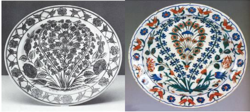
Res. 16: Hollanda üretimi tabak, De Porceleyne Fles 1910-49. (Delft, Stedelijk Museum het Prinsenhof, PDA. 250)