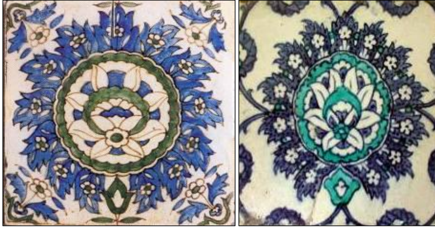
Res. 3: Hollanda çinisi, 1920-40. (Pluis 1997, kat. no. A.01.30.62)