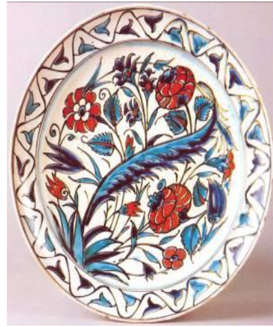
Res. 14: Hollanda üretimi tabak, De Porceleynne Fles (Den Haag, Gemeentemuseum)