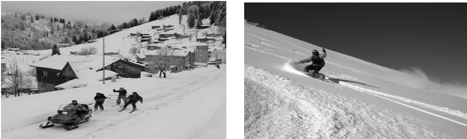
Fotoğraf 8. Kaçkar Dağları ve çevresinde kış sporlarından kar motoru, lastik botla kayma ve snowcat ski gibi faaliyetler de yapılabilmektedir.