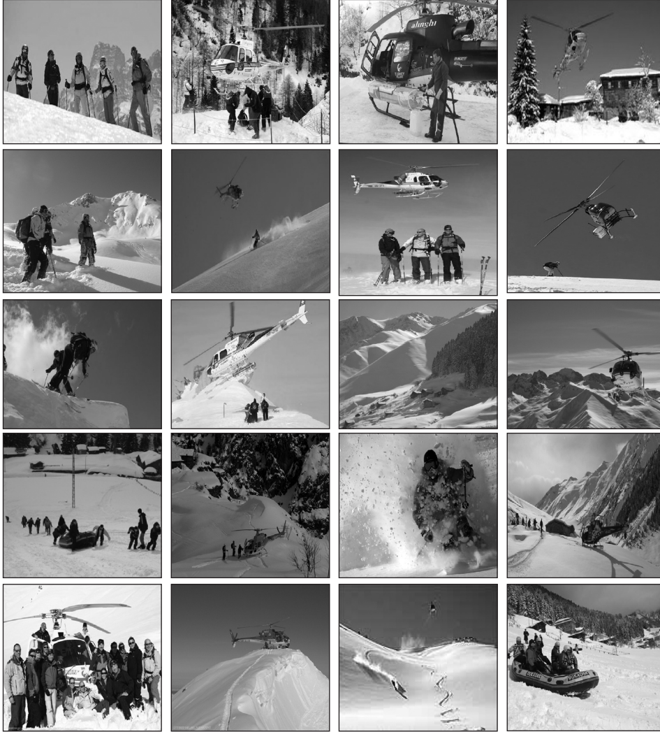
Fotoğraf. 6. Kaçkarlardaki heliski sporu etkinliklerinden görüntüler.

gösterilerek, korumaya yönelik gerekli çalışmalar yapılmaktadır. Helikopter uçuşları ve kayak faaliyeti sırasında yaban hayatının etkilenmemesi için gerekli önlemler alınmakta ve sporcuların çevre konusunda son derece duyarlı olmaları istenmektedir. 10 kişilik gruplar halinde yüksek kesimlerde kayan sporcuların, kesinlikle daha önceden belirlenmiş rotanın dışına çıkmalarına izin verilmemektedir. Bu alanların da orman sınırının üzerinde, yaban hayatının ve endemik bitkinin olmadığı ya da çok az olduğu yerler olması, fauna ve floranın etkilenmemesi açısından önemlidir.