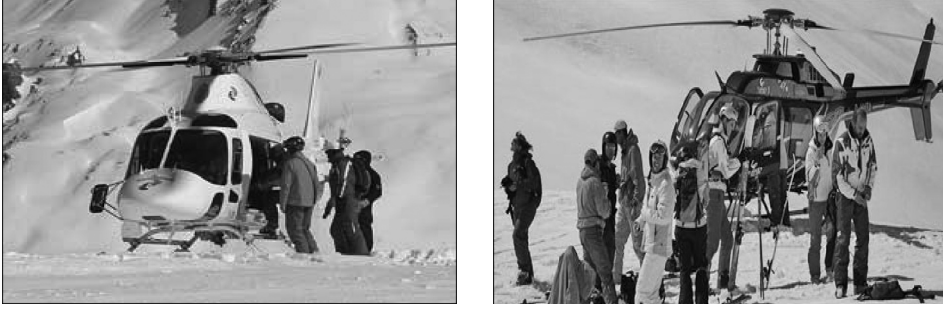
Fotoğraf 7. Kaçkar Dağları Uzun Devreli Gelişim Planı'nın sağladığı izinle, heliski helikopterleri zirvelere iniş gerçekleştirebilmektedir.