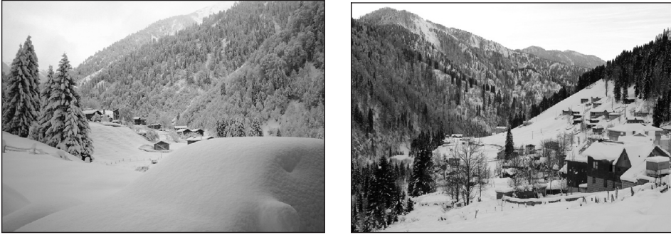
Fotoğraf 2. Heliski tutkunlarına konaklama imkânı sunan Ayder Yaylası.

Heliski, ülkemizde henüz pek fazla bilinmeyen bir spor dalı olarak dikkat çekmektedir. Türkiye'de bu spor, Kaçkar Dağları'nın Rize sınırları içinde kalan Çamlıhemşin ve 2009 yılı itibarıyla de İkizdere vadisi ve Trabzon Uzungöl 'de gerçekleştirilmiştir. Türkiye'de bu sporun yapıldığı ilk yer olan Kaçkar Dağları'nın Rize'nin Çamlıhemşin ilçesinde kalan bölümü, Ayder Yaylası'ndaki konaklama imkânı nedeniyle heliski tutkunlarının giderek yoğun ilgisini çekmektedir (Fotoğraf 2).