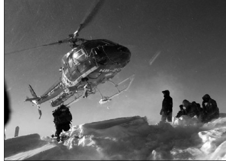
Fotoğraf 3. Kayarak vadilere inen kayakçılar, helikopterlerle tekrar zirvelere taşınmaktadır.

sislerinin bulunduğu Ayder Yaylası'na taşınmaktadır. Aynı durum İkizdere ve Uzungöl'de konaklayan kayakçılar için de söz konusudur.