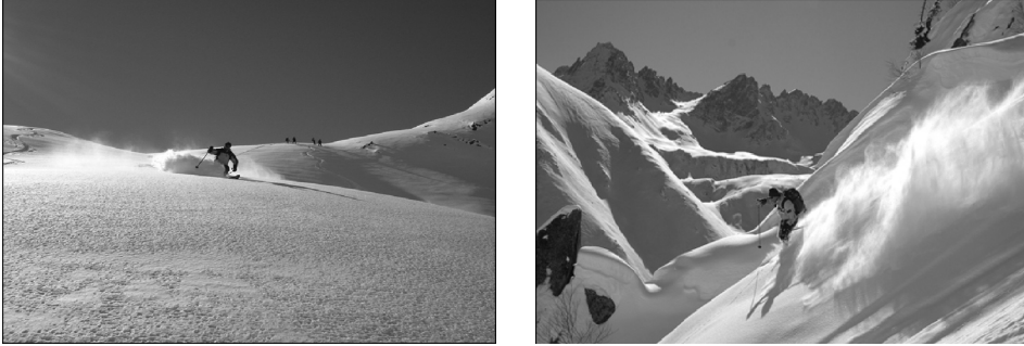
Fotoğraf 4. Heliski çoğunlukla orman sınırının üzerinde ve yerleşme alanlarından uzakta yapılmaktadır.

Kaçkarlardaki heliski turlarının ücretlendirilmesi iki şekilde yapılmaktadır. Bu uygulamaların birincisi, irtifa kaybına dayalı olan paket turlardır. Bu organizasyonda belirtilen irtifa kaybı, kayakçının helikopterden indiği nokta ile kaydığı ve helikopterin onu geri götürmek için alacağı nokta arasındaki yükseklik farkı olarak tanımlanmaktadır. Bu uygulama ile haftalık 20 bin metre garanti, 30 bin metre irtifa kaybı, paketin içerisine dâhil edilmektedir. Bu irtifa kaybının, 20 bin metrenin altında kalması durumunda ödenen ücretin bir kısmı kayakçılara iade edilmektedir. 30 bin metreye kadar başka bir ödeme yapılmamaktadır. Böylece bir günde bir müşteri 3 - 4 bin metre irtifa kaybı ile kayak yapabilme imkânına sahip olmaktadır. Başka bir ifadeyle heliski tutkunları, 1 haftada yaklaşık 30 kilometre heliski yaptıktan sonra ülkelerine dönmektedirler.