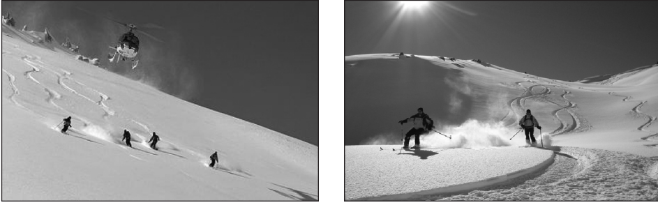
Fotoğraf 1. Türkiye’de heliski ilk kez Kaçkar Dağları’nda gerçekleştirilmiştir. Bu dağlar, heliski için oldukça elverişli şartlara sahiptir.

Heliski, sporcu ve kayakçıların helikopterle zirvelere ve yükseklerle çıkarılarak gerçekleştirilen dağ kayağıdır. Başka bir anlatımla; heliski, uzman rehberler eşliğinde profesyonel kayakçılar tarafından kar kalınlığının çok yüksek olduğu zirvelerde yapılan bir adrenalin sporudur. Tutku, adrenalin, maceraperestlik heliski sporunu en iyi tarif edebilecek kelimeler olarak kabul edilmektedir. Halen dünyanın en tehlikeli ve elit sporlarından biri olarak görülmektedir. Heliski; kayakla ilgili hiçbir altyapısı olmayan yerlerde kayak yapmak için, kayakçıların konakladıkları yerlerden helikopterle alınıp, kayak yapılacak yüksek zirvelere bırakılması ve ardından da kayakçıların kayarak indikleri yerlerden helikopterle tekrar alınarak, konaklama yerlerine geri götürülmeleri ile gerçekleştirilmektedir. Bu sporun en önemli özelliği, kayak merkezinden ve kayak pistinden uzakta, yüksek dağlık alanlarda, tabiatla iç içe, bol karın üstünde yapılmasıdır (Fotoğraf 1).