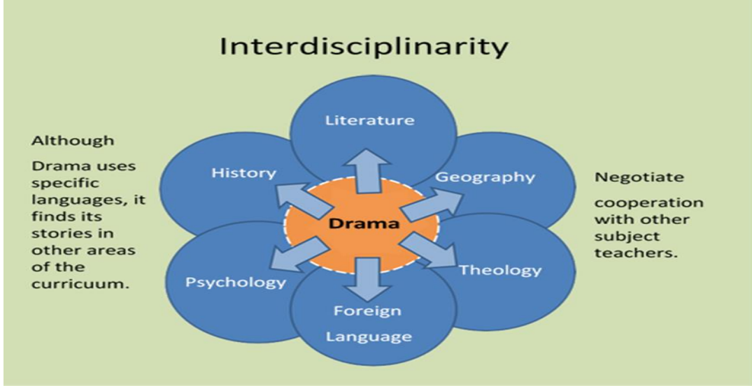
Şekil 1. Dramanın disiplinler arası kullanım potansiyeli (Özgül, 2015).

Aşağıdaki görselde dramanın farklı disiplinlerle olan ilişkisi görülmektedir.